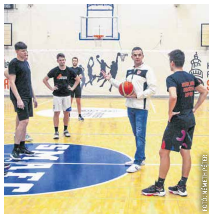
A Soproni Sportiskola Kosárlabda Akadémia U18-as együttese veretlenül vezeti a tabellát a bajnokság félidejében.