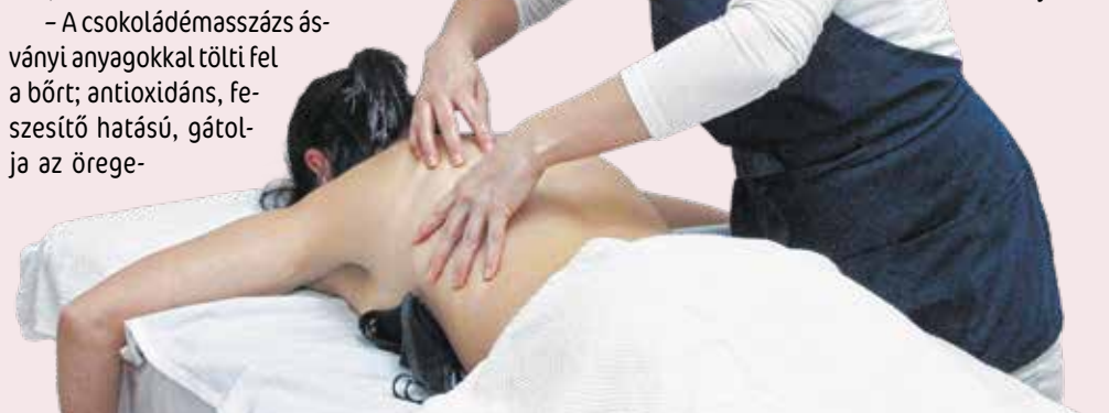
Izomfájdalmak, stressz esetén is csodákat tesznek a különböző masszázsok.

Az eljárás során a bőrt és az izmokat hideg és meleg kövek váltogatásával stimulálják.