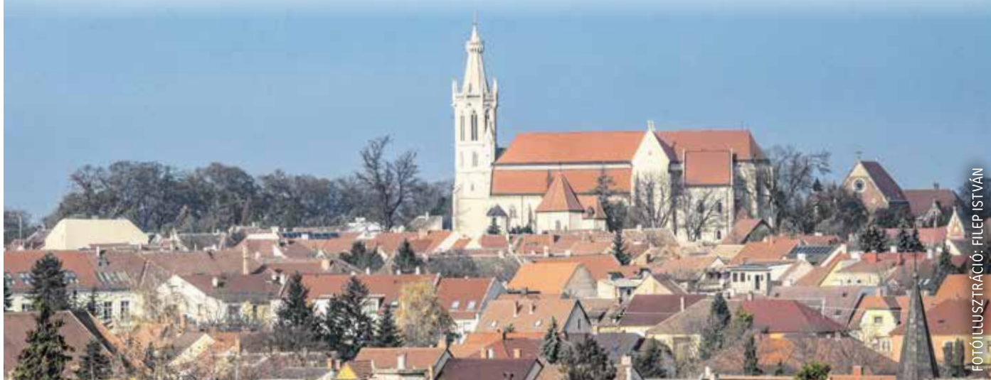
A 485 millió forintos támogatást a megemelkedett energiaköltségek részbeni fedezésére lehet felhasználni azokban az intézményekben (például bölcsődék, óvodák, iskolák, szociális intézmények), amelyek biztosítják a város alapvető működését.

Szerkesztőségünk fennállása óta elkötelezett a soproni emberek bemutatása mellett. Ezt a vállalkásunkat a jövőben is tartjuk, sőt szélesíteni kívánjuk újabb és újabb olvasóink megismerésével. Ezért olyan embereket keresünk, akik szűkebb-tágabb környezetükben valamiért kiérdemelték a körülöttük élők szeretetét, tiszteletét. Lehet ő egy nagymama, másokon segítő ezermester vagy tanácsadó, egy közösség szervezője vagy aktív tagja. Szóval bárki, akire felnéznek olvasóink! Ha ismernek ilyen embert a környezetükben, írják meg nekünk, hogy ki ő, hogy érhetjük el, és hogy miért olvasnának róla örömmel a Soproni Témában! Leveleiket a szerkesztoseg@sopronite-ma.hu e-mail-címre várjuk!