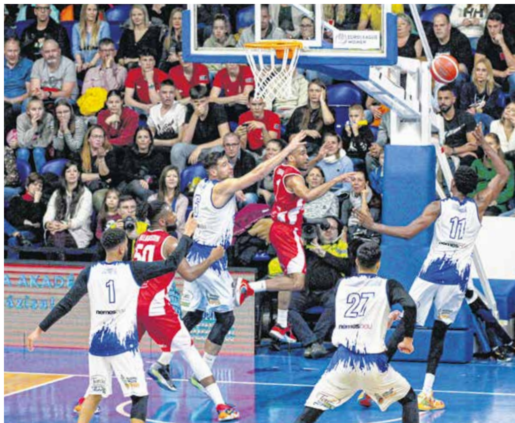
A Szolnok ellen ugyan nem sikerült győzni, de az SKC vezetése bízik a további jó szereplésben.