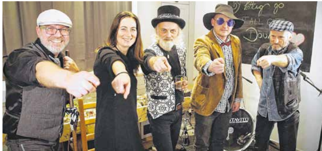
Idén – a tervek szerint – több fesztiválon is fellép a Crazy Daisy Jug Band.

– Mit jelent számotokra a soproni buli? – Viszonylag ritkán adó- dott alkalom arra, hogy Sopronban zenélhessünk, részben a pandémia miatt is. A Búgócsigában utoljára 2020 februárjában játszottunk nagy sikerrel, pont a koronavírus- járvány előtt. Úgyhogy nagyon örülünk, hogy