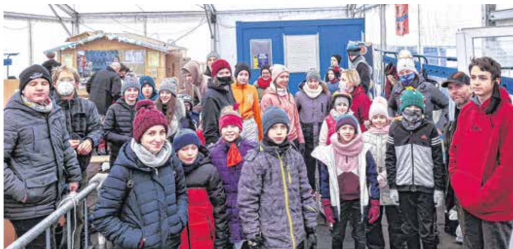
A nagycsaládosok a téli szünet első napján közös örömkorcsolyázáson vettek részt.