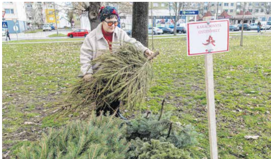
A „Karácsonyfa-gyűjtőhely” táblákkal jelzett pontokra már ezen a hétvégén sokan kivitték a fákat.

A Sopron Holding Zrt. azokról a lakótelepekről, kijelölt gyűjtőpontokról szállítja el a kihelyezett fenyőket, melyeken egész évben zöldterületi munkákat végez. A „Karácsonyfa-gyűjtőhely” táblákkal jelzett helyekről január elejétől egy hónapon át viszik el a díszüket vesztett fákat.