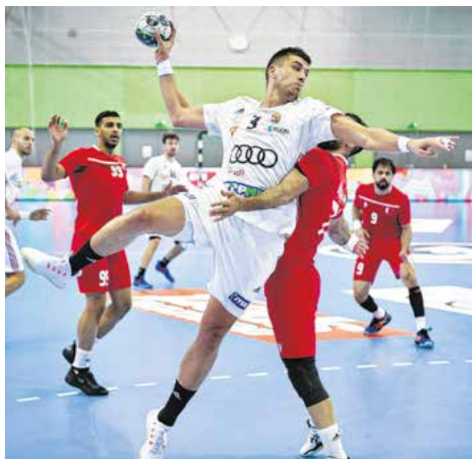
A magyar válogatott nyert a Bahrein elleni felkészülési meccsen.

A magyar-holland összecsapást nagy érdeklődés övezi, így előreláthatólag telt ház előtt rendezik meg a 20.022 ülőhellyel rendelkező MVM Dome-ban.