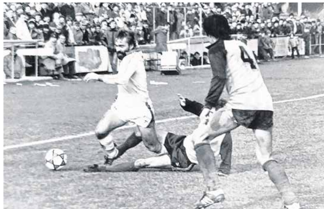
Az SSE színeiben akcióban a szakállas támadó – bombalövéseiről volt híres.

Soproni profi pályafutása lezárásaként 1990. február 6-án Sopronban a Ferencváros elleni barátságos