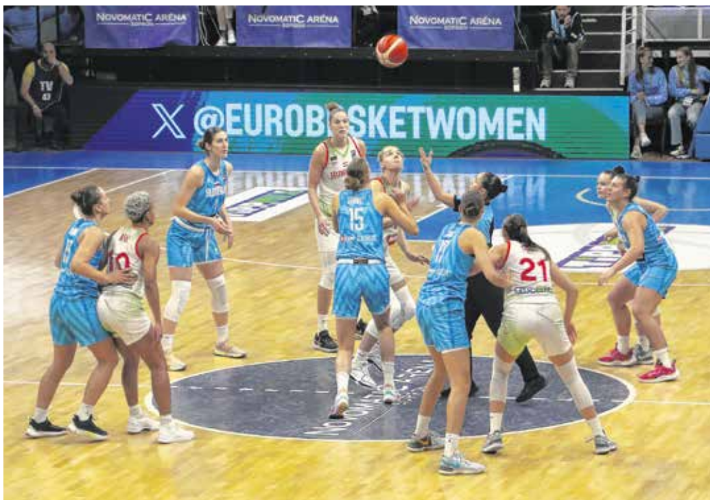
Legutóbb november 9-én játszott Sopronban Eb-selejtezőmérkőzést a magyar válogatott, akkor a hölgyek 70–51-re nyertek a szlovén nemzeti csapat ellen.