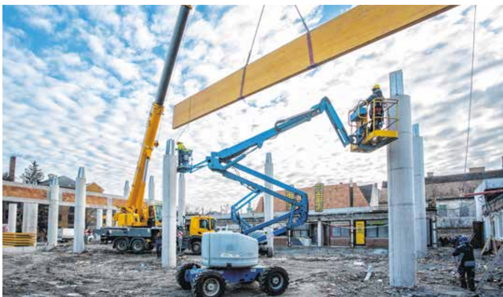
Látványos szakaszához érkezett a soproni piac felújítása – múlt héten már a helyükre emelték az új tetőszerkezet tartógerendáit is.

Szerkesztőségünk elkötelezett a soproniak bemutatása mellett. Olyan embereket keresünk, akik szűkebb-tágabb környezetükben valamiért kiemelkedtek a körülöttük élők szeretetét, tiszteletét. Bárki, akire felnéznek olvasóink! Ha ismernek ilyen embert a környezetükben, írják meg nekünk, hogy ki ő, hogy érhetjük el, és hogy miért olvasnának róla örömmel! Leveleiket a szerkesztoseg@sopronitema.hu e-mail-címre várjuk!