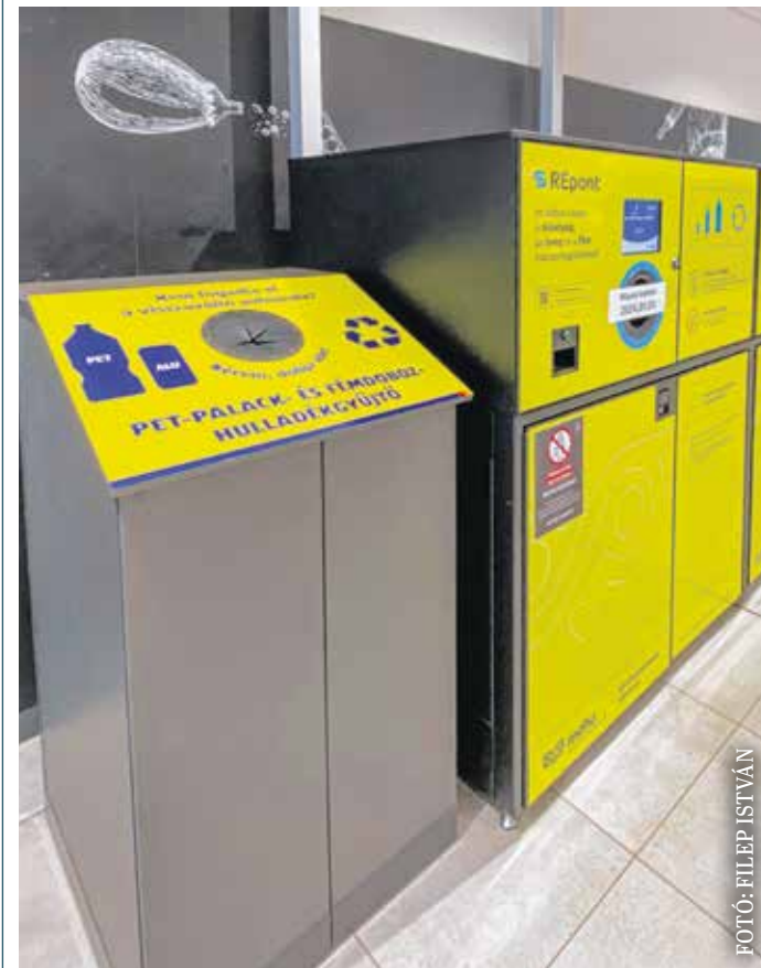
Sopronban is telepítették már az új automatákat.

Azt a csomagolást lehet majd visszaváltani, amin szerepel a visszaváltási logó, és amiért kifizette a vásárló a visszaváltási díjat. A most használt, nem visszaváltható csomagolásokat továbbra is a szelektív kukákba kell dobni. (Forrás: mti)