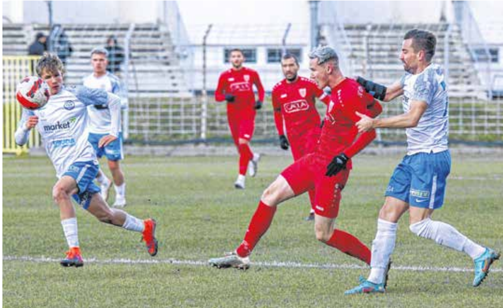
A soproni csapat január 19-én kezd a téli felkészülést.