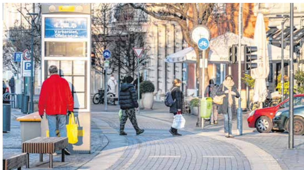
Január 1-jén elindult a csok plusz, amely az 5000 fő feletti településeken igényelhető.