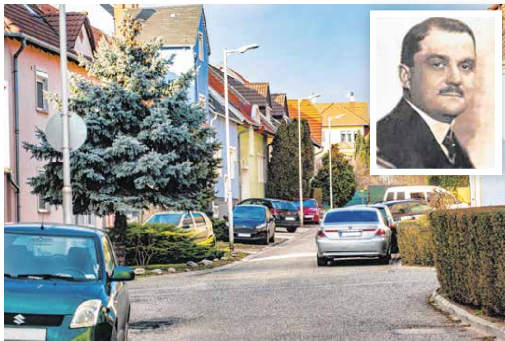
A Thurner Mihály utca 313 méter hosszú, kisebb sorházak alkotják.

Soproni-Thurner Mihály 1878. december 12-én született Márcfalván (Marz), egy német ajkú család tizedik gyermekeként. Alsó iskoláit Sopronban és Győrben végezte, 12 éves korában tanult meg magyarul. Kecskeméten és Budapesten jogot tanult, majd államtudományi doktorátust szerzett Kolozsváron. Sopronba 1908-ban tért vissza, 1910-ben feleségül vette Prickler Matildot, házasságukból három fiúgyermek született. 1912-ben kinevezték a számvevőség élére. Az első világháború alatt katonászkodott, de szaktudása miatt hamar visszahívták. Közfelkiáltással választották Sopron polgármesterévé 1918. augusztus 1-jén.