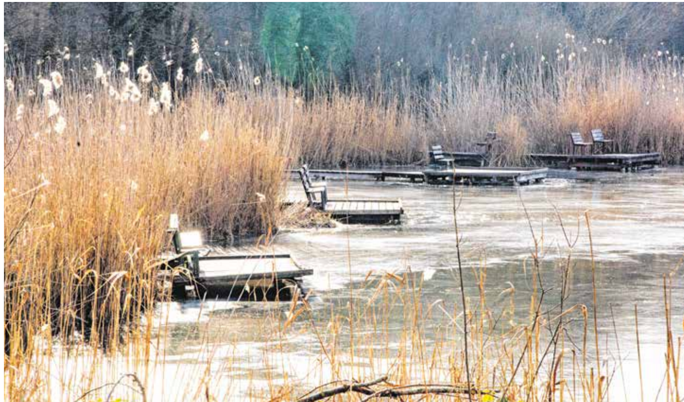
Csillog a napfény a Tómalom vizén – az elmúlt héten kettős arcát mutatta az időjárás, a hajnali mínuszok mellett előfordult 10 fok körüli maximum is.

2021 a 10,8 Celsius-fokos értékével az elmúlt tíz év