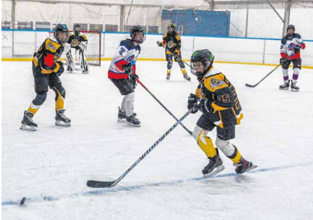
A Soproni Jég-törők U16-os csapata egyre komolyabb játékerőt képvisel.

Három résztvevő csapat van, így egy-egy játéknapon minden együttes két-két mérkőzést játszik, a találkozók 3-szor 15 percig tartanak, futóórás lebonolyítás mellett – tudatta Koós Zoltán, a Soproni Jégkorong Egyesület elnöke. – Csapatunk általában két vagy három sorral lép pályára, tíz-tizenkét játékos áll rendelkezésre meccsenként. Az U16-osoknál azért már komoly iram van, lényegében perccenként cseréljük a