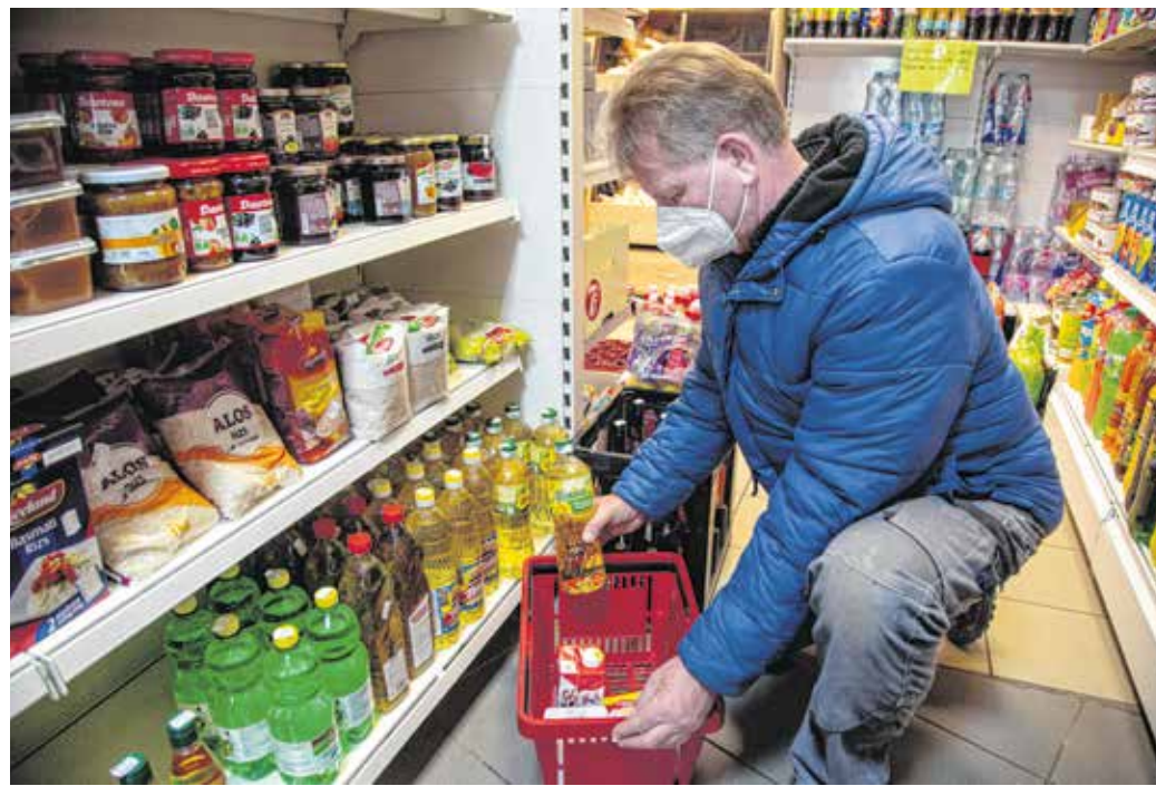
Tej, olaj, liszt is került Kovács László kosarába – ezeknek az árát is a tavaly októberi szintre csökkenti a kormány. A rendelkezés február elsejétől lép életbe.

Egyelőre három hónapra szól a termékek árának befagyasztása. A rendelkezést be nem tartók pénzbírságra számíthatnak, ennek mértéke Gulyás szerint „visszatartható hatású” lesz. Azt is mondta, azért nem a termékek áfáját csökkentették, mert az amúgy is csak ötszázalékos,