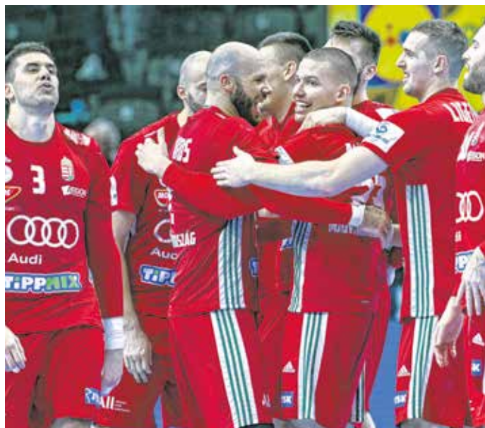
A magyar játékosok ünneplik Portugália feletti győzelmüket a kézilabda Európa-bajnokságon.

A magyar válogatott az előző Európa-bajnokságon kilencedik, a tavalyi világbajnokságon ötödik, az Eurokupában aranyérmes lett, ezúttal pedig a legjobb nyolc közé kerülés a célja.