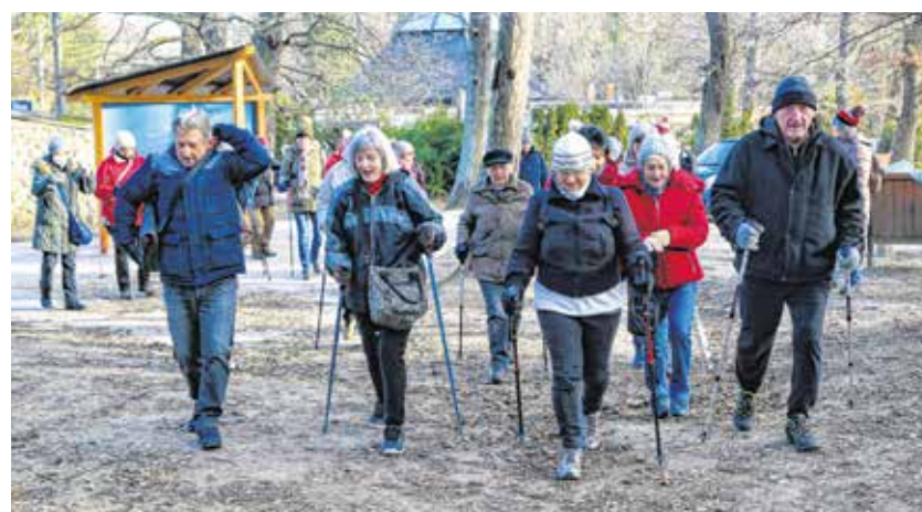
Az Idősek Európai Háza Alapítvány 4 éve szervezte meg először a Soproni Gyalogló Idősklubot, azóta heti kétszer járnak sétálni a tagok.

megszervezték a Soproni Gyalogló Idősklubot, amely azóta is heti 2 alkalommal várja a sétálókát. 2019-ben megalakult a Soproni Senior Táncsoport is, amelynek több mint 50 tagja van. 2019-ben Erdély 5 városában, 2020-ban a Vajdaságban is népszerűsítették az Alzheimer Cafét és a Gyalogló Idősklub Mozgalmat egy pályázatnak köszönhetően. Idén ismét szeretnék megismertetni a 65 év feletti lakosság demenciaszűrését a városban és a Balfi úti Idősek Otthonában is az önkormányzat és a Soproni Szociális Intézmény támogatásával.