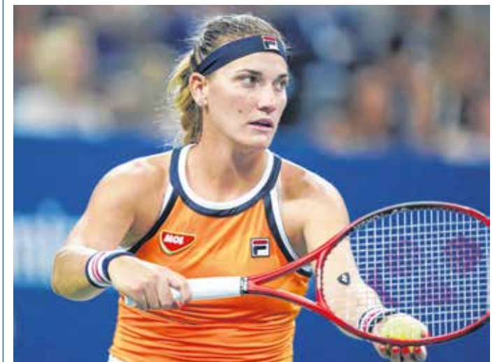
Babos Tímea

Babos Tímea három játszmában nyert az elmúlt szerdán a szlovák Anna Karolina