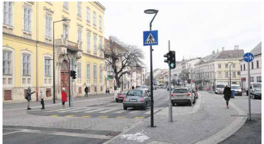
Elkészült a Várkerület Ötvös utca és Széchenyi tér közötti szakasza – birtokba vették az autósok, a biciklisek, a gyalogosok az utat.

Az országban elsőként Sopronban épül Integrált Rendészeti Központ (IRK) – jelentette be Barcza Attila, Sopron és térsége országgyűlési képviselője és dr. Farkas Ciprián polgármester december 22-én. A Tánicsics utcai egykori határőrlektanya területének nagyjából egyharmadán épül meg az országban először egy olyan központ, amely otthont ad a rendőrségnek, a katasztrófavédelemnek és az alkotmányügyi hivatalnak. Barcza Attila elmondta, a szükséges kormányhatározatok