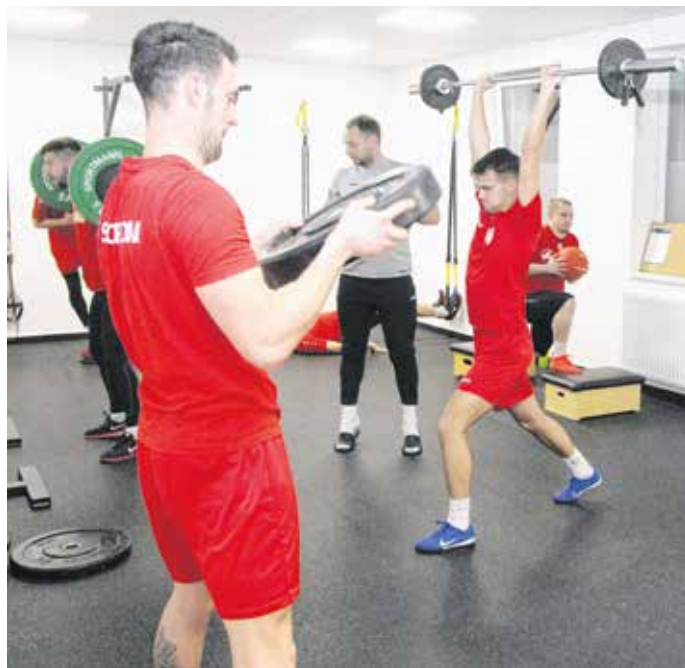
Az SC Sopron felkészülésének fontos része a fizikai erősítés.