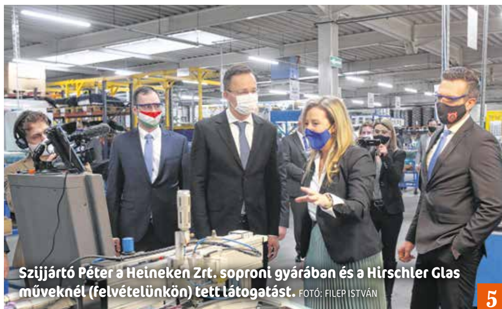
Szijjártó Péter a Heineken Zrt. soproni gyárában és a Hirschler Glas műveknél (felvételünkön) tett látogatást.