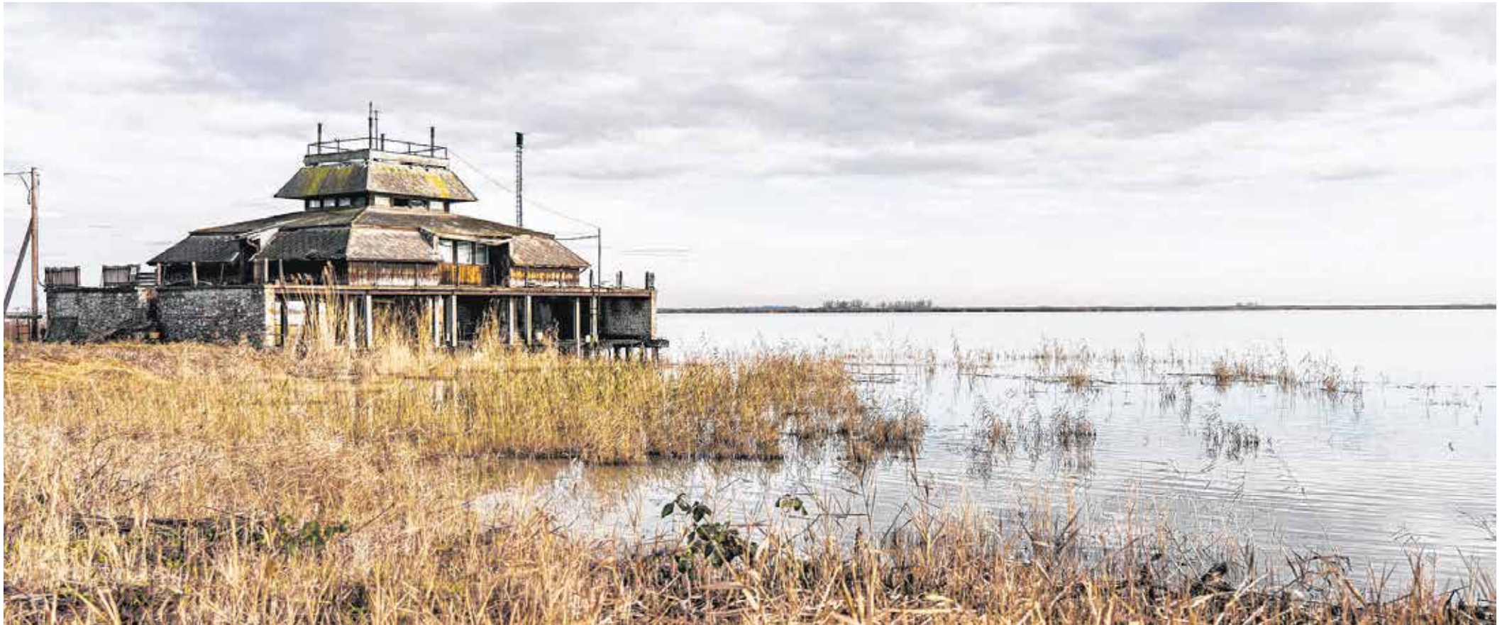
Egy nagyon erősen leromlott állapotú területen kell olyan színvonalú idegenforgalmi központot kialakítani, hogy az versenyképes legyen a környező osztrák üdülőövezetekkel.