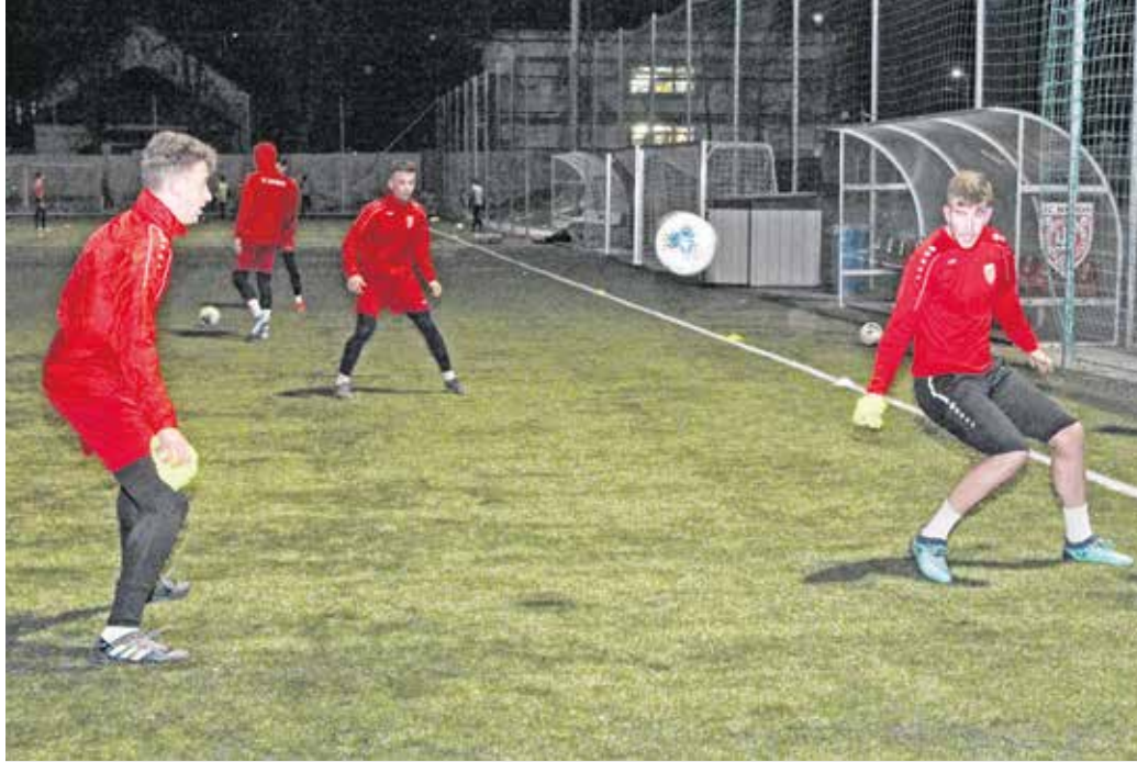
Már elkezdődtek a labdás edzések is – az első bajnoki meccs előtt öt felkészülési találkozót játszanak a soproni fiatalok.

Az SC Sopron játékosai megkezdtek a nyolchetes intenzív felkészülést, amelyben először a fizikai erősítés van a hangsúly. A tervek szerint január 30-án játssza az első edzőmérkőzését a soproni csapat. A február 28-i Lipót elleni tavaszi bajnoki rajtig összesen öt felkészülési meccset játszanak a piros-fehérek,