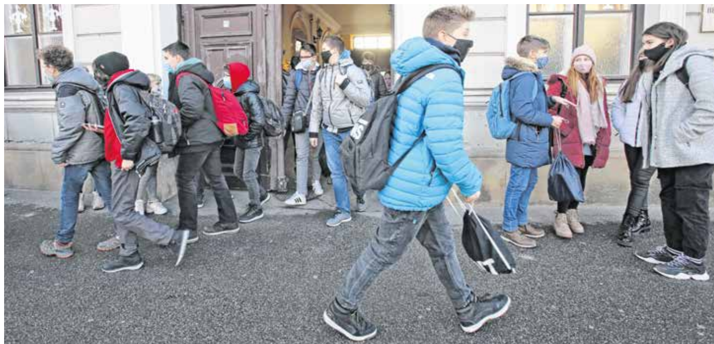
A kisközműzisták a Berzsenyi-líceumban személyesen tanulnak, míg 9. évfolyamtól digitálisan oktatják a diákokat

A központi írásbeli felvételen országosan mintegy 75 ezer tanuló vesz részt az eddiginél jóval több, 535 helyszínen. A vizsga első időpontja január 23. – Az intézmények felkészültek, a beosztások megvannak, és a már megszokott védelmi intézkedésekkel rendezik meg a felvételiket – hangsúlyozta Maruzsa Zoltán köznevelésért felelős államtitkár. – A hagyományos pótló időpont (január 28.) mellett egy második pótnapot (február 5.) is beillesztettek, hogy azok is megírhatják a felvételt, akik az első napon betegek vagy karanténkötelezettek.