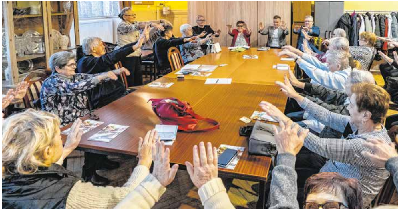
A soproni cukorbetegek hagyományosan közös tornával kezdik összejöveteleiket – nem volt ez másként múlt szombaton sem.