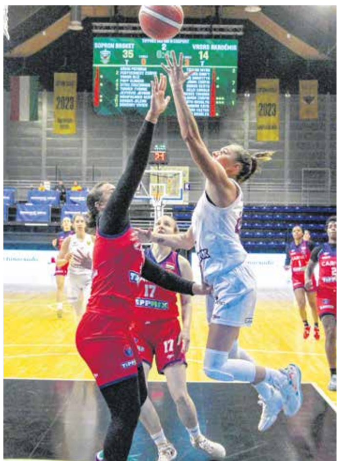
Szombaton az ELTE BEAC együttese ellen folytatja a bajnokságot a Sopron Basket.

A fiatalabb, jobb erőben lévő soproni csapat megérdemelten nyert