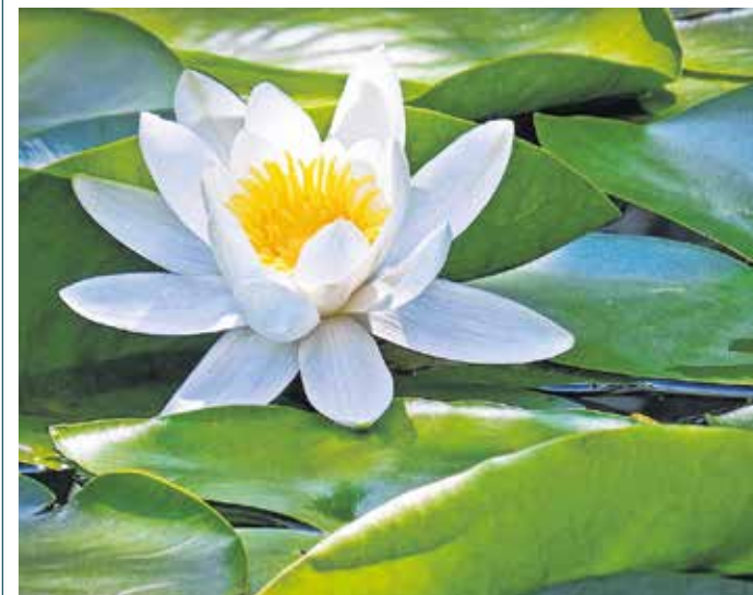
A fehér tündérrózsaival leggyakrabban a Tisza és a Dráva völgyében, valamint a Kisalföldön lehet találkozni.

A tündérrózsaakat a világ minden részén a megtisztulás és újjászületés szimbólumának tartják.