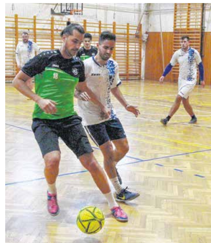
Összesen tíz csapat nevezett az idei soproni kispályás teremlabdarúgó-tornára.

A sportvezető hozzátette: a felső ágon két hármas csoportot alakítanak ki, a