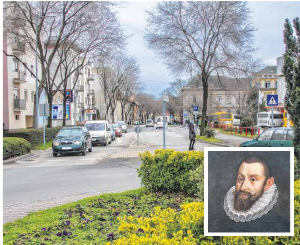
Lackner Kristófot négyszer választották Sopron polgármesterének.

Lackner Kristóf itthon igyekezett meghonosítani mindazt, amit külföldön látott. Az európai műveltség magvait akarta elültetni, és