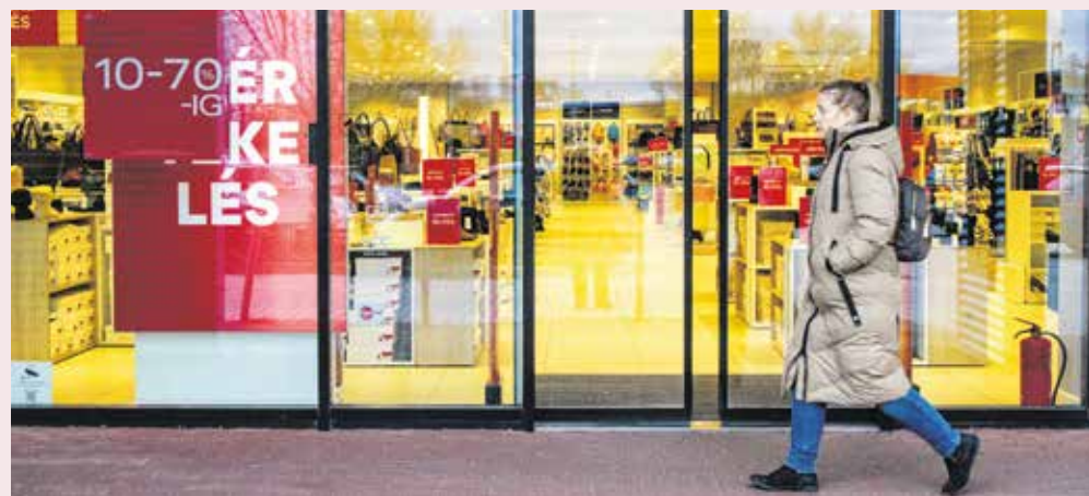
A tavaszi-nyári kollekcióknak kell a hely, így a megmaradt téli darabokhoz is rendkívül kedvezményesen juthatunk most hozzá.

Ha körülnézünk a belvárosban vagy a nagyobb bevásárlóközpontokban, majdnem minden üzlet bejáratánál óriási „akció” és „kiárusítás” feliratok csábítanak vásárlásra. Az előrelátóbbak már most beszerezhetik a jövő évi karácsonyi dekorációt, amelyet szinte bárhol fil-léréért megkaphatunk. Bár az időjárás még elég zord, szép lassan közeledik a tavasz, így a lengőbb ruhák is hamarosan kikerülnek a polcokra. Ilyenkor már nem szívesen veszünk téli holmikát, hiszen sokáig nem viselhetjük azokat. A tavaszi-nyári kollekcióknak kell a hely, így a megmaradt téli darabok-