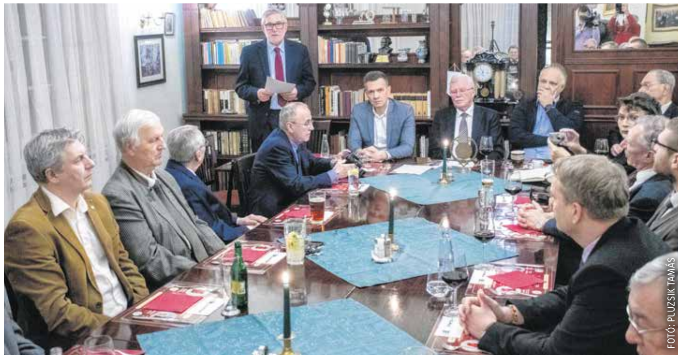
A Kitaibel Pál Természettudományi Asztaltársaságnak jelenleg 29 tagja van. Múlt kedden tartották a 700. összejövetelt.