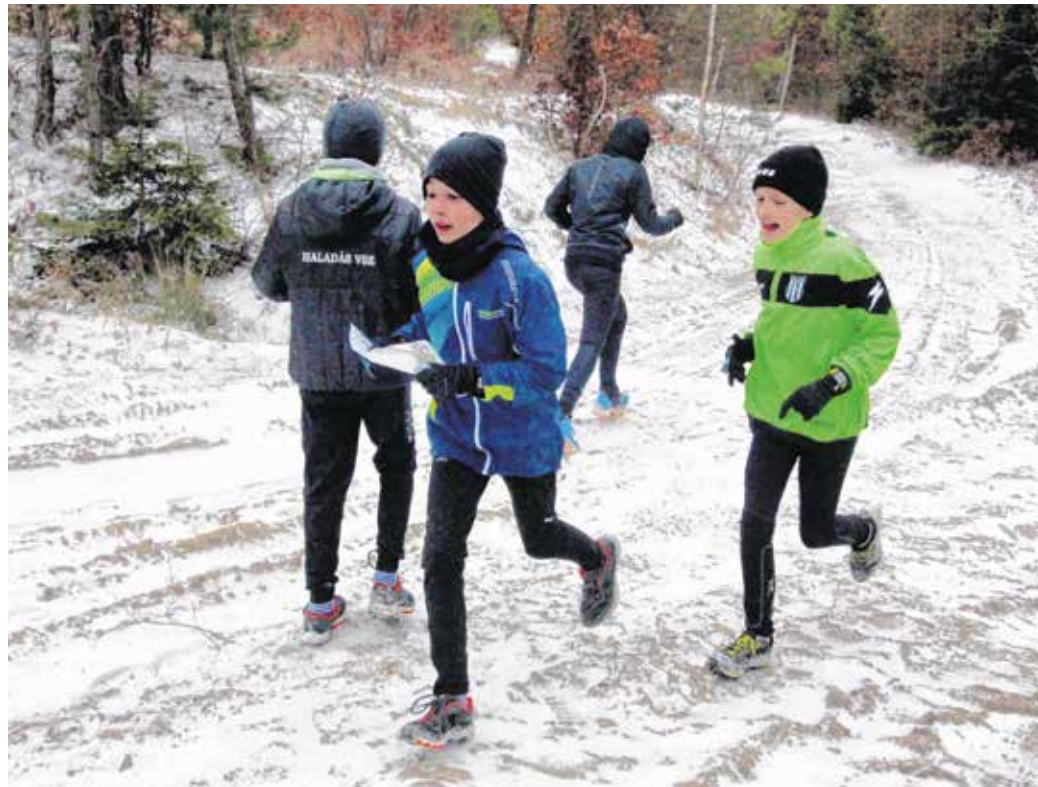
A tájékozdási futás télen is népszerű.

A külön rendezés mellett komoly érvként szerepelt, hogy a korábbi, kétnapos évzáró MiZi kupákon a távolabbról, például Győrből vagy az ausztriai Bécsújhegyről érkező futók leggyakrabban csak az első napon vettek részt. Így viszont mindkét hónapban van egy egynapos