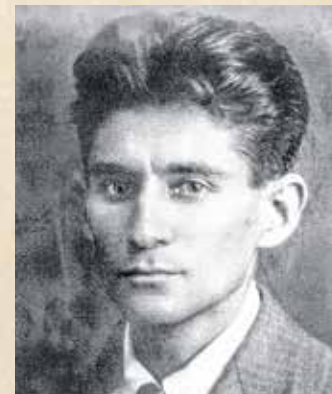
Franz Kafka (1883-1924)