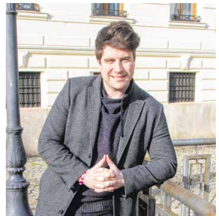
Hordós Alexet a nemzetközi ügyek foglalkoztatják.

Alexet főként a jogi pályához kapcsolódó klasszikus szakmák vonzzák. A nemzetközi elemeket tartalma-