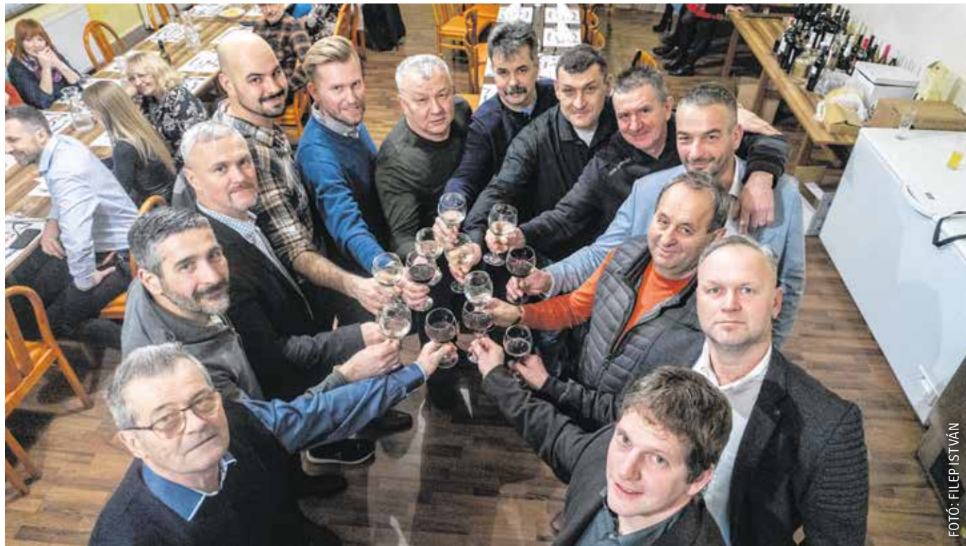
A Balfi Borklub január 22-én családi vacsoraesttel ünnepelte a 20. évfordulót. A találkozóra meghívták a régi tagokat is.