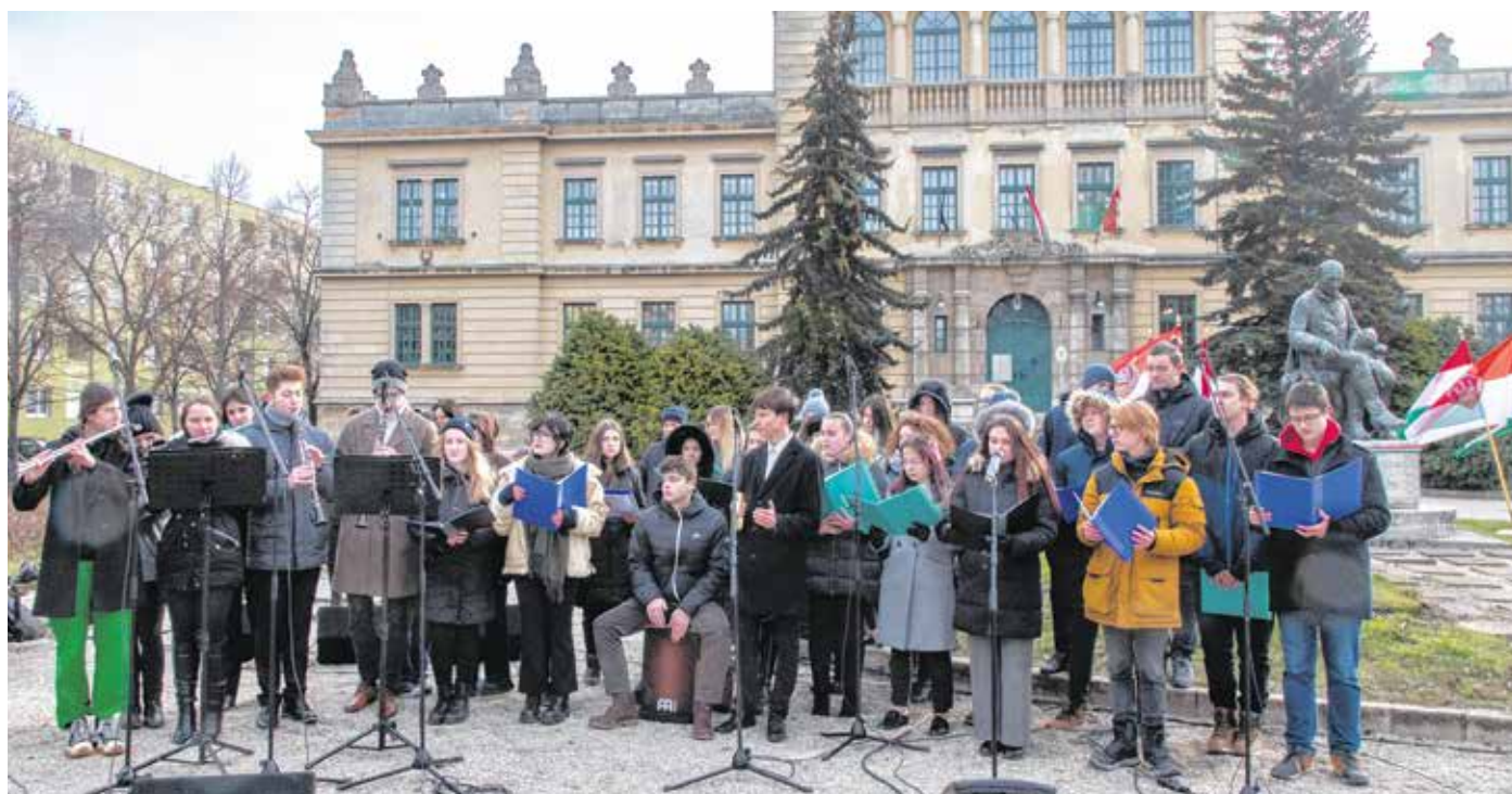
A múlt pénteki rendezvényen a Soproni Széchenyi István Gimnázium tanulói adtak zenés, irodalmi műsort.