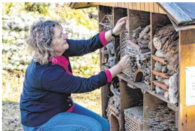
A Lenck-villa kertjében helyet kapott egy rovarhotel is.