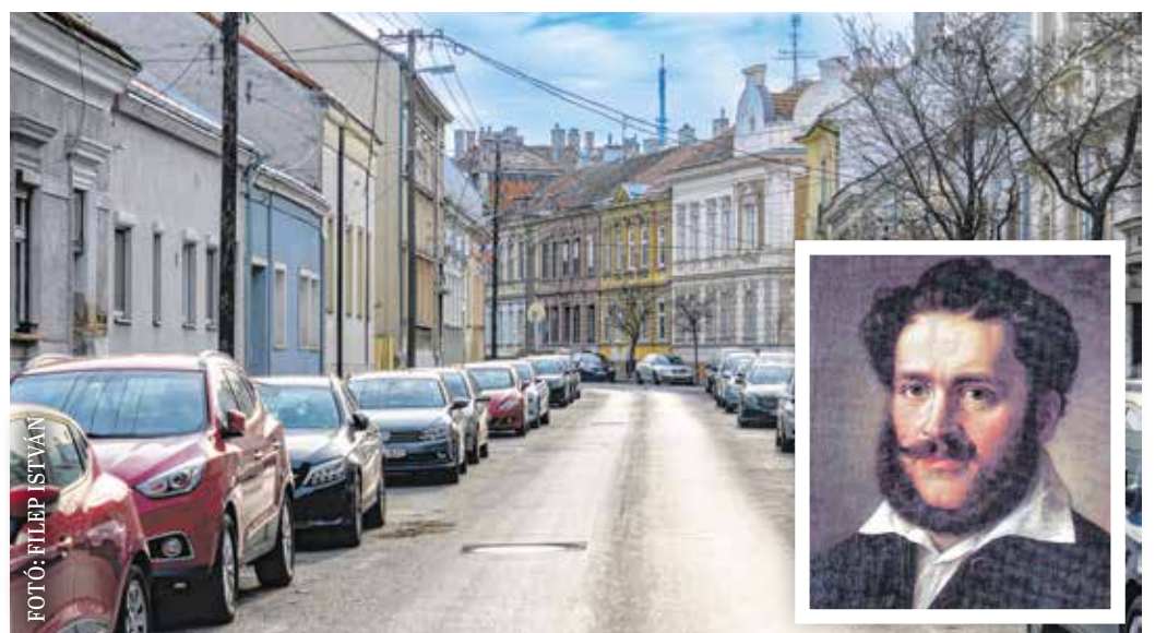
A Wesselényi utca egyirányú – a Kossuth Lajos utcát köti össze a Tánácsics utcával.

A Tánácsics utca és a Wesselényi utca sarkán álló lakóház 1911-ben készült Neuberger Ernő építőmester tervei