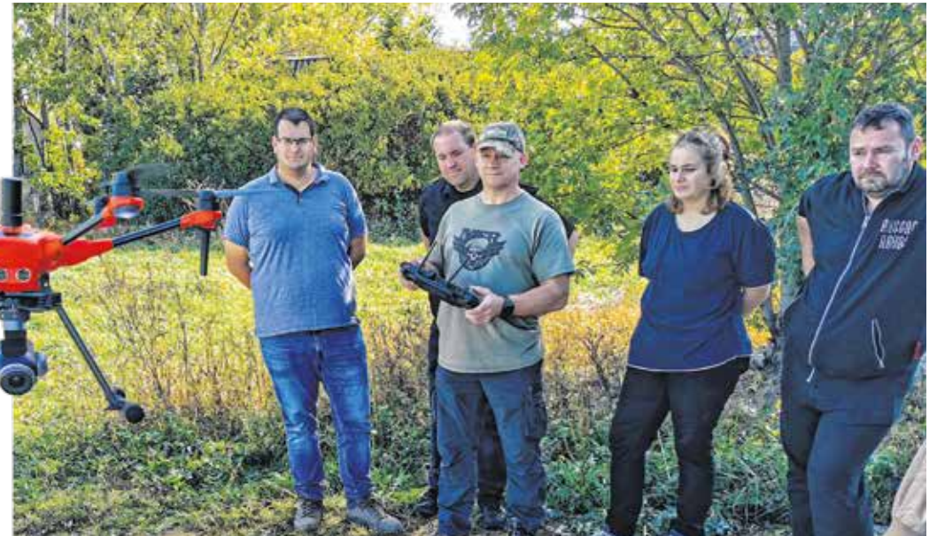
A tartalékosok egy napon keresztül tanulták a gyakorlatban a drónok használatát.