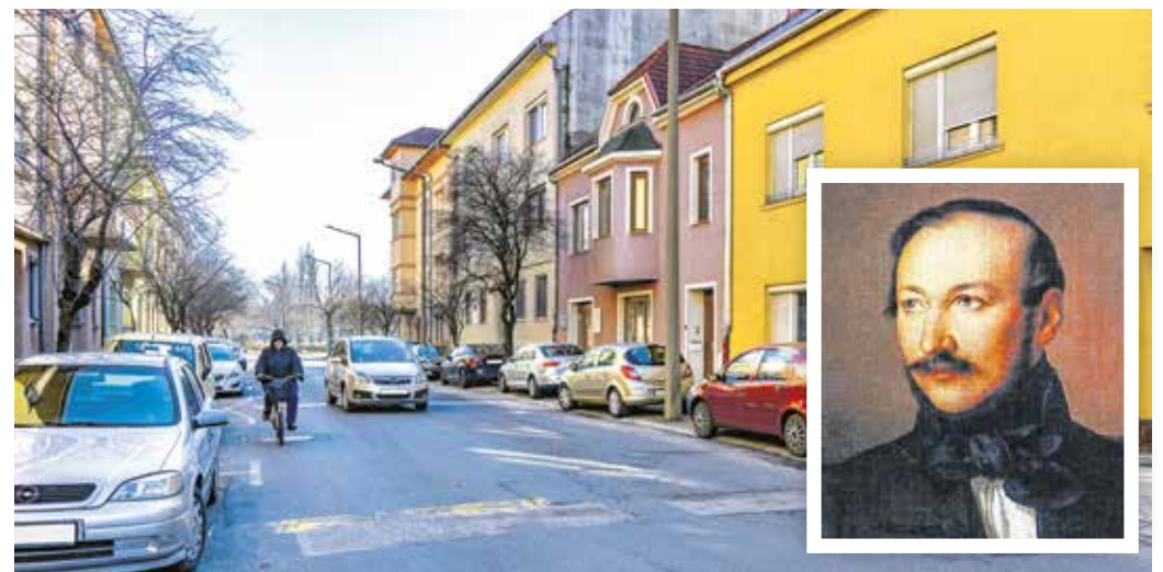
A Vörösmarty utcában több, a városban ismert ember lakott.