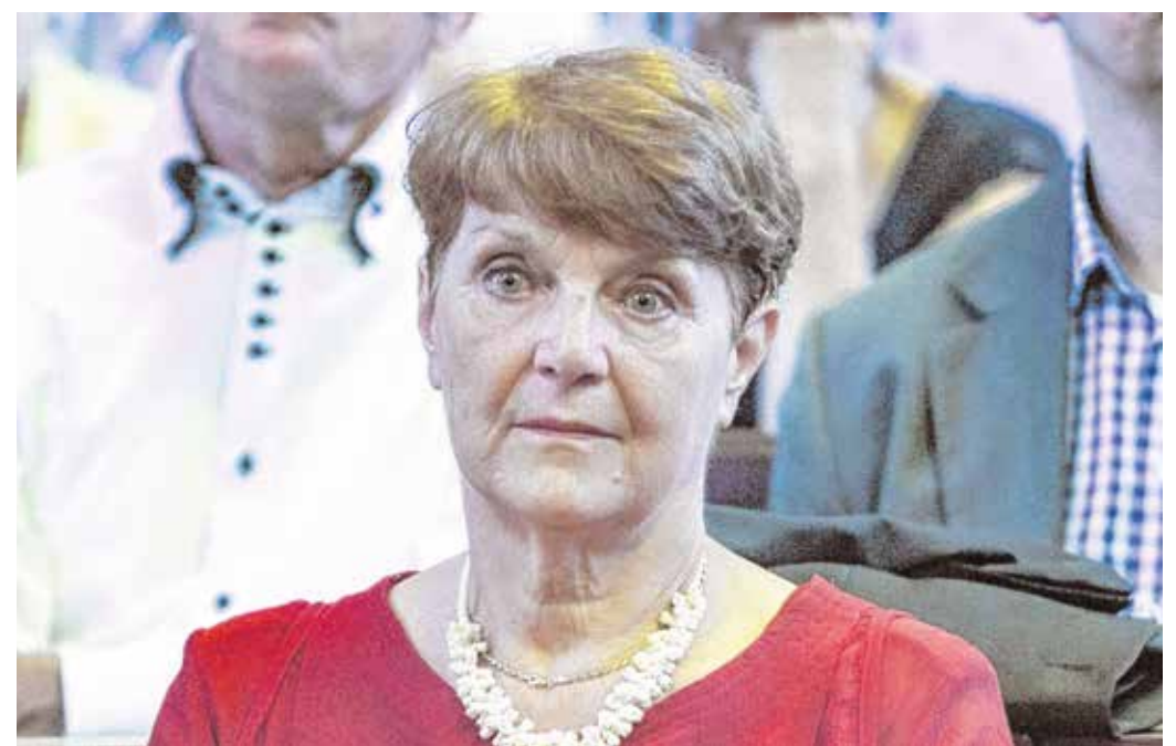
Ránkyné Németh Angéla a mexikói olimpián gerelyhajításban lett aranyérmes – ő is tartott előadást az olimpiatörténeti akadémián Sopronban.

– A húszas évek második felében mint soproni kisdíák tanúja voltam a város