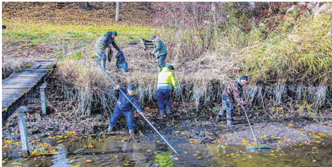
A Sopron és Vidéke Horgász Egyesület kiemelten kezeli a vizek környezetének rendben tartását – rendszeresen szerveznek szemétyűjtést, kaszálást, fűnyírást a tavak mellé.

Az egyesület a törvényi előírások mellett olyan irratlan szabályok betartását is kiemelten kezeli, mint a vizek környezetének rendben tartása, a szemét összeszedése, a fűnyírás, a kaszálás. A civil szervezet számára nagyon fontos a szakhatóságokkal és a társszervezetekkel való hatékony együttműködés, gyümölcsöző a kapcsolatuk a környékbeli horgász egyesületekkel, a vármegyei