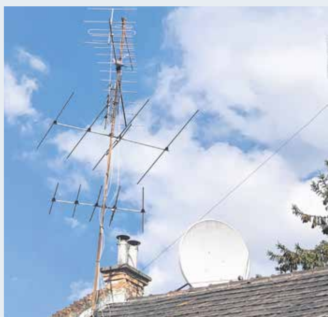
Múlt és jelen a soproni háztetőkön – hagyományos, valamint parabolaantenna egymás mellett.

Az első magyar fejlesztésű tévékészülék az Orion AT 501 volt, ez akkoriban 5.500 forintba került, amit csak nagyon kevesen engedhettek meg maguknak. De térjünk vissza az antennákhoz, melyek elkészítése, valamint azoknak a tetőn való elhelyezése külön szakértelmet igényelt, így ki is alakult erre egy hivatalos, valamint egy „maszek” szakembergárda. Tekintettel arra, hogy más típusú és más tájolású antennával lehetett csak fogni a bécsi adást, így ránézésre is megállapítható volt, hogy ki az, aki a hivatalos hírcsatorna, az évtizedekig Matúz Józsefné nevével fémjelzett tévéhíradó helyett vagy amellel az osztrák Zeit im Bildet (is) nézi. Olyan hírek is terjedtek, hogy civil nyomozók járták a várost, és feljegyezték, melyik házon látták „bécsi antennát”. Persze volt, amikor Budapestről és az ország más részeiből is szörszámmal érkeztek „tévénézők” Sopronba, ugyanis a háromszoros olimpiai bajnok bokszelegenda, Papp László a „hazai” profi