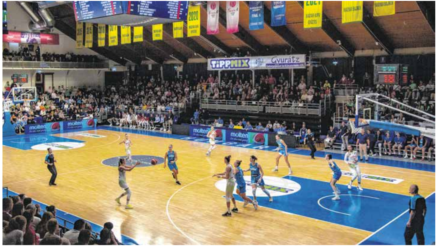
Két győzelemmel hangolt novemberben az olimpiai selejtezőtornára a női kosárlabda-válogatott.