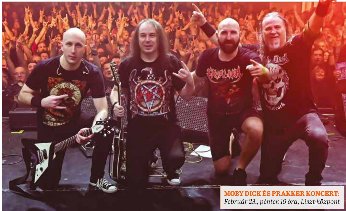
MOBY DICK ÉS PRAKKER KONCERT: Február 23., péntek 19 óra, Liszt-központ

S. T.: – Az új album zenei anyaga több mint fél éve kész, a szövegekkel viszont lassan haladunk, de szerencsére