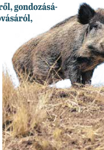
A Roth-technikum diákjai és oktatói rendszeresen részt vesznek a TAEG Zrt. hajtásain, tanulmányi vadászatokon.

Az iskola tanulói és oktatói egy másik fontos feladatban is segítséget nyújtanak: a TAEG Tanulmányi Erdőgazdaság Zrt.-vel közösen rendszeresen vesznek részt hajtásokon,