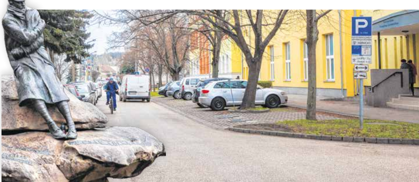
A Móricz Zsigmond utcai átjárótól a Deák térig tart a Gyóni Géza utca. A költő szobrát a Deák téren találjuk.