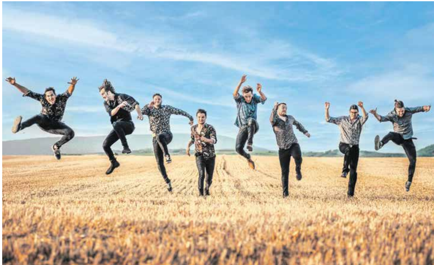
Az Aurevoir. tagjai már nagyon várják a soproni bulit, a város közel áll a szívükhöz.