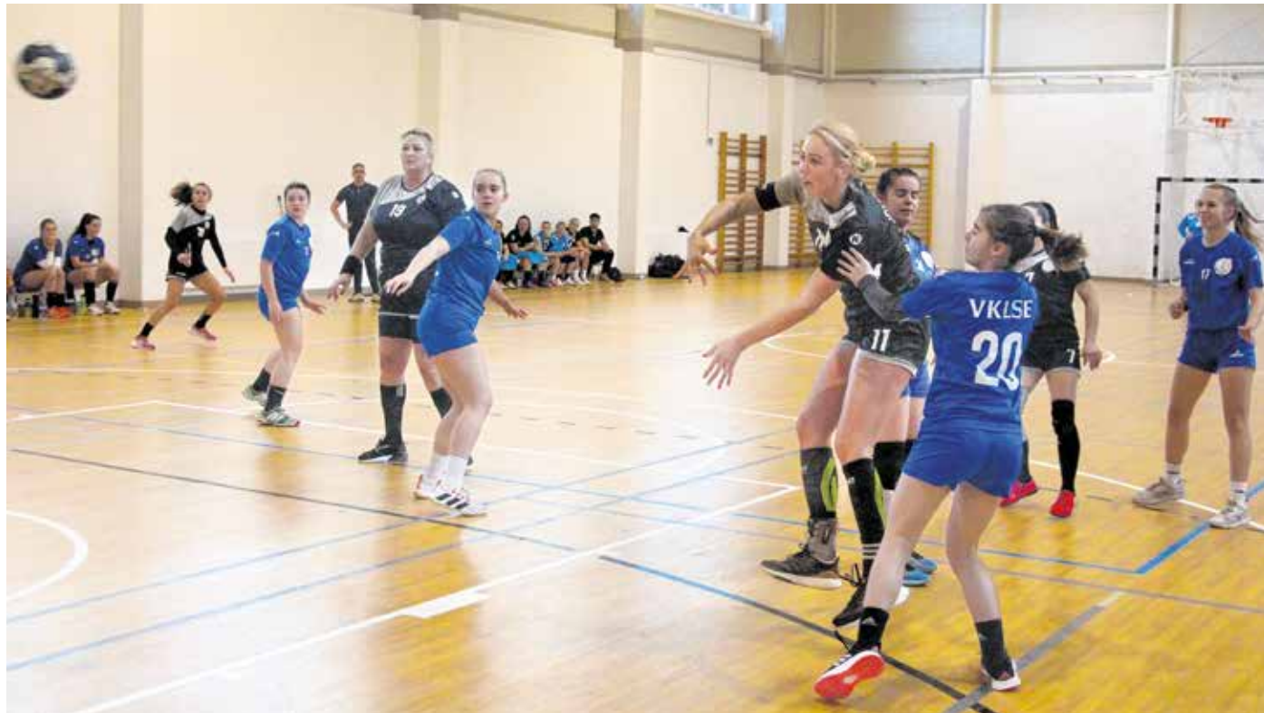
A hétfői torna célja az volt, hogy segítse a soproni kézilabdázók felkészülését a tavaszi szezonra.