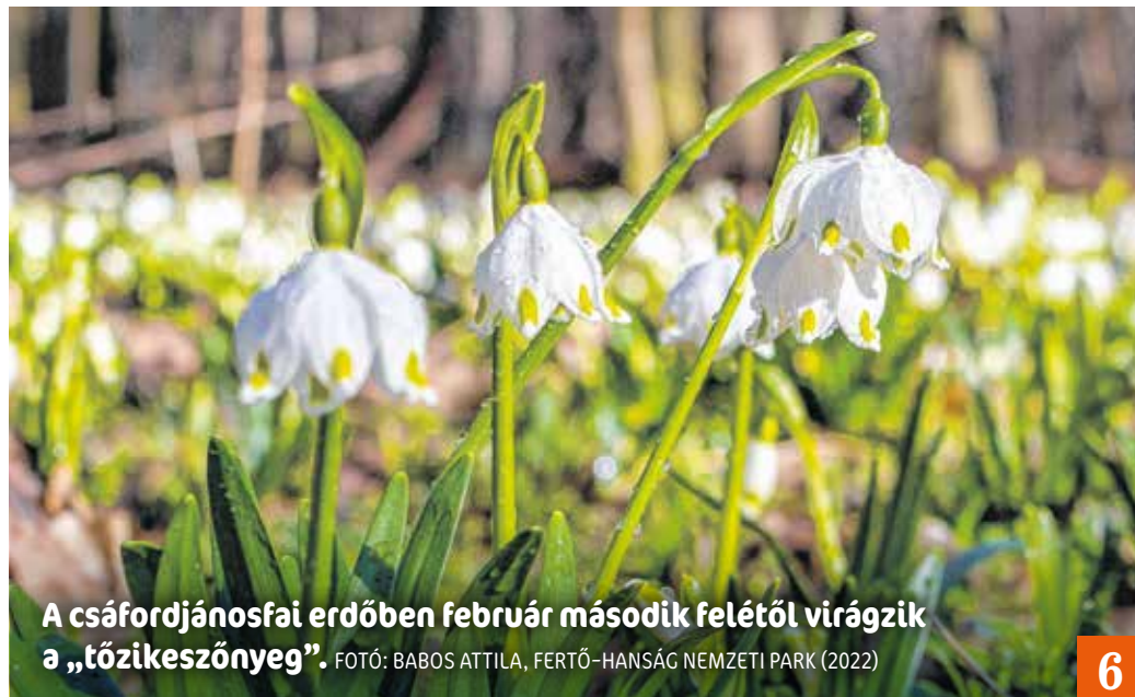
A csáfordjánosfai erdőben február második felétől virágzik a „tőzikeszőnyeg”.