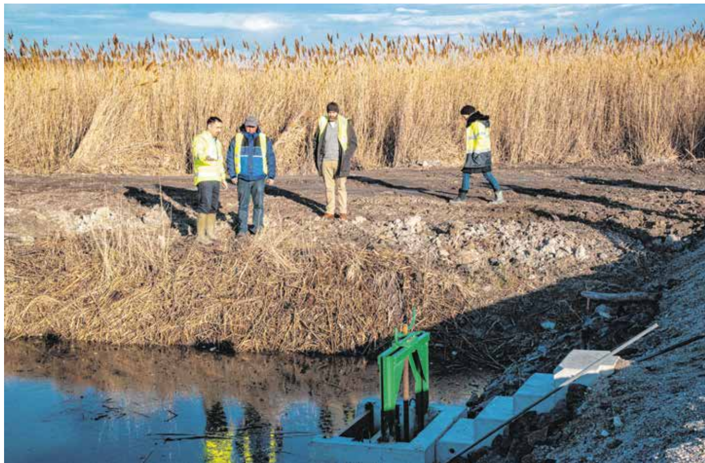
A megújult Barát-zsilip biztosítja a csatorna vízutánpótlását a Fertő tóból – a horgászok öröme.