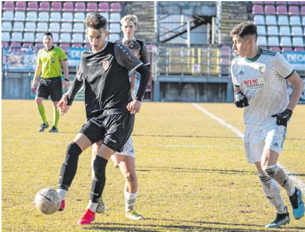
A hétfői edzőmeccsen gólt ugyan szerzett, de győzni nem tudott a soproni csapat: SC Sopron - ETO Akadémia 1-2.

Javában tart még a téli igazolási időszak az SC Sopronnál is, amely alatt távozó és érkezők is egyaránt vannak az együttesnél, így a végleges keret csupán a bajnoki rajtra alakul ki. A szakmai stáb egyértelmű célként tűzte ki, hogy a csapat magját együtt tartva további erősítések is érkezzenek, akikkel a bennmaradás mellett eredményes tavaszi szezont lehet majd felmutatni.