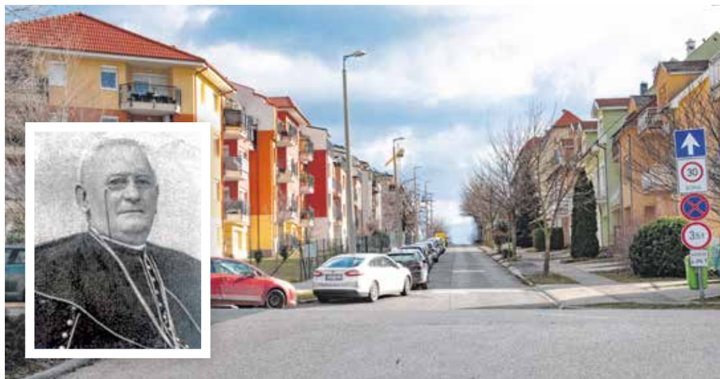
Az aranyhegyi utcát 2001-ben nevezték el a legendás városplébánosról, Póda Endréről.

Póda Endre szorgalmazta a városi vízvezetékrendszer fejlesztését, a filoxerajárvány után szőlészeti szakiskolát alapított. 1901-ben pápai preláttá neveztek ki. Huszonhat év plébánosi szolgálat után váratlanul, 1902. február 2-án hunyt el. Az általa megnyitott temetőben az ifjabb Storno Ferenc által készített Kálvária-kereszt alatt helyezték végső nyugalomra.