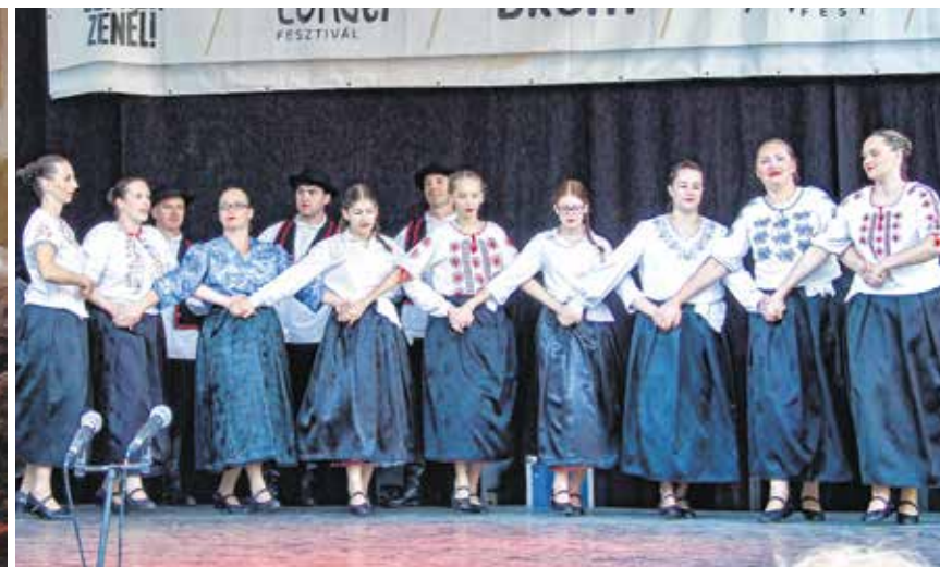
A Soproni Horvát Napok rendezvénysorozata nagy sikert arat minden évben a soproniak körében is.

családhoz kapcsolódó évfordulókról emlékeztek meg a tanácskozásokon. Az egyesület fontosnak tartja a tapasztalatok cseréjét is, az ország több horvát egyesületével kölcsönösen együttműködik. Legutóbb Szentpéterfára hívták őket egy remek hangulatú szüreti felvonulásra. Ausztriában, a határ mentén is gyümölcsöző kapcsolatokat ápolnak, így rendszeresen részt vesznek a mariazelli horvát búcsún is. Az anyaországgal is aktív kapcsolatokat tartanak, ha tehetik, el is látogatnak Horvátországba.