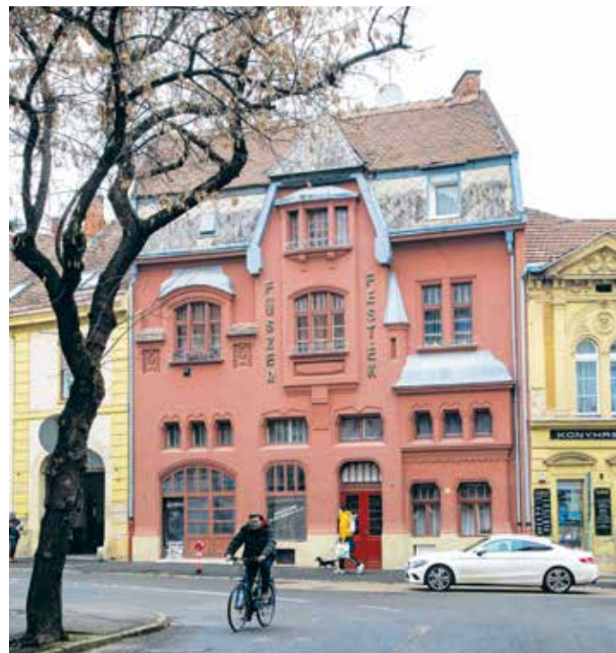
A mai Újteleki utca 52. számú házban működött a két világháború között a Pum-bolt, fűszer- és csemegekereskedés.