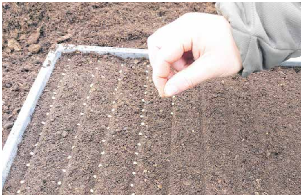
Fontos, hogy a magoknak ideális földkeveréket válasszunk, így gyorsabban fejlődnek!

– A paprikát, a paradicsomot és a zellert szintén