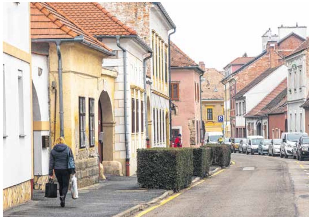
A XIII. századtól kezdve a fokozódó német betelepülések hatására új telkeket jelöltek ki itt. Innen eredeztethető a városrész, valamint az Újteleki utca elnevezése.