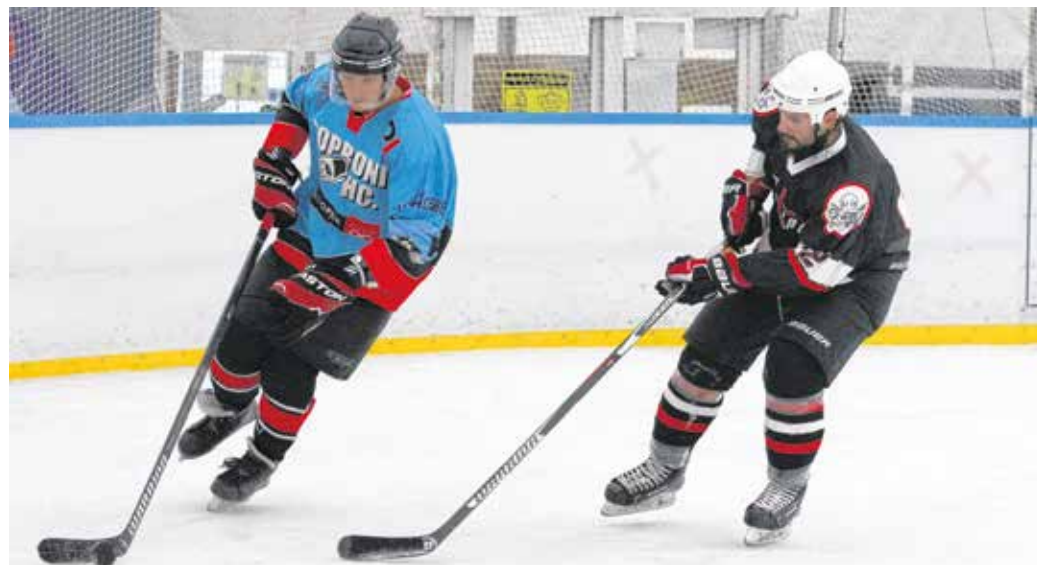
A Soproni Jégtörők ismét két magabiztos győzelmet szereztek.