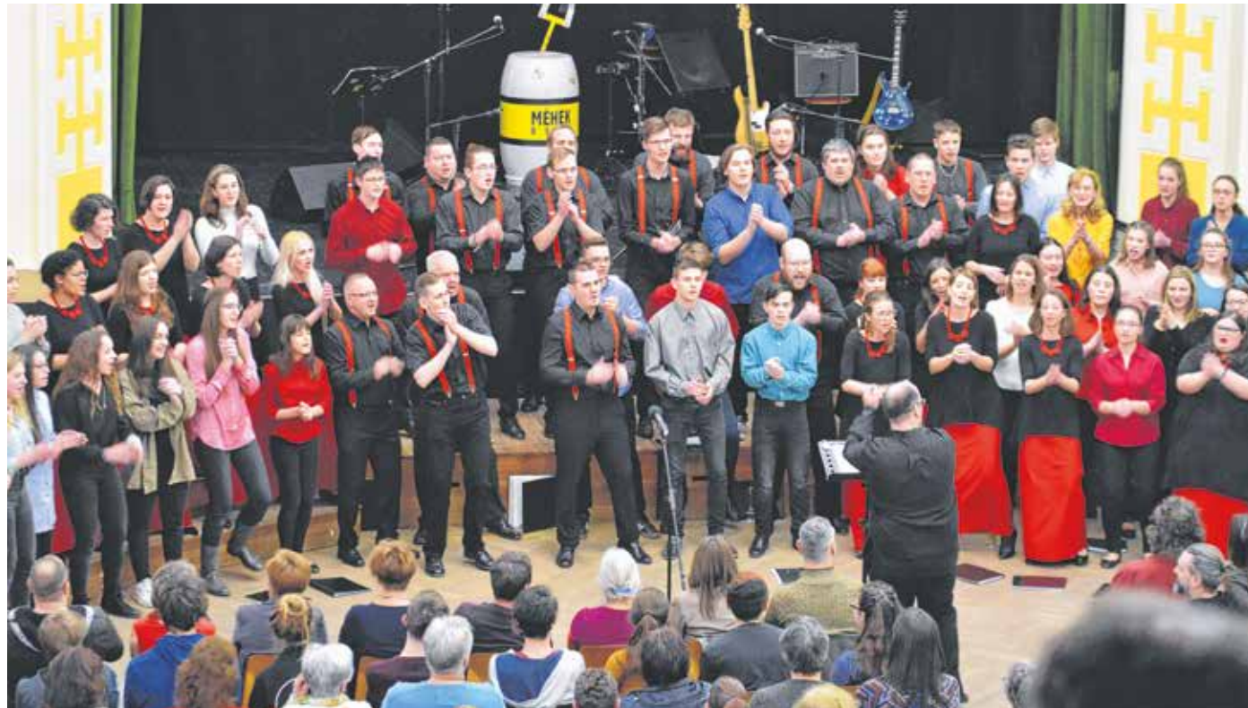
A Kórus Spontánusz a Turbó Méhekkal adott tavaly februárban nagy sikerű koncertet – minden kórus várja az újabb fellépéseket.