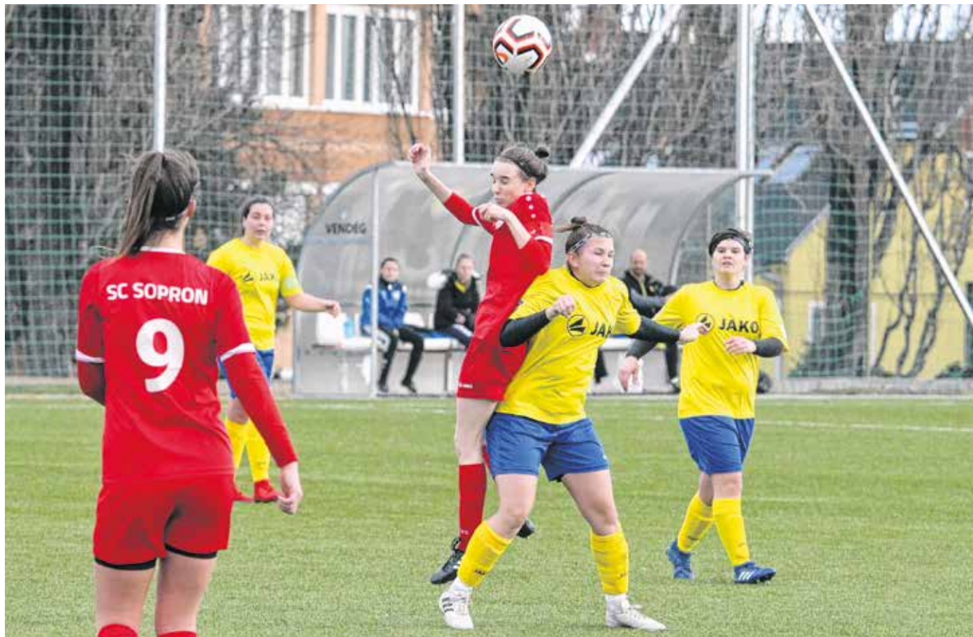
Az SC Sopron NB II-es női csapata már lejátszotta az elmaradt mérkőzéseit. Tavasszal a tisztes helytállás a cél.