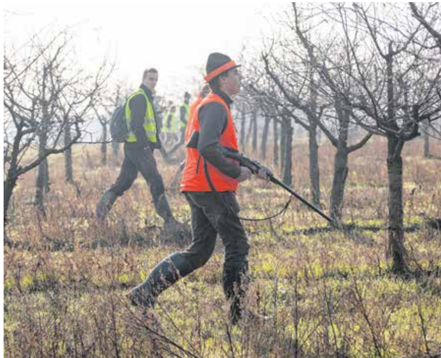
Az erdész-képzés továbbra is népszerű Sopronban – a diákok nemcsak az iskolapadban, hanem terepen is elsajátítják a szakmai ismereteket.