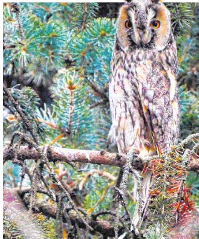
Az erdei fülesbagoly (Asio otus) 2020-ban az év madara volt – hazánkban védett.

Az erdei fülesbaglyok különleges viselkedése, hogy