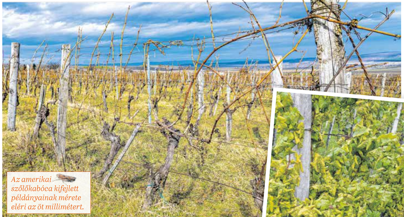
Az amerikai szőlőkabóca kifejlett példányainak mérete eléri az öt millimétert.