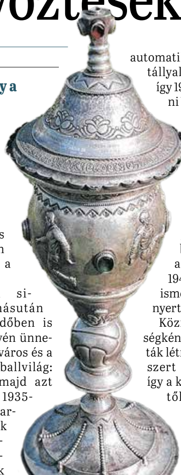
A megyei bajnoknak járó csodálatos serleg.

Eddig tizennégy alkalommal került fel soproni klub neve a trófeára.