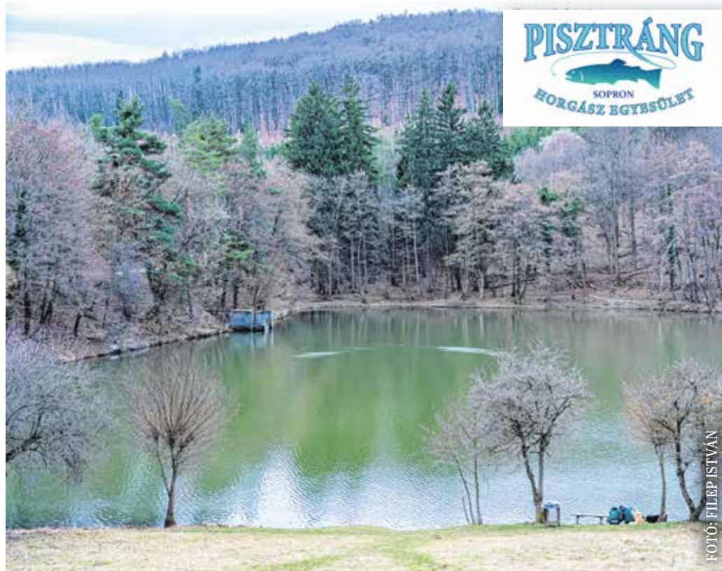
A Fehér úti tavat a Rák-patak felduzzasztásával alakították ki. A tó partján a Pisztráng Horgász Egyesület tagjai minden évszakban örömmel úzik természetközeli hobbijukat.

Az egyesület elnöke beszélgetésünk során kiemelte: a tagok összetartó közösséget alkotnak, évente több alkalommal szerveznek közös programot a tó partján. Mint rámutatott, országos szinten a kicsi egyesületek közé tartoznak, ennek ellenére ugyanazoknak az adminisztrációs feladatoknak kell eleget