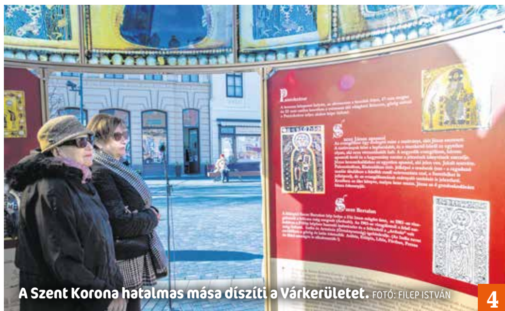
A Szent Korona hatalmas mása díszíti a Várkerületet.