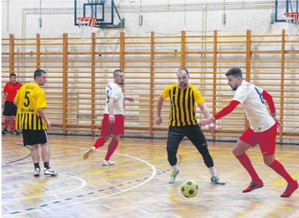
A döntőt a felső ágon az Erzsébet Kórház és a Gigant FC játszotta.

A pálya mérete miatt négy plusz egyes csapatok játszottak, aminek megvan