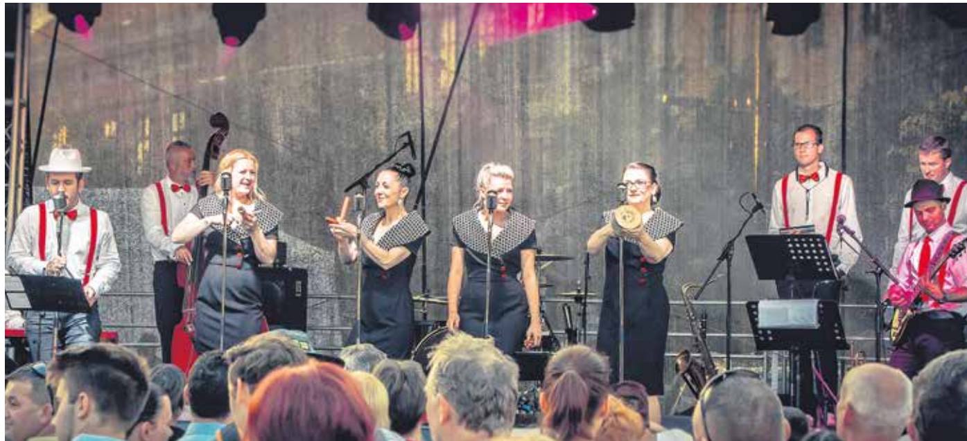
A népszavazás 100. évfordulójára olyan dalokat dolgoztak át a Local Vintage Company tagjai, amelyek kifejezetten az 1920-as évek Magyarországnak jellegzetes slágerei voltak.