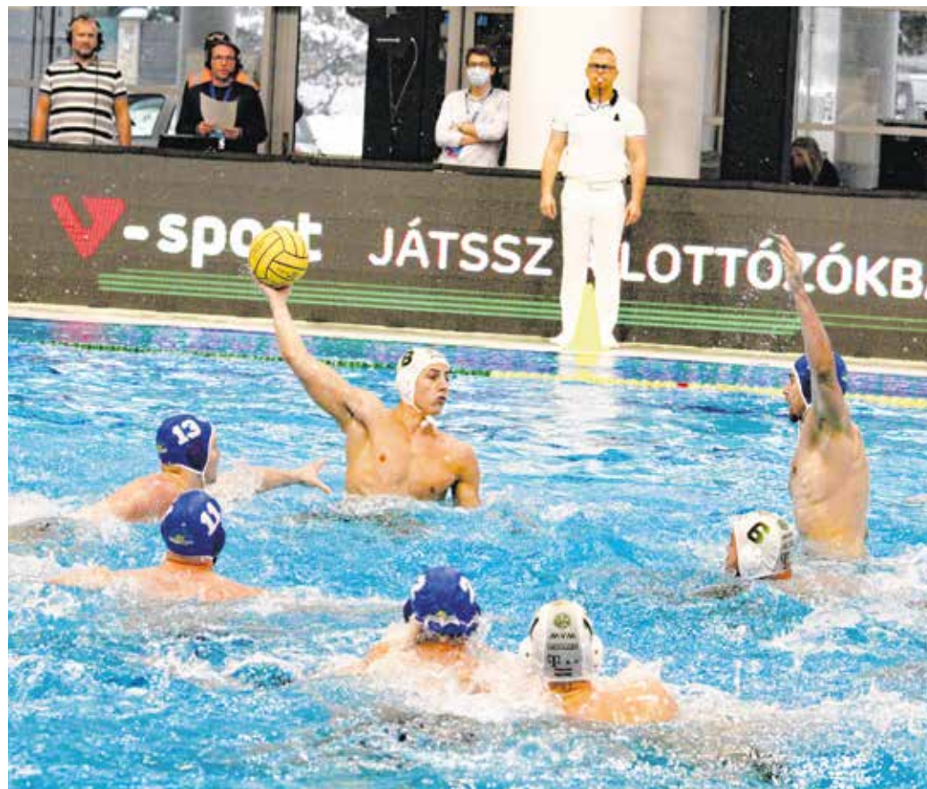
Japán helyett Magyarország – június 18-a és július 3-a között hazánk rendezheti meg a vizes világbajnokságot. Sopronban vízilabda-mérkőzéseket tartanak.

– Természetesen! Óriási hatása volt annak, hogy akár női, akár pedig férfi vízilabdában igazi sztársapatok jöttek el, Sopronba és nagyon magas színvonalú mérkőzéseken döntötték el a Magyar Kupa sorsát. Utána egyből lehetett érezni és azóta is tart ez a folyamat, miszerint rengeteg fiatal jön, jelentkezik, akinek