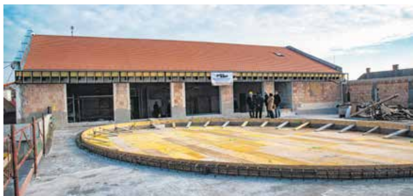
Az épületgyűttes hátsó szárnyában egy zárt udvar is helyet kap, ahol a gyerekek biztonságban játszhatnak.

Dr. Farkas Ciprián polgármester emlékeztetett: nem csak itt bővítik a város kisgyermeknevelő intézményeinek kapacitását, hamarosan 84 férőhelyes bölcsőde alapkövét teszik le a Hillebrand Jenő utcában, aminek építése szintén a kormány támogatásából valósul meg.