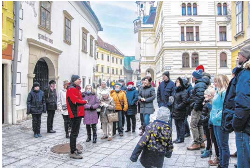
Minden vasárnap 10 órakor kezdődik a városnéző program, amelyen a turisták mellett sok soproni is részt vesz.