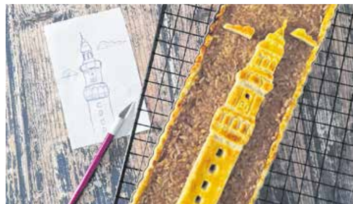
Hofmeister Fanni Tűztoronyt ábrázoló sütije népszerű lett a múzeum közösségi oldalán.

A Tűztorony, amint a járványügyi helyzet engedi, megnyitja kapuit, több újdonsággal is készülnek a szakemberek. A Lenck-villáéhoz hasonlóan megújul a shop, ahol a Tűztorony-emblémával ellátott termékeket lehet majd megvásárolni. Természetesen a korábbi népszerű ajándékok továbbra is a kínálatban maradnak, de kiegészülnek új, friss termékekkel. A bolt egyébként nemcsak a Tűztoronyban újul meg, hanem a Macskakő Gyermekmúzeumban is. Fontos információ még, hogy a Soproni Múzeumnegyed építési munkálatai miatt a Storno-ház csak a felújítás után lesz újra látogatható.