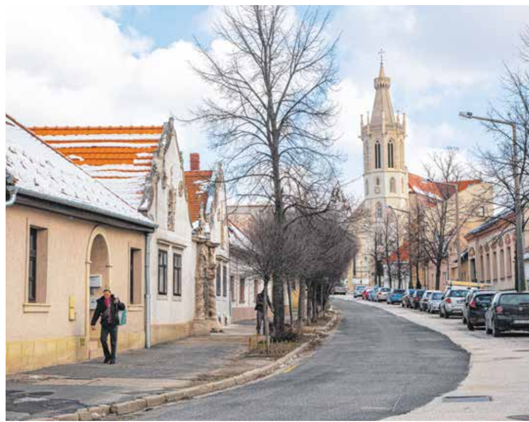
A városrész és egyben Sopron szimbolikus épülete a Szent Mihály-templom.

A városrészt a Várkerület felől, az Ikvahídon keresztül érjük el. Az Ikvahidat, amely alatt folyik az Ikva-patak, egykor Ispotály hídnak is hívták, mivel a jelenlegi 2-es számú ház helyén állt a középkori johannita ispotály. A hídról jobbra haladva érjük el a Balfi utcát, amelyet már 1413-ban Schrippergasse néven említtettek. Az utca német nevét valószínűleg a Fertőszéplakra vezető útról kapta, mivel ezen a településen a XV. században a jelentős, a soproni kereskedők által látogatott vásárok voltak. A Balfi utcában jellegzetes poncichterházakat láthatunk. Ezeket a keskeny utcáfront, az udvaron hosszan hátranyúló további lakrészek