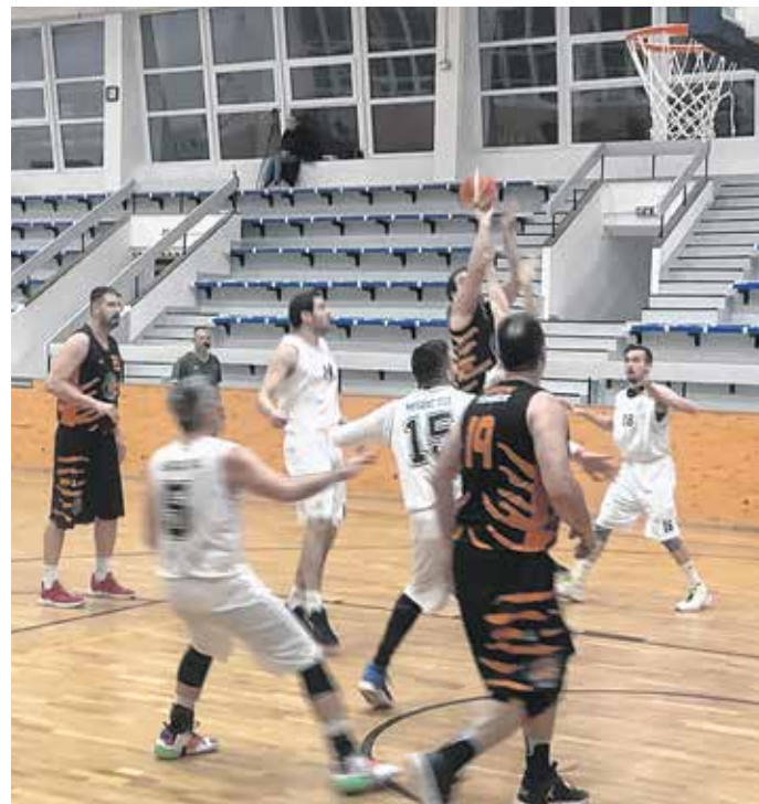
A Soproni Tigrisek NB II-es csapata jó úton jár a kítűzött cél felé, szeretne a legjobb négy között végezni.

A játékos-edző hozzátette: a csapattagok nagy része rutinos kosaras, korábban szép eredményeket értek el. Ezt a magot egészíti ki