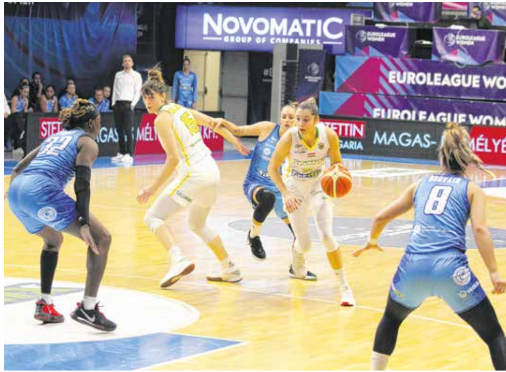
A Sopron Basket a Ludovika-FCSM Csata ellen szinte edzőmeccset játszott, a Szekszárd és a Győr elleni mérkőzéseken azonban igazi erőpróba vár a soproni hölgyekre.