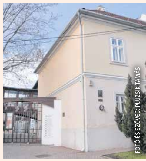
FOTÓ ÉS SZÖVEG: PULZSIK TAMÁS

zött avatták fel 1989-ben, a Liszt Ferenc Zeneegyesület megalakulásának 160. évfordulóján, majd az a jezsuita konviktnak épült, 2001 és 2003 között felújított és az új helyen megnyitott zeneiskola Szélmalom utcai homlokzatán helyezték el. A külön táblán lévő szöveg Solt-ra E. Tamás szobrász- és éremművész munkája.