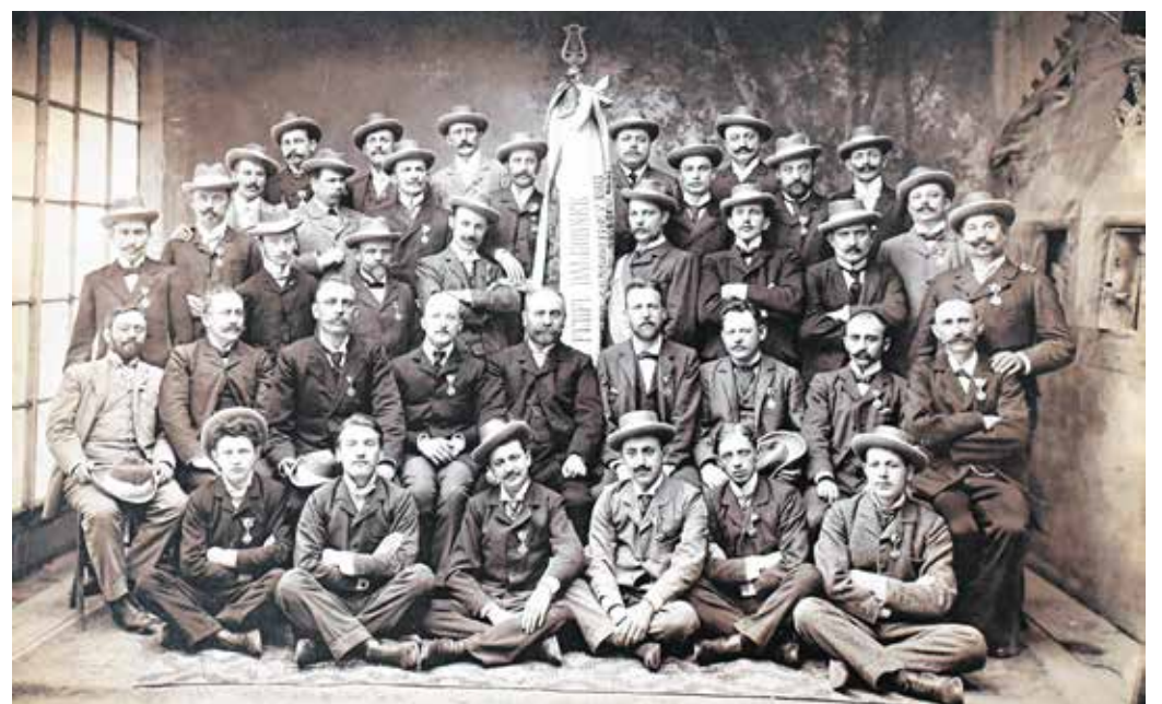
A Soproni Magyar Férfi Dalkör egy 19. század végi csoportképen.