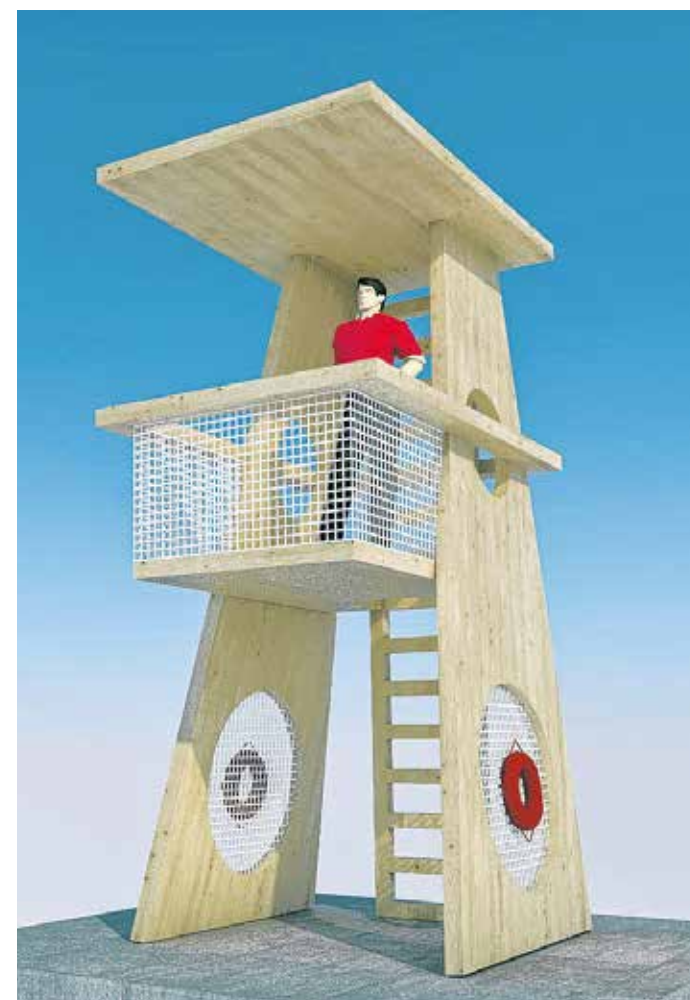
A Baywatch-torony soproni ötletterve.