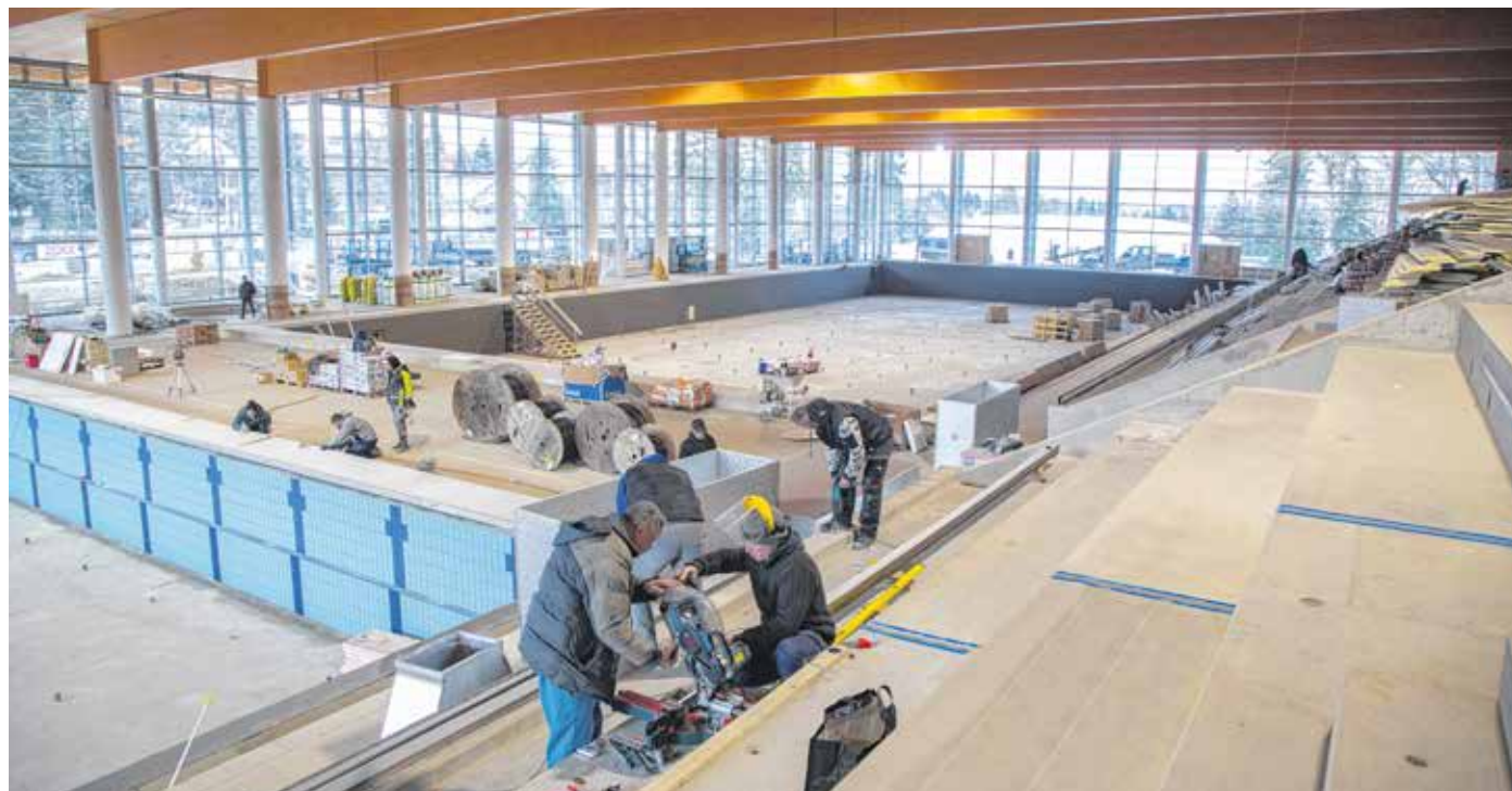
A sportuszoda alapterülete 11 ezer négyzetméter, egy légtérben alakítják ki az ötvenméteres és a bemelegítő-, valamint a tanmedencéket, jakuzzi, szaunát, gőzkabint.

Miután elkészül, nemcsak a soproni vízisportot és az úszni vágyók életét fogja kiszolgálni ez az épület, hanem hiszük azt, hogy jelentős hazai és nemzetközi sportrendezvények megtartására is alkalmas lesz. Reméljük továbbá, hogy a létesítmény az edzőtábor-turizmusnak is kedvelt helyszínévé válik.