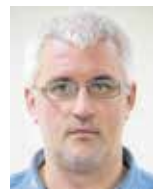
P. HORVÁTH LÁSZLÓ

Az ütemterveknek megfelelően halad az új sportuszoda építése a Lovérekben. A létesítmény próbaüzeme várhatóan áprilisban kezdődik.