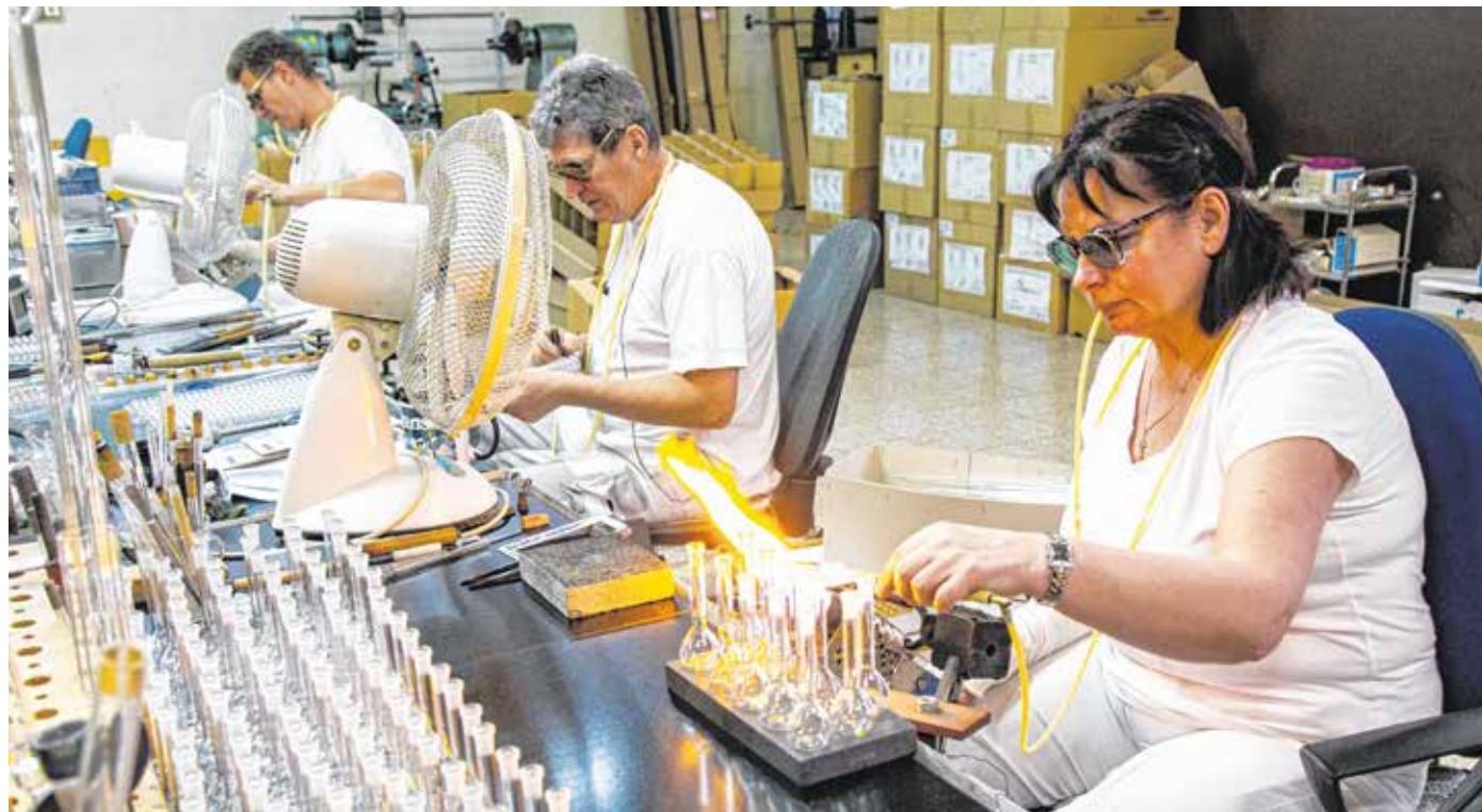
Több mint 60 alkalmazott dolgozik a Csonka Glas Kft.-nél – háztartási és laboratóriumi üvegeket készítenek.

Mint arról lapunkban beszámoltunk (A jövő soproni építése, Soproni Téma, 2021. február 10.), tavaly a soproni vállalkozásokhoz közel 827 millió forint vissza nem térítendő pályázati forrás érkezett. Beruházásai és fejlesztései összértéke több mint 1 milliárd 340 millió forint volt. A Széchenyi Programiroda lapunk elküldött – nyilvános – adatbázisában szerepel, hogy a Gazdaságfejlesztési és Innovációs Operatív Program keretében a 48 helyi cég között a Csonka és Fiai Kft. technológiai