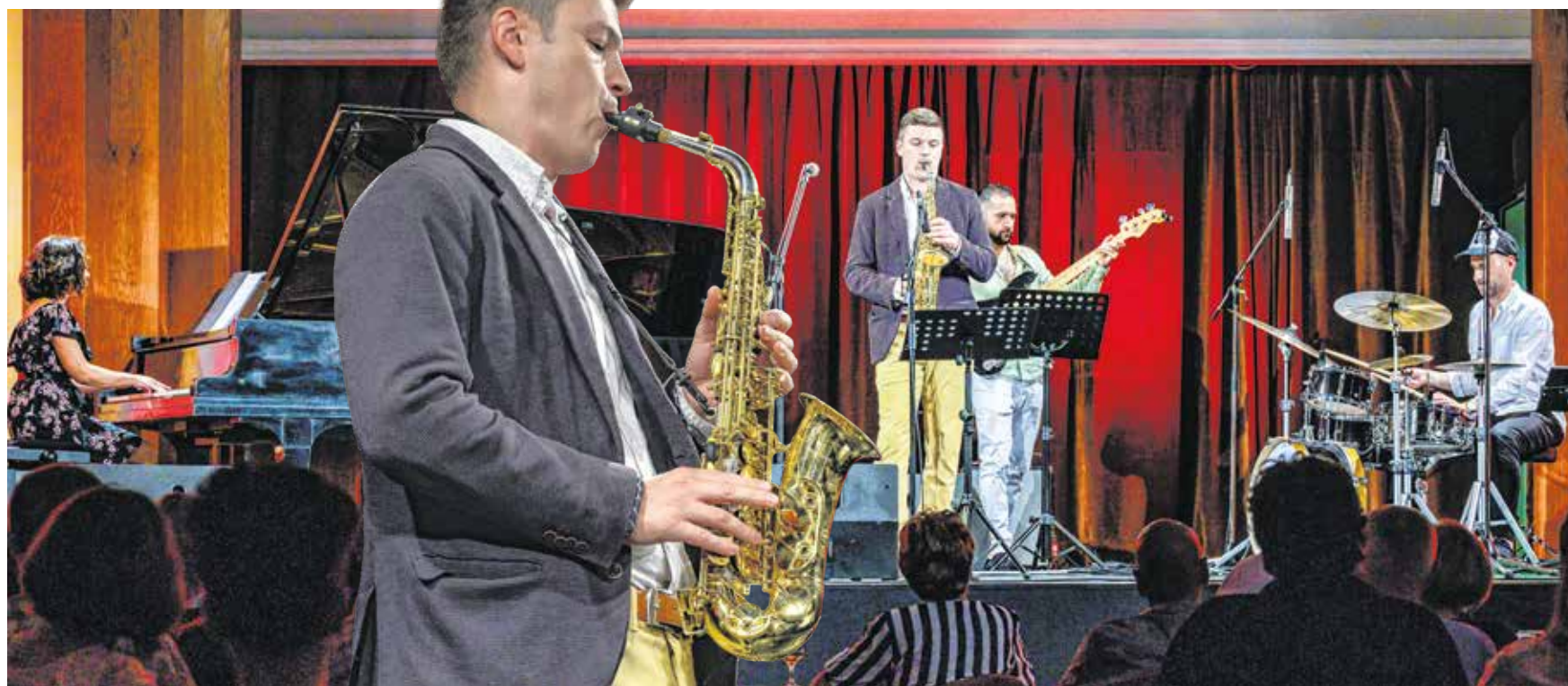
A Jazzpoint repertoárja nagyon változatos, megtalálhatók benne ismert swing, latin, bossa nova és fúziós dzsesszszámok is.