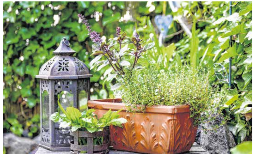
A kakukkfű a fény- és melegéyes, déli fekvésű helyeket kedveli. FOTÓ: ILLUSZTRÁCIÓ