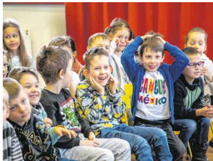
A programsorozat első részében a fafúvós hangszerekkel ismerkedtek meg a diákok.

A kisiskolások márciusban a húros hangszerekkel ismerkedhetnek meg, majd a rézfúvós hangszerek világában mélyedhetnek el, utolsó alkalommal pedig a zongora és az ütőhangszerek hangjait élvezhetik. A hagyományoknak megfelelően a programsorozatához egy rajzpályázat is kapcsolódik, a foglalkozásokon átélt élmenyűket felidézhető alkotásokkal pályázhatnak az elsősök. A legjobb rajzokat díjjazzák.