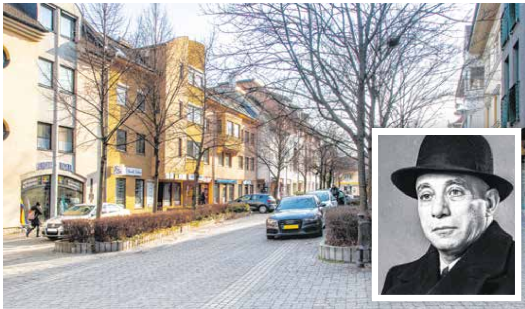
A Füredi sétányt 1995-ben nyitották meg, ezzel Füredi Oszkárnak, a modern építészeti jeles alakjának állítottak emléket.

Az utca megvalósításához a Várkerület házához tartozó, hosszan hátrafelé húzódó kerteket kellett felszámolni. Az utca elnevezésének ötletét