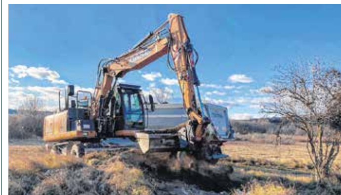
Az összegyűjtött hulladékot újrahasznosították vagy ártalmatlanították a szakemberek.

A közleményben felhívják a lakosság figyelmét, hogy lakcímkártyájával ingyenesen elhelyezhetik hulladékukat a zöldudvarokban. Erről további információ a www.stkh.hu weboldalon olvasható.