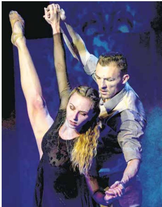
Jelenet a táncelőadásból.