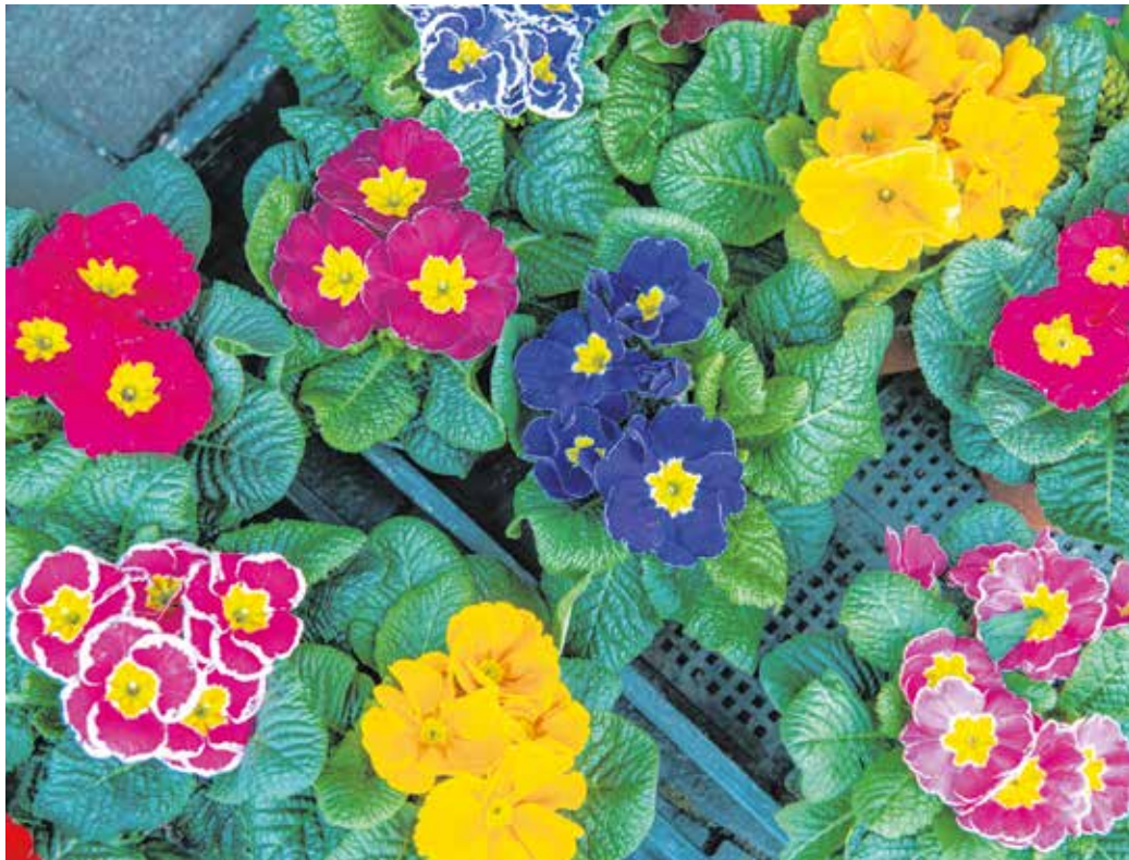
A primula a lehető legváltozatosabb színárnyalatokban kapható, van belőle sárga, piros, lila, rózsaszín is.

Az évelő növény az enyhén savanyú, tőzeges talajt kedveli. A legérzékenyebb a hőmérsékletre: csak a hűvös (10 és 20 fok közötti) helyeken pompázik, a tűző napsütést pedig egyáltalán nem bírja. Már ilyenkor ki lehet ültetni a balkonládába vagy a kertbe, és számíthatunk rá, hogy