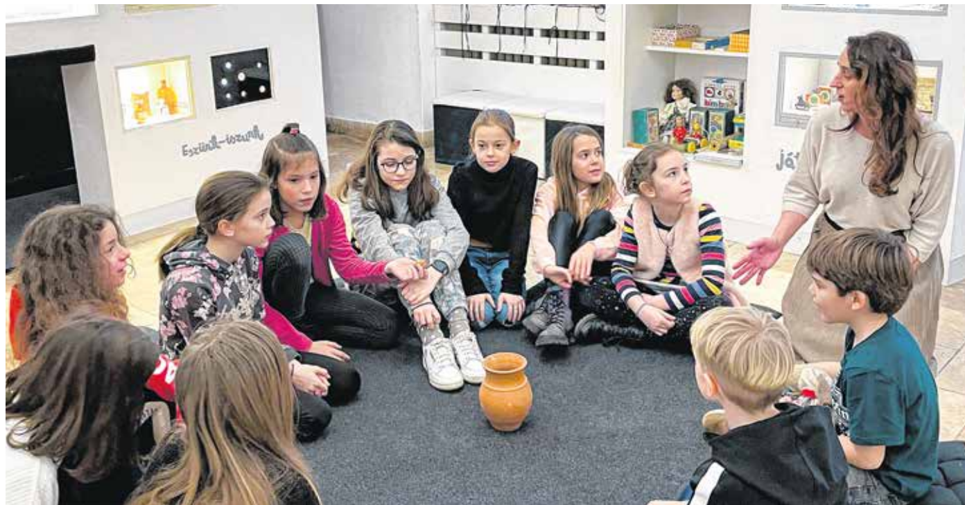
A Macskakő különlegessége, hogy a tematikusan elrendezett tárolók mögött egy interaktív tér nyílik, ahol a diákok érzékszerveik megmozgatásával és mókás feladatok segítségével tanulhatnak.