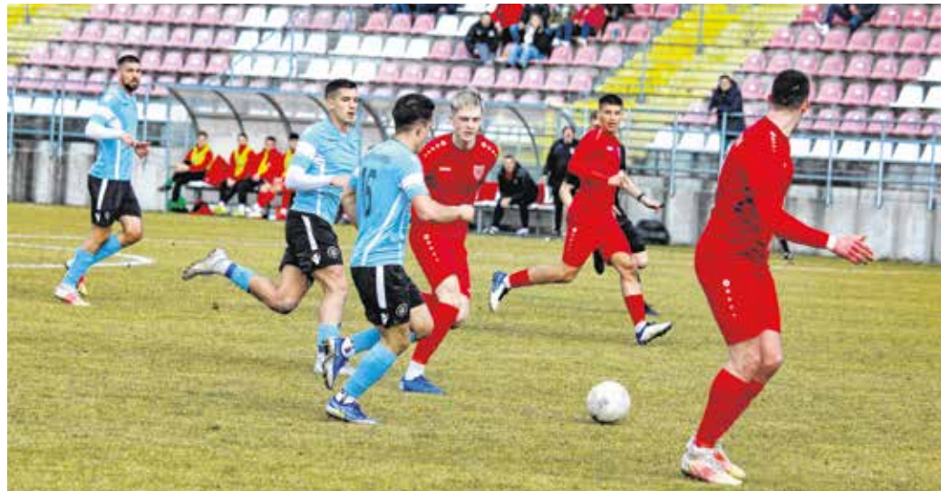
A Balatonfüred ellen a második félidőben sikerült megszerezni a vezetést, de a vendégek ezután lőttek két gólt, így kikapott a Sopron.