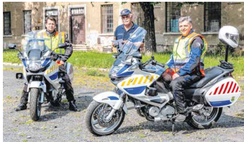
2020 óta motoros polgárőrök is járőröznek Sopronban.

A polgárőrök közé bárki várnak, aki betöltötte a tizennyolcadik életévét, és büntetlen előéletű.