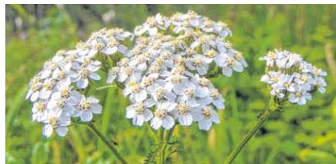
A cickafark gyűjtése teljes virágzása idején javasolt, pár centiméteres szárral együtt csak a virágzatát kell leszedni, és árnyékos helyen megszáritani.

Terhesség és szoptatás idején, illetve 12 éves kor alatti gyermekeknek nem javasolt a cickafark használata. Az allergiásoknál a növény érintése is reakciót válthat ki, a tea fogyasztása viszkető, gyulladást okozhat.