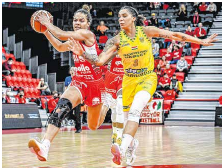
Nem sikerült a címvédés az idei kiírásban – a Sopron Basket maradt tízszeres Magyar Kupa-győztes.

A döntőben meglepetésre nem a legkomolyabb hazai rivális, Szekszárd, hanem a tolnaiakat búcsúztató DVTK volt a címvédő ellenfele. A miskolciak hazai környezetben léphettek pályára. A DVTK szerb centere, Milica Jovanovic