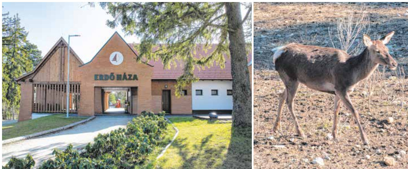
Jelenleg csak gímszarvas tehének élnek az Erdő Háza vadasparkjában, de a tervek szerint tavasszal bika is érkezik.