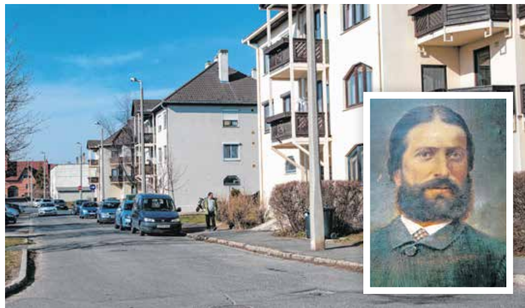
Handler Nándorról 1999-ben nevezték el az Aranyhegyen található utcát.

Handler Nándor valószínűleg Dél-Ausztriában és Kelet-, valamint Észak-Németországban folytatta tanulmányait. Apja vállalkozásában helyezkedett el, aki pótolhatatlan