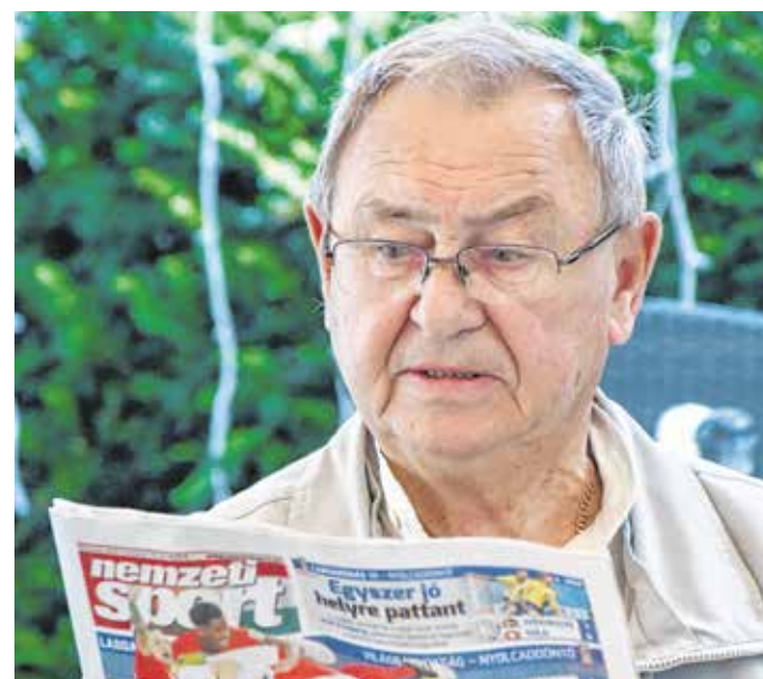
Puskás Árpád a régi pingpongosoknak egy legenda volt.

– Az én generációm számára az ő neve és az asztalitenisz elválaszthatatlan – mondta Szendrői Judit informatikus.