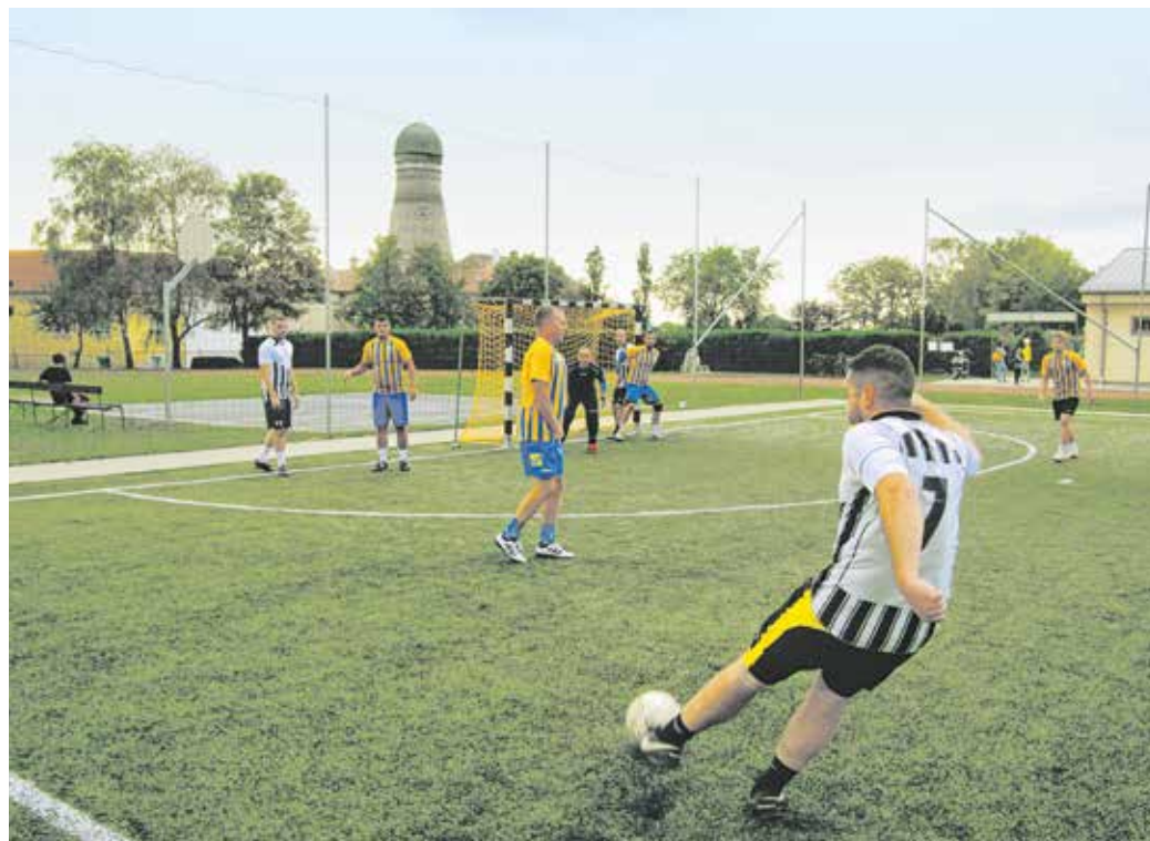
Tavasszal is a Halász Miklós Sporttelepen (felvételünkön), valamint a tóparton játsszák a kispályás labdarúgó-mérkőzéseket.

Az első- és a másodosztályban 16–16 csapat szerepel. Az, hogy mennyi csapat játszik majd a harmadosztályban, még nem tudható, ugyanis az újonnan nevezett együttesek itt kezdik a pontvadászatot. Így a pontos adatok a nevezési idő letelte után derülnek ki, miként