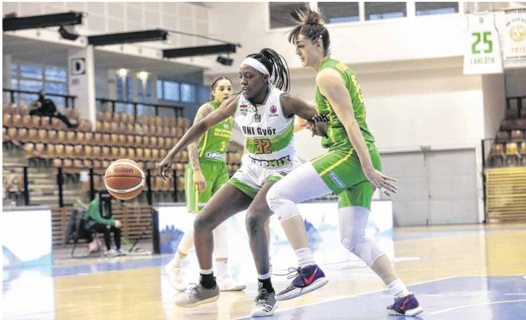
A Sopron Basket a Szekszárd és a Győr otthonában (felvételünkön) is győzni tudott, ezekkel a sikerekkel hangolt a szerdán kezdődő Magyar Kupa nyolcaddöntőjére.

A tréner szerint külön nem készülnek a Magyar Kupa nyolcaddöntőjére. A csapatok ismerik egymás játékát, egy-egy taktikai húzás okozhat meglepetést a mérkőzéseken, ugyanakkor mindenki