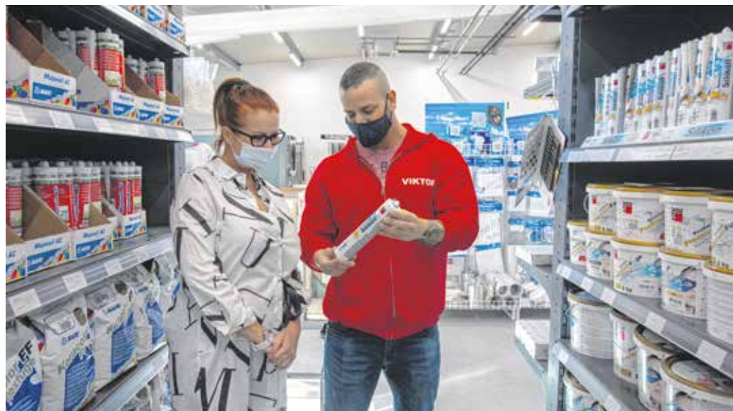
Megnőtt a forgalom az építőipari kiskereskedelemben. Az általunk megkérdezett szakemberek szerint az emberek most a drágább alapanyagokat is keresik.