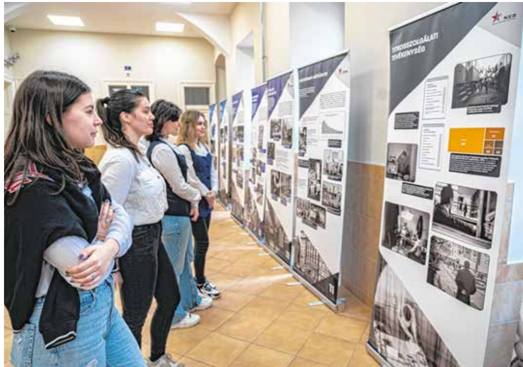
A Szent Orsolya-iskolában 16 tablón mutatják be az elnyomás évtizedeit.

Az Országgyűlés 2000. június 13-án elfogadott határozata minden év február 25-ét a kommunizmus áldozatainak emléknapjává nyilvánította.