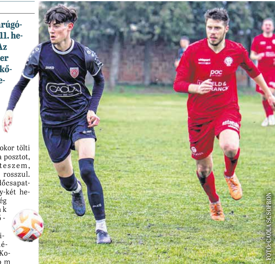
A felkészülési meccseken jó képet mutatott magáról az SC Sopron.

– Ha az őszi meccseket nézem, a helyzetek alapján maradt bennünk néhány pont – hangsúlyozta Bücs Zsolt. – Ha ezek meglennének, akkor most a hetedik-kilencedik helyen kényelmes pozícióban állnánk. A továbbiakban úgy akarunk szerepelni, hogy egy percre se legyenek kiesési gondjaink, és a bajnokság