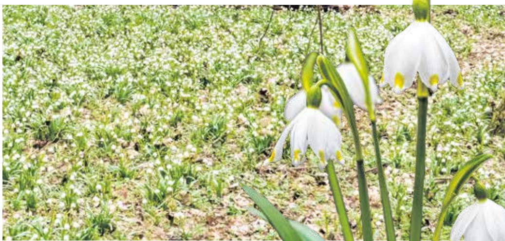
A Csáfordjánosfa mellett húzódo, huszonnégy hektáros védett terület milliónyi tőzike otthona. Idén is utánozhatatlan látványt nyújt a tőzikevirágzás.