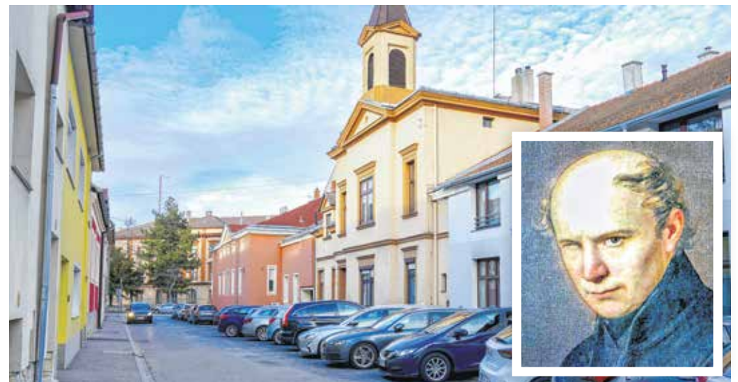
A Kölcsey Ferenc utca a Flandorffer-telep felparcellázásakor alakult ki.

I. Ferenc József 1884. május 31-én részt vett a soproni Tiszti Leánynevelő Intézet kápolnájának a felszentelésén.