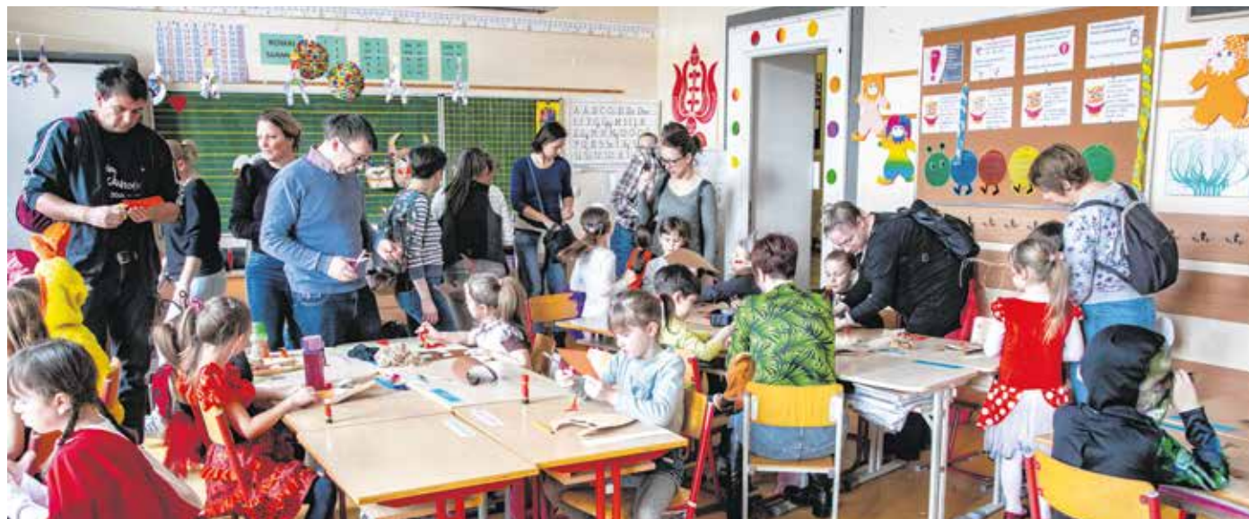
A soproni iskolákban nyílt napokat és foglalkozásokat tartanak a nagycsoportos óvodásoknak, ahol a gyerekek és szülei megismerhetik a leendő tanítókat is. Felvételünk a Petőfi-iskolában készült.