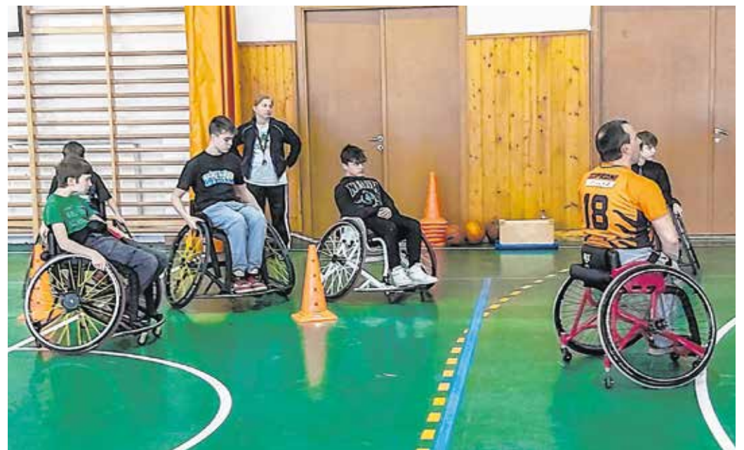
A Deák téri iskola diákjai kipróbálhatták, milyen kerekesszékekben kosárlabdázni.