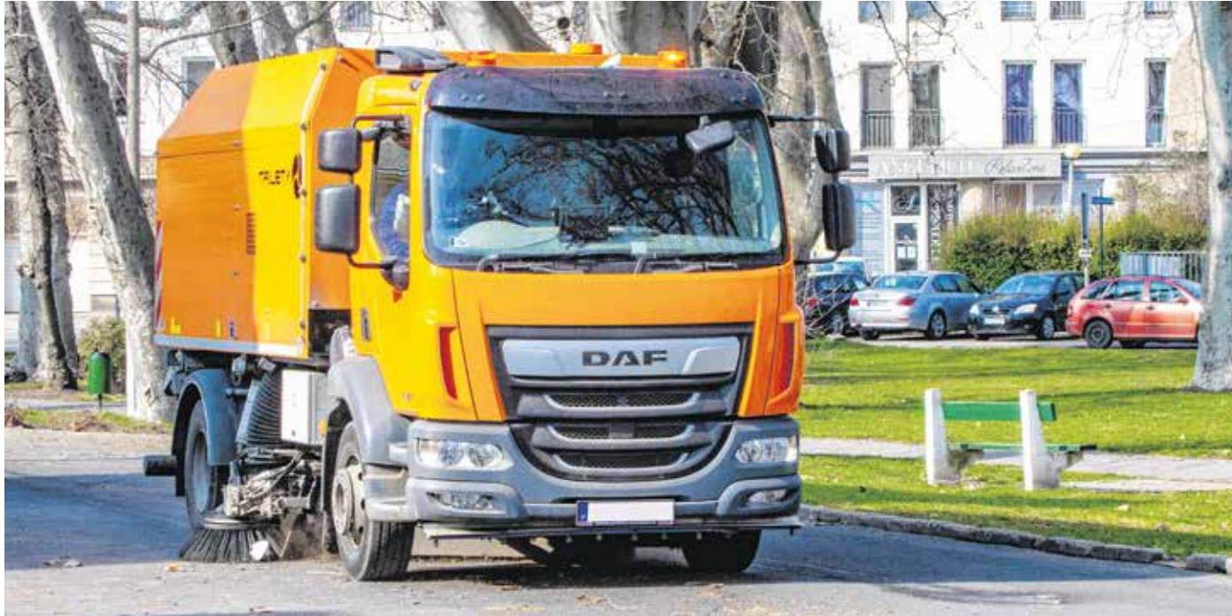
A Sopron Holding Zrt. szakemberei már járják az utakat – parkokban, tereken és játszótéren is takarítanak.