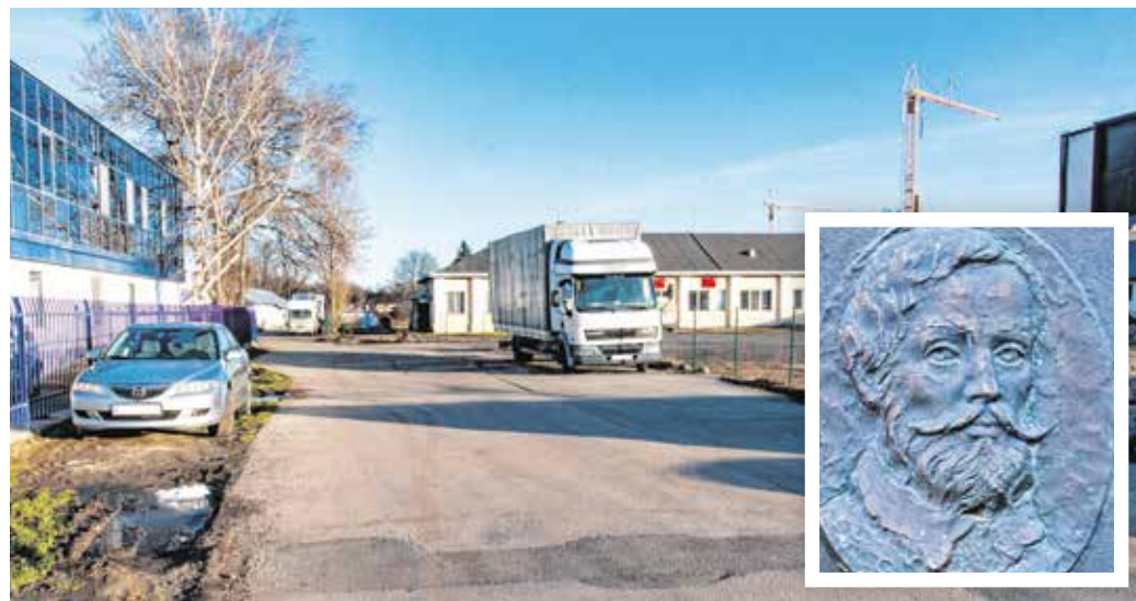
A Murmann Sámuel utcában volt a császári és királyi 13. tüzérezred kaszárnyája.

Az utcában volt a császári és királyi 13. tüzérezred kaszárnyája, a Frigyes főhercegről elnevezett tüzérségi laktanya, melynek nagy részét 1944–45-ben lebombázták. Korabeli adatok szerint 362 ember és 235 ló elhelyezését tudták megoldani benne. A tüzérségi laktanya 18 nagy és 13 kisebb épülete közül csak négy maradt meg: ezek az Ágfalvi út 2. szám alatt találhatók, ahol többek között bank, ingatlancentrum, nemzeti dohánybolt és irodák működnek. A másik épület a lovarda, amelynek tetőszerkezete teljesen vasból készült. Itt ma