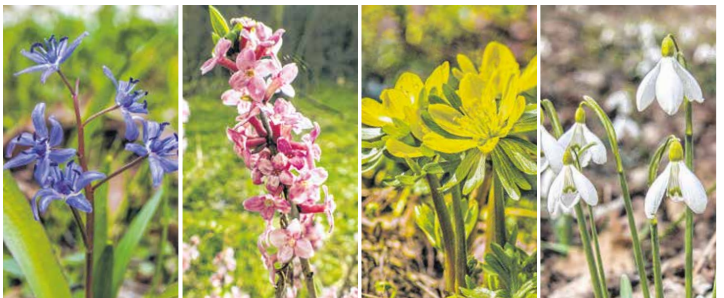
A csillagvirág, a farkasboroszlán, a téltemető és a hóvirág is ezekben a hetekben virágzik.