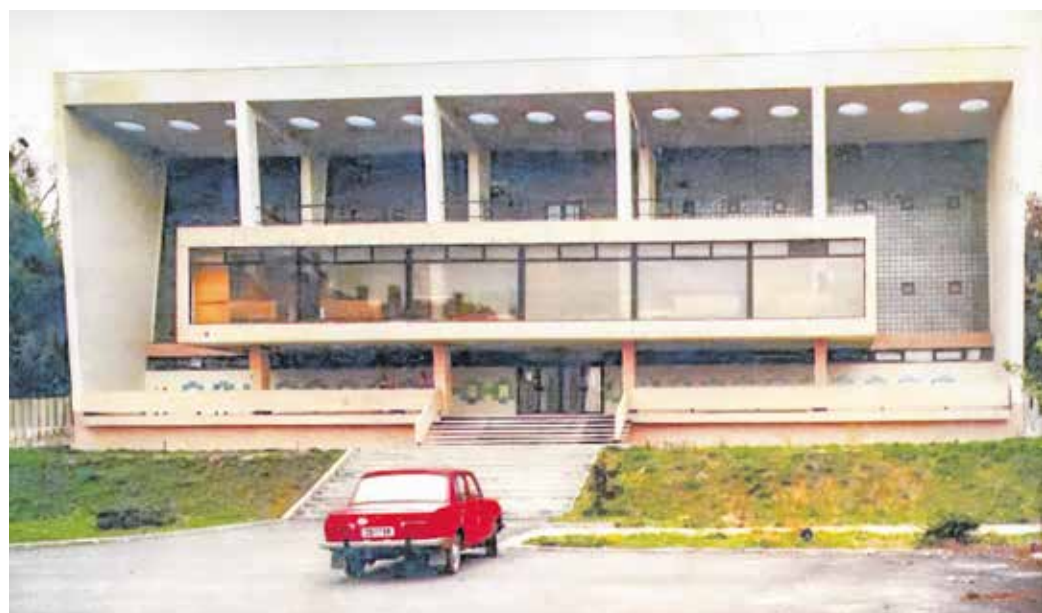
Az egyetemi csarnokot 1968. február 25-én avatták fel.