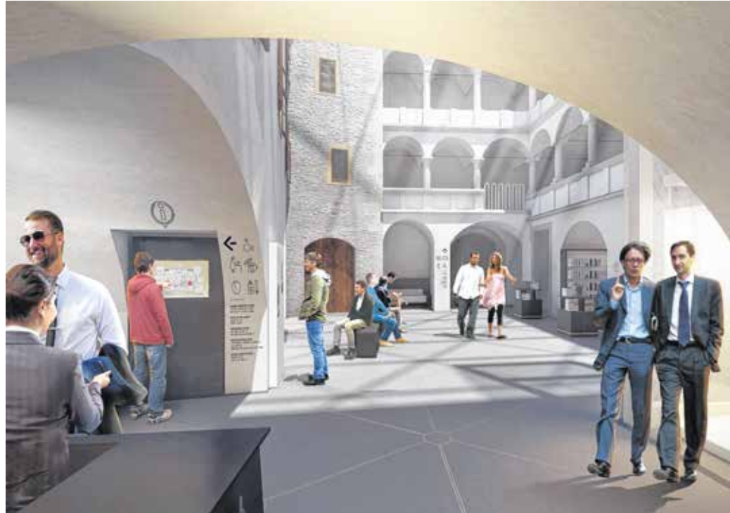
A leendő múzeumnegyedben vadonatúj kiállításokat is létrehozunk. LÁTVÁNYTERV

– Sopron évszázados hagyományokkal bír a letűnt korok emlékeinek gyűjtésében. Az első hivatalos múzeumi kiállítás 1866-ra tehető – hangsúlyozta. – Azóta időről időre törekszik megújulni mind szellemiségében, mind épített környezetében. Épületállományát növelve és fejlesztve reagál a gyűjtemények növekedésére, és próbál megfelelni az adott kor látogatói elvárásainak. Ezt az állandó fejlődési vonalat folytatva kezdődött a Soproni