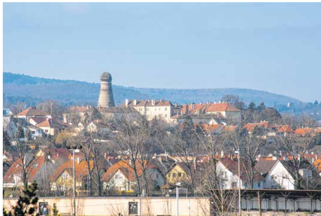
A Kurucdombon a városrészt jelképező szélmalmot 1841-ben építették.

Bár eredetileg a kőfaragók a városban laktak, a XIX. század folyamán kitelepítették műhelyeiket a mai Kőfaragó térre, így például a Mechle és a Hild céget is. Az 1960–70-es