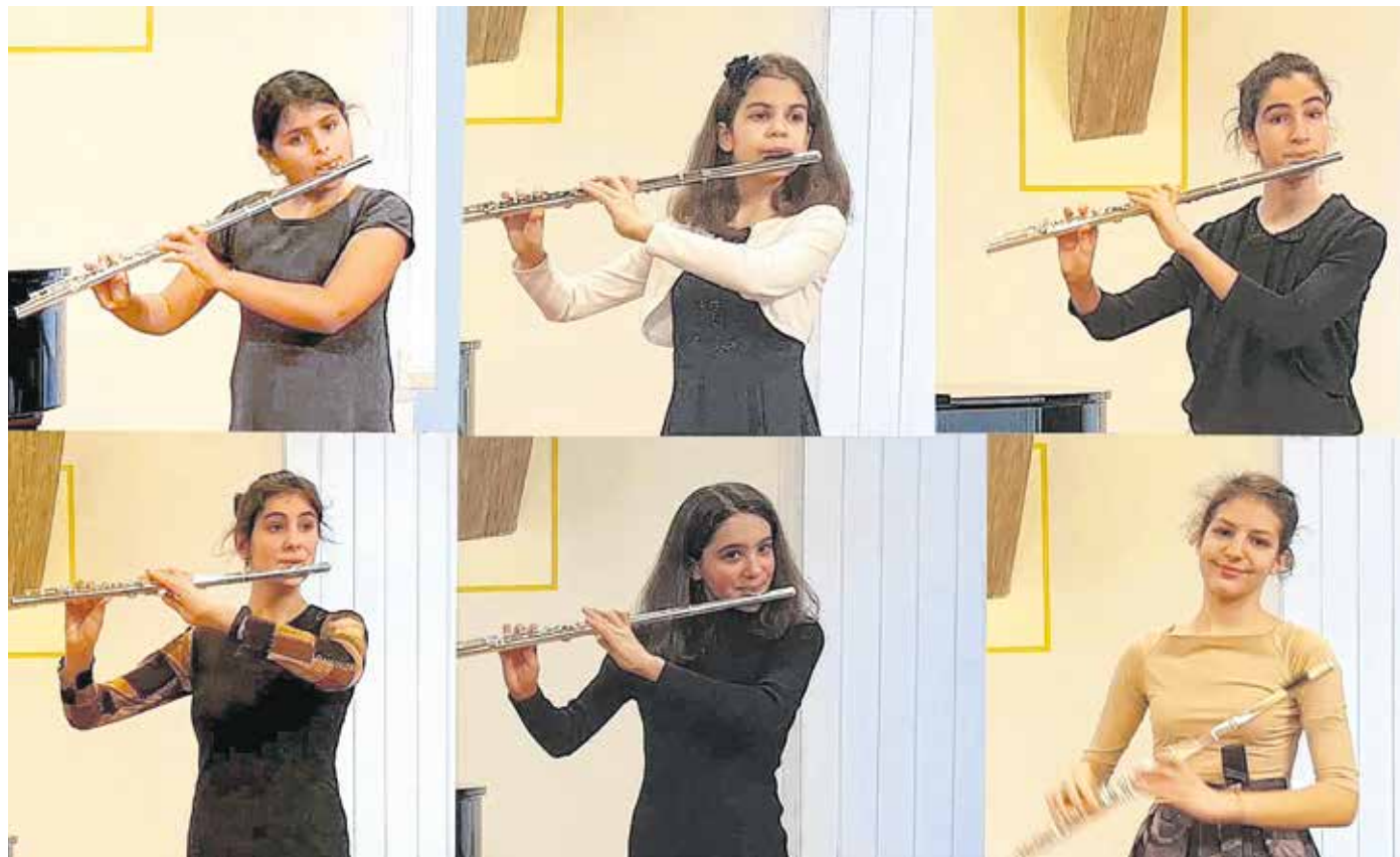
Hatból hat – mindegyik soproni zeneiskolás bejutott a X. Jeney Zoltán Országos Fuvolaverseny döntőjébe.