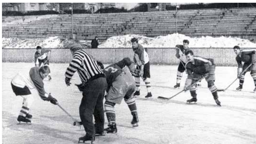
Jelenet az 1966-os szezon egyik mérkőzéséből – a soproniak megnyerték a vidékbajnokságot.

– Nemcsak a kupát nem sikerült hazavinniük a