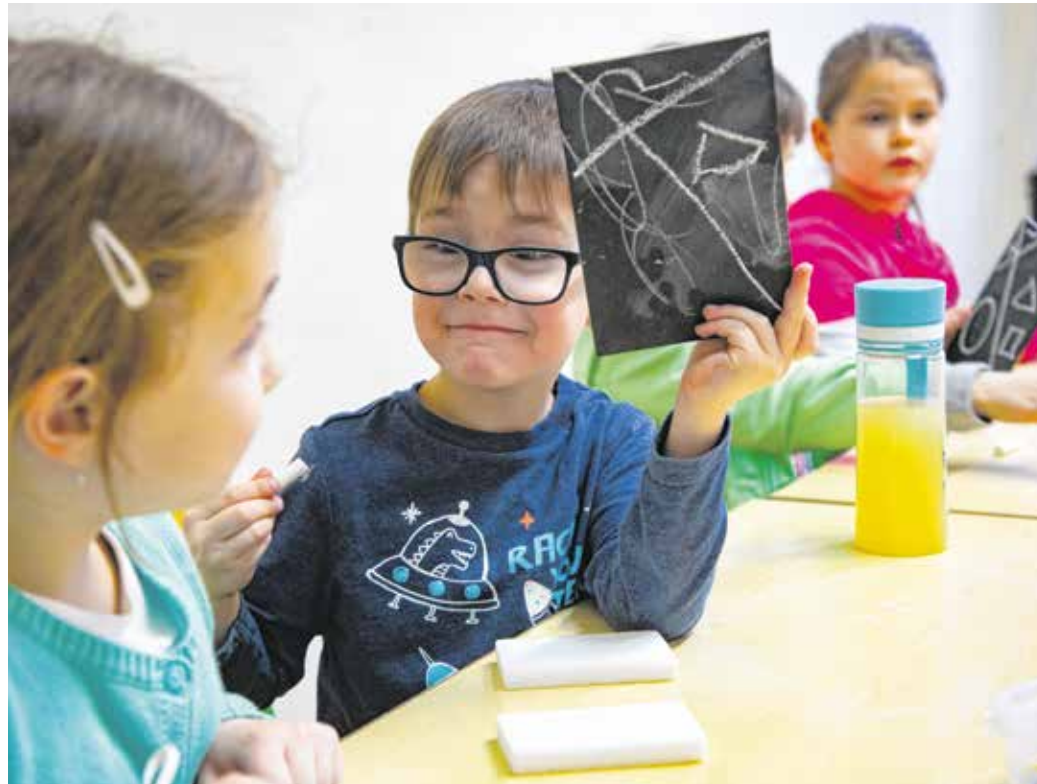
Csoportban gyakorolnak az ovisok, készülnek az iskolakezdesre. A szakember szerint a feladattudat kialakulása kulcsfontosságú ebben az életkorban.

– Nagy szükség lenne az angolszász preschool – azaz előkészítő osztály – bevezetésére, ahol játékos formában, de kötelező jelleggel, meghatározott keretek között fejlesztik a leendő iskolások képességeit, készségeit – folytatta a tanító. – Bár az új NAT egy elnyújtott előkészítő időszakot igyekszik finomítani az átmenetet, mégis utána rohamtempóval próbálja behozni az „elmaradást”. Mivel az iskola nincs felkészülve a hatalmas különbségekkel érkező gyermekek fejlesztésére, és az óvodákban sincs már kötelező jellegű foglalkozás, a szülőknek hatalmas a felelőssége abban, hogy gyermekét felvértezze az iskolai elvárásokkal, követelményekkel szemben.