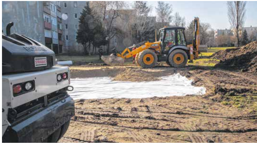
A Makó utca végén már dolgoznak, nyárra készülnek el az új parkolók.