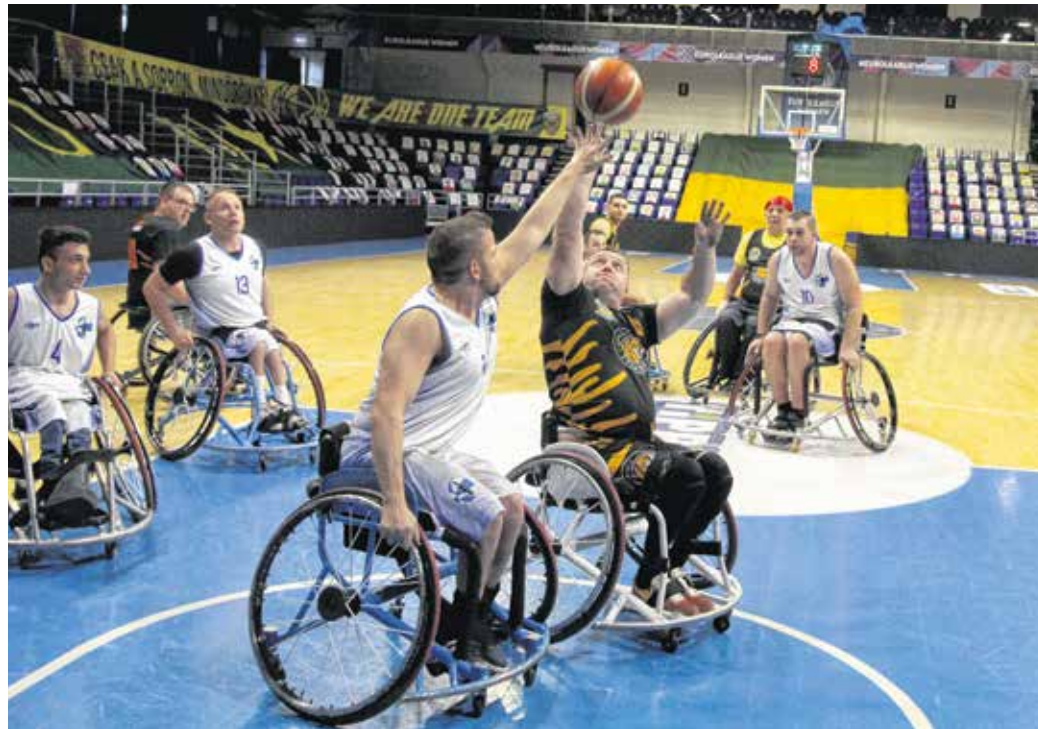
A Soproni Tigrisek kerekesszékes kosárlabdacsapata versenyben van a bajnoki címért.

A sportvezető hozzátette: a koronavírus miatt nincsenek könnyű helyzetben, a fertőzés