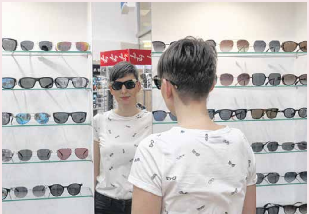
A szakemberek azt javasolják, hogy a stílusunknak megfelelő szemüveget válasszunk.

Pozsgai Klaudia optikus hozzátette: a sportos, arcra simuló fazonok soha nem