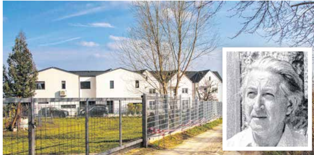
A Gáspárdy Sándor utca a Küllői utca és a Harkai–Kőszegi út találkozásánál húzódik, az Alsólövérek szélén.

A Gáspárdy Sándor utca a burkolatlan Küllői utca és a Harkai–Kőszegi út találkozásánál húzódik, az Alsólövérek szélén, a Jehova Tanúi gyülekezetének épülete mögött. 2019. február vége óta viseli a festőművész nevét. Jelenleg földút, ám a környéken gombamód növekvő családi és társasházak száma arra enged következtetni, hogy a jövőben ez változni fog. A VOLT alatt a fesztiválózókat gyakran vették birtokukba. Az utca végén hobbikertek, mezőgazdasági területek, szőlőföldek kezdődnek. Korábban is mezőgazdasági művelés alatt álló terület volt, a Soproni Állami Gazdaságnak volt itt diófása, amit 1996-ban privatizáltak, az 57 hektárt egy pécsi részvénytársaság vette meg. A Soproni Állami Gyermekek Szívszinatoriuma még meglévő épületei ma romosan állnak a Gáspárdy Sándor utcában. A szanatóriumnak sertéshizlaldája is működött itt, a '70-es években még lovaskocsin szállították a szanatóriumából az