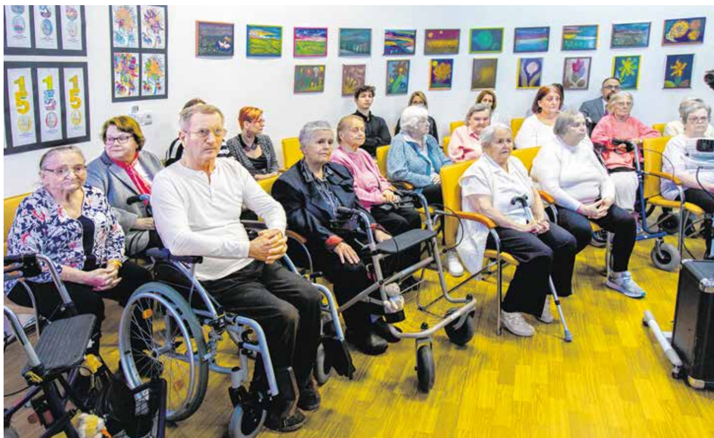
A Balfi úti Idősek Otthonának napjainkban 160 lakója van – az emlékévkben az ő képeiket is árverésre bocsájtják.