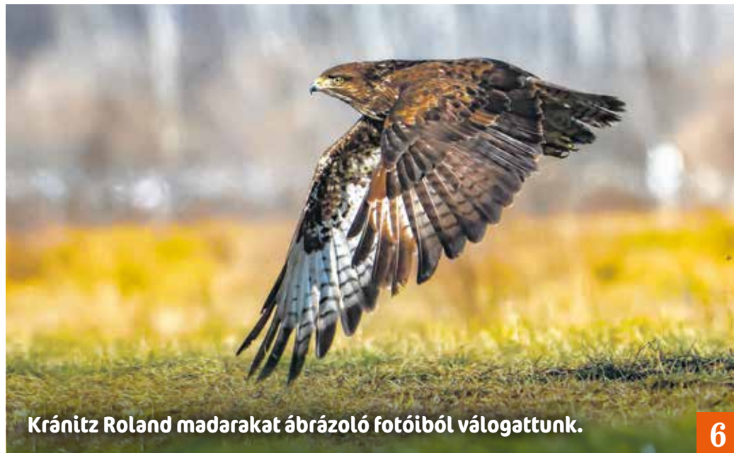
Kránitz Roland madarakat ábrázoló fotóiból válogattunk.