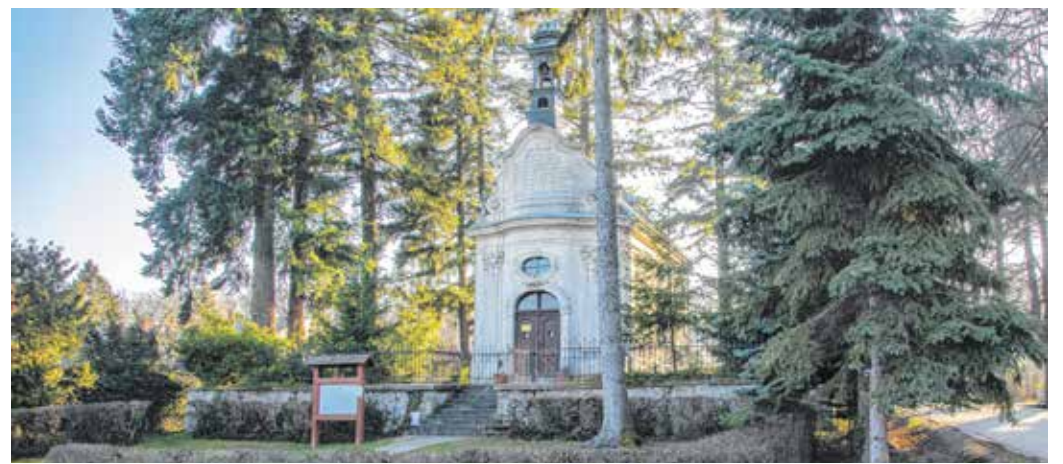
NEPOMUKI SZENT JÁNOS-KÁPOLNA: A Várisi út és a Villa sor kereszteződésénél található a Nepomuki Szent János-kápolna. Története kalandos: 1764-ben az Előkapuban, a Tűztorony árnyékában állították fel. Amikor 1893-ban a régi városházát elbontották, értékes régészeti leletek kerültek elő. Több épületet is lebontottak, ez a sors várt a Nepomuki Szent János-kápolnára is. A soproniak viszont nem akarták elveszíteni, ezért köveit, faragványait megszámozták, elszállították és a Lővérekben 1899-ben eredeti formájában felépítették újra.

Az írás elkészítésében közreműködött dr. Krisch András, a Soproni Evangélikus Gyűjtemények vezetője.