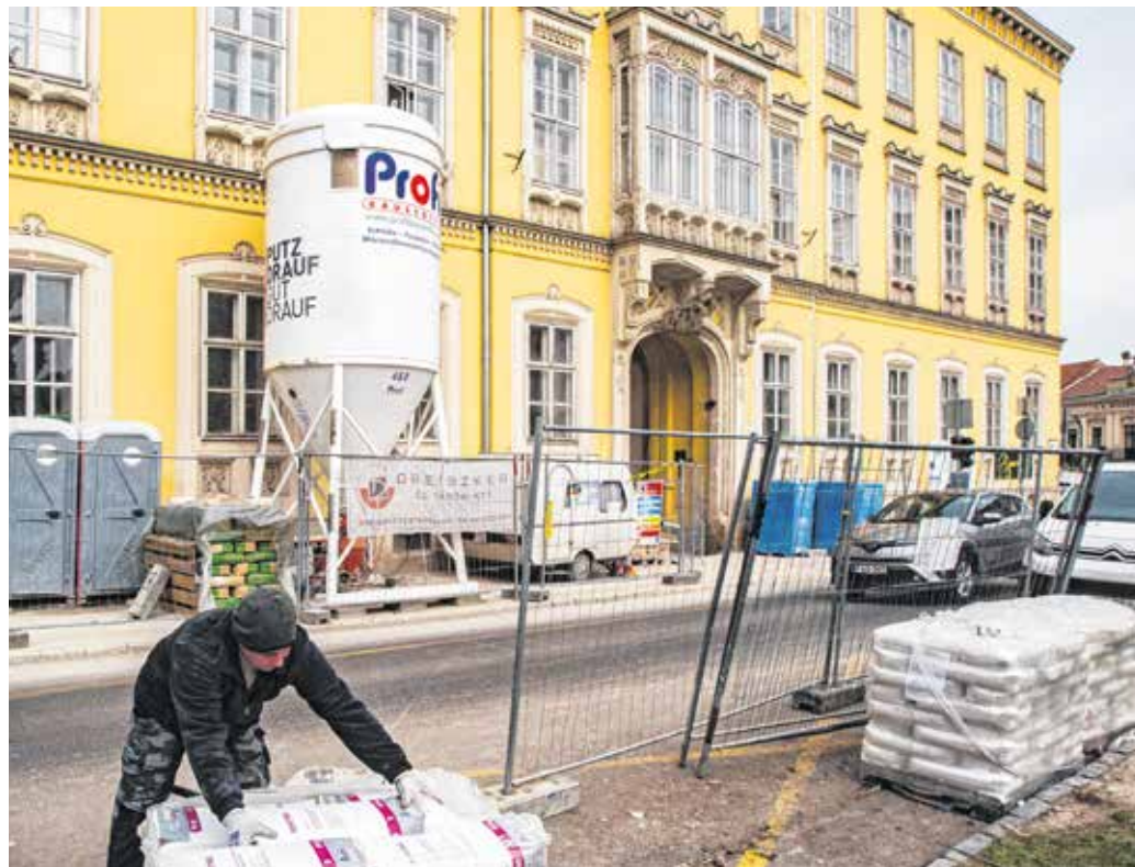
Jelenleg az Orsolya-iskola Széchenyi téri szárnyában dolgoznak a szakemberek. Hamarosan kezdődik a nyílászárók cseréje és a homlokzatfelújítás.

és burkolás is zajlik. – Az eddigi zsúfoltság helyett több és nagyobb szaktantermet tudunk kialakítani, így egyszerűbbé válik a bontott nyelvi és matekcsoporthoz az igazgató. – Rövidesen felállványozzák az épületet a Széchenyi tér és a Várkerület felől, elkezdődik