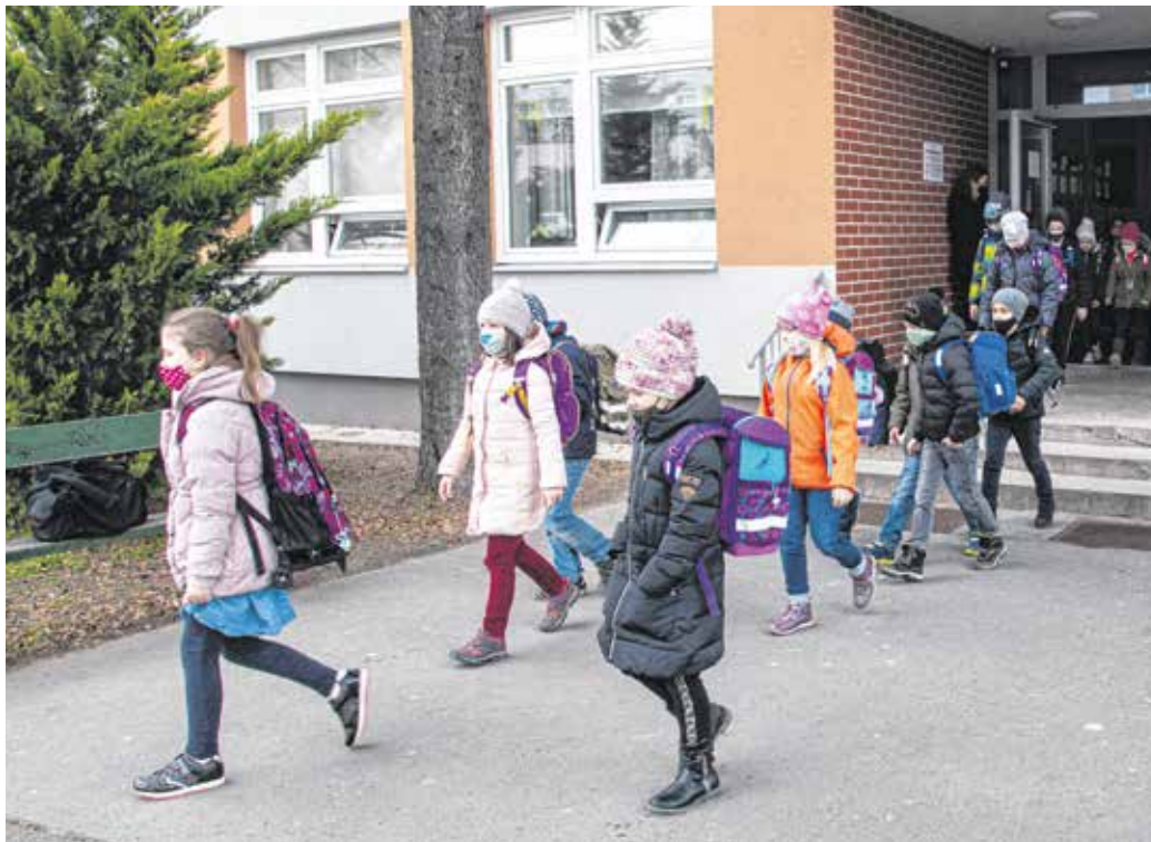
Indulnak haza a diákok a Deák Téri Általános Iskolából – ha a közelben lakik a család, idővel egyedül is járhatnak iskolába a tanulók.

– Fontos kritérium lehet még a tanító néni személye és az általa alkalmazott módszer – folytatta a gyógypedagógus. – Ugyan nyílt napokra a jelenlegi helyzetben nincs lehetőség, viszont az iskolák honlapjairól gyűjthetünk adatokat, ismerősöktől tapasztalatokat. A módszerekről gyakran az iskolák pedagógiai programjából is tájékozódhatunk, az óvopedagógusok pedig javaslatokat tehetnek arra vonatkozóan, hogy a gyermekünk személyiségéhez milyen módszer illik. Azt is érdemes mérlegelni, hogy a tanítónő-kisfelmenő- vagy nagyfelmenő-rendszerben dolgozik-e, továbbá, hogy iskolaotthonos