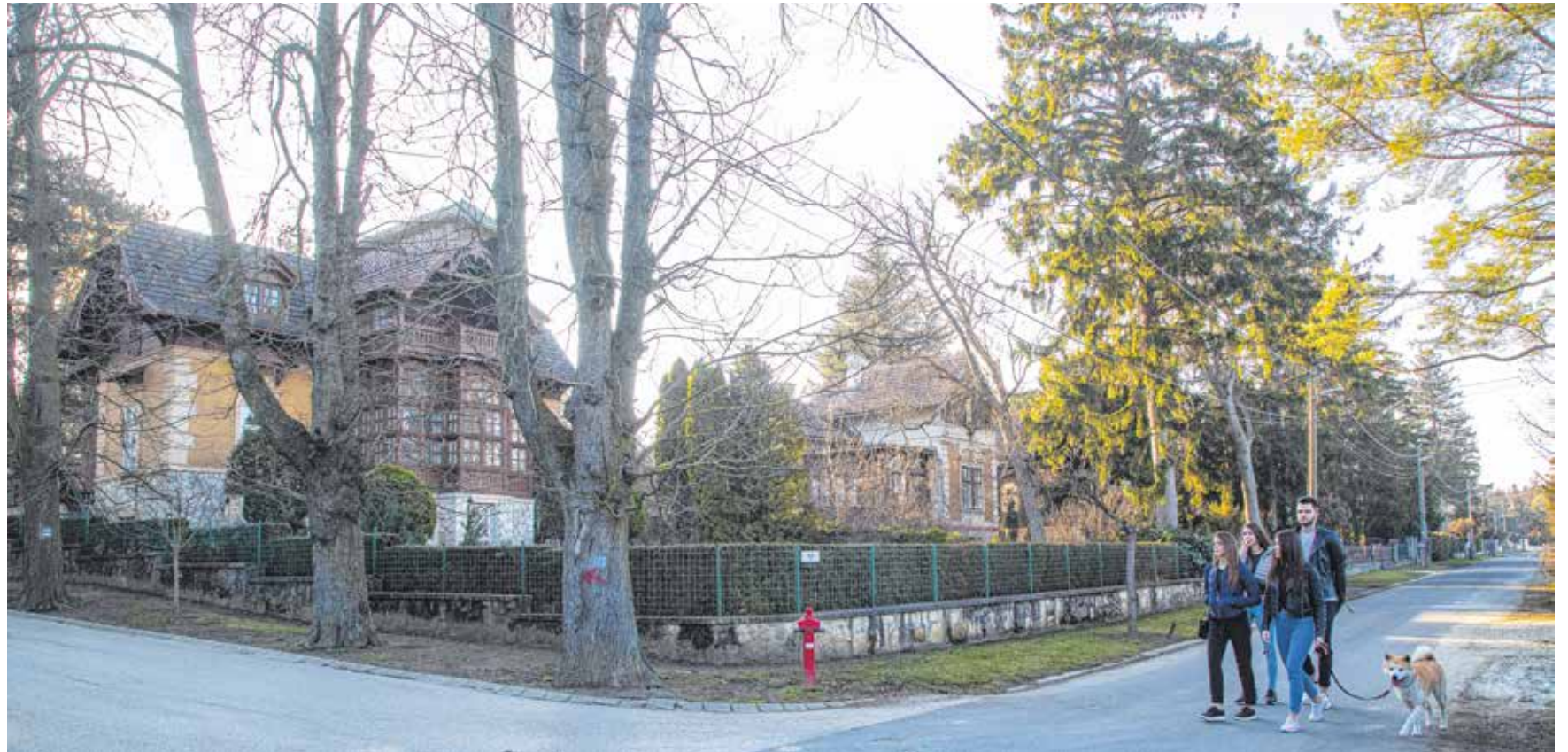
A XIX. században a Lővérekben kerteket, gyümölcsösöket alakítottak ki, kis házakat építettek. Később ezeket építették át nyaralókká, villákká.

A XIX. században felgyorsuló urbanizáció elszakította a városlakókat a természettől. A vagyonosabb soproni polgárok ennek ellensúlyozására a század végén a Lővérben vettek kert, gyümölcsös, ahová sokszor egy kis házat is építettek. A kerteket jellemzően sövényrel kerítették el. Az idő múlásával ezeket a favázás házakat elkezdtek reprezentatívabb nyaralóépületekké, villákká átépíteni. Ekkor