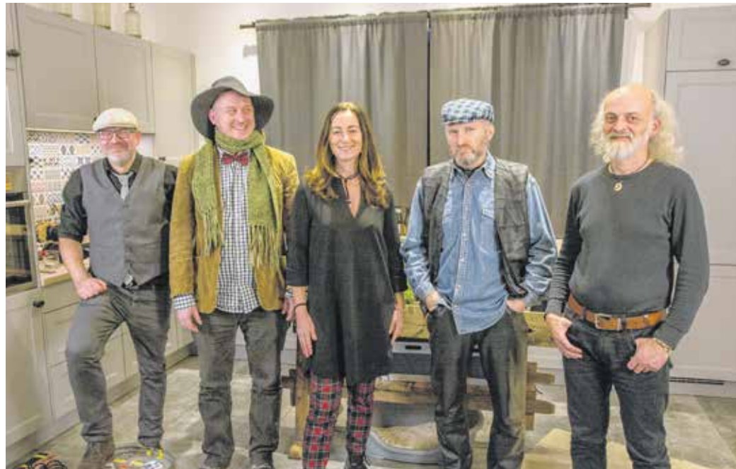
Az együttes tagjai is sikeres konyhakoncertet adtak.

– Különleges alkalom volt összejönni, de azért a tavalyi évben még akadtak fellépéseink. Pont egy éve zenéltünk Sopronban, a Bűgőcsigában. Aztán nyáron részt vettünk több zenei megmozduláson, mint például a tokaji utcazene-fesztiválon, a Bayou Blues Campen Molnaszecsődön, a Tűfokán fesztiválon, az oballai falunapon, az