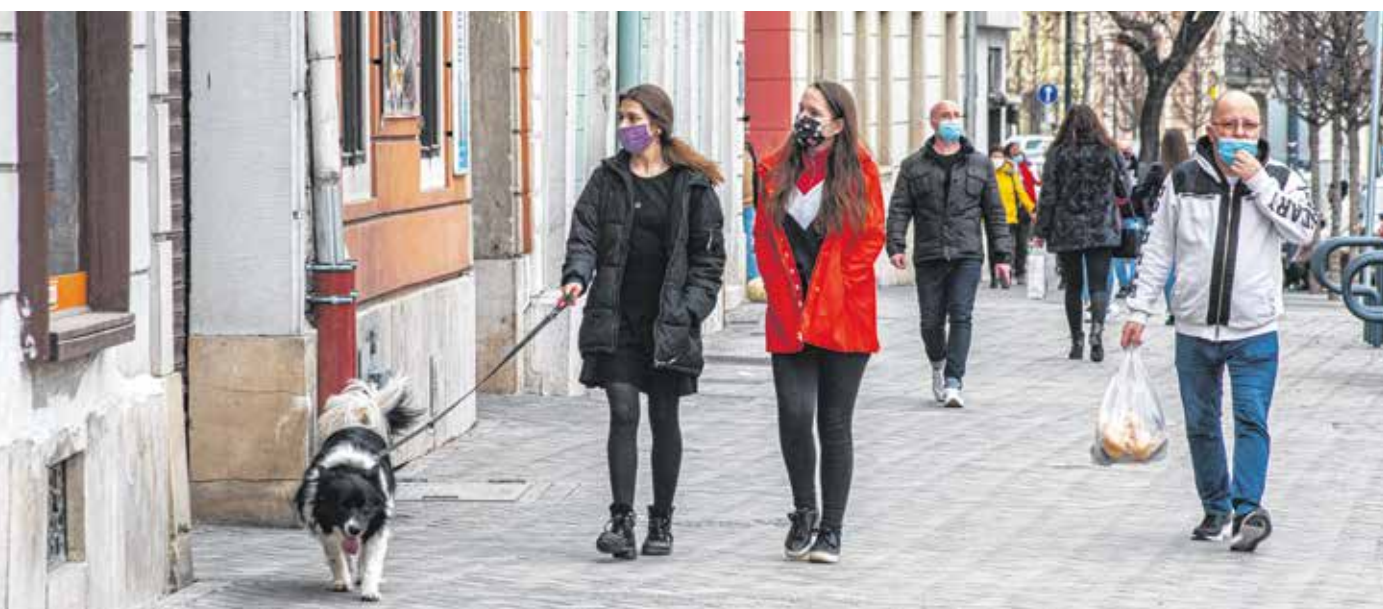
A hétfőtől érvényes szabályok szerint a maszkviselés a lakott területen belül valamennyi utcán, közterületen kötelező. Sopronban eddig is maszkot kellett hordani az utcán.

INGYENES INTERNET A DIÁKOKNAK, TANÁROKNAK: Márciusban az általános iskolás diákoknak és tanáraiknak 30 napra ingyenes lesz az internet, ugyanúgy, mint azoknak a tanulóknak és pedagógusoknak, akiknek korábban a járványhelyzet miatt digitális oktatásra kellett átállniuk.