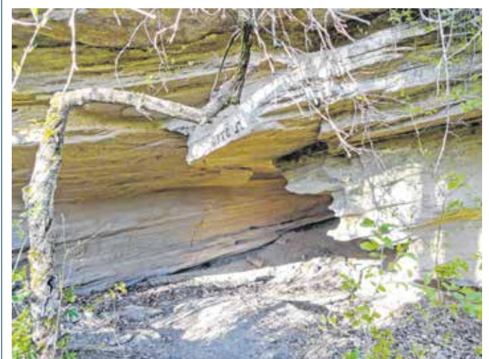
Az Ottó-barlang homokkő fala.

Sopron környékén nem nagy kihívás bejárni a barlangokat, hiszen méretesebb mindössze négy van. (Erről lapunkban is írtunk: Az Ottó és a Ferenc-barlang, Soproni Téma, 2021. szeptember 29.) A négy barlang közül három látogatható: a 16 méter hosszú Fehér-barlang, valamint a Dudlesz-erdőben lévő Ottó- és a Ferenc-barlang. Utóbbi barlangok homokkő falain kirajzolódott mintázatokon megfigyelhetjük a Pannon-tenger évmilliók múltját.