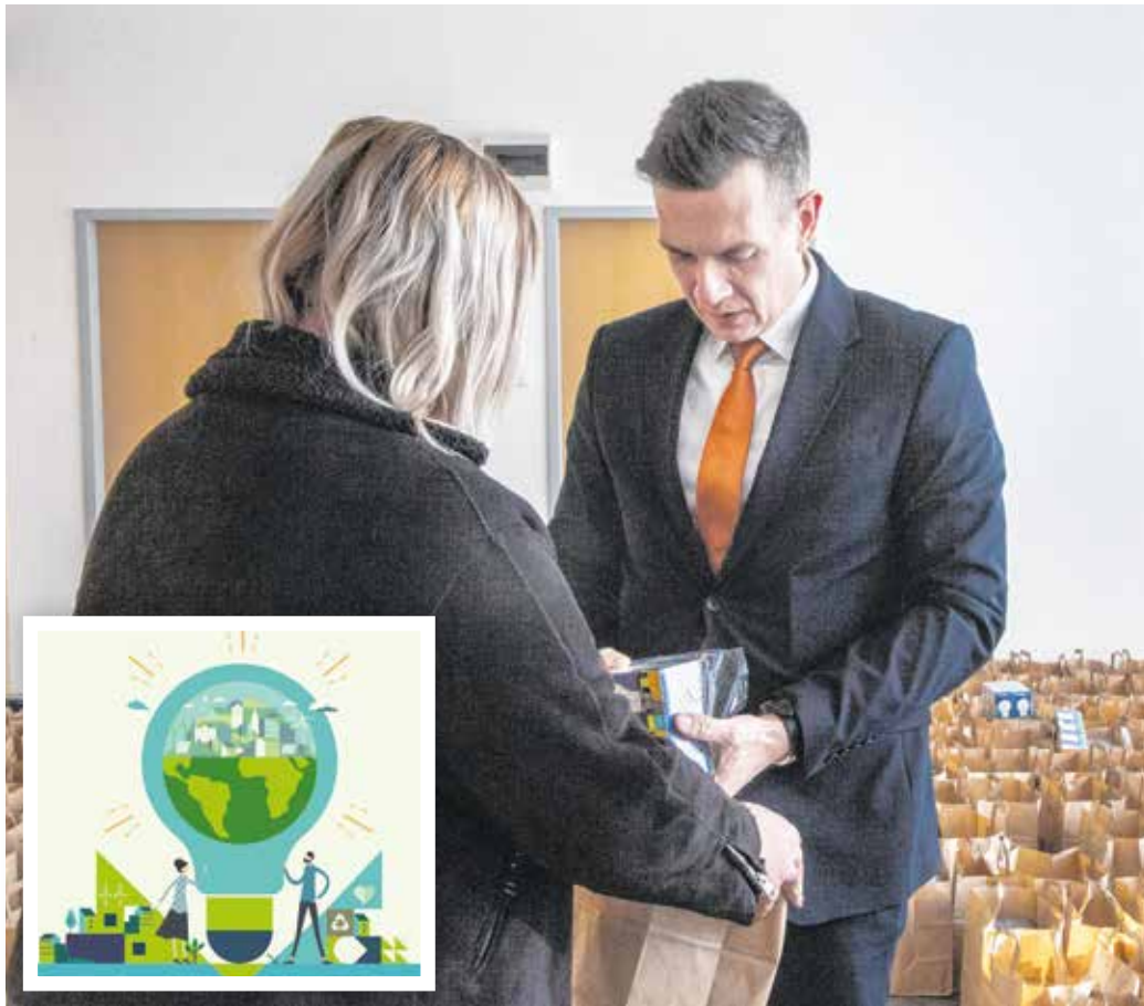
Csaknem tizenötezer ingyenes LED-izzót vehetnek át a soproni családok.

– A rádióban hallottam először a kezdeményezésről, a regisztrációt pedig a feleségem intézte – tudtuk meg Gali