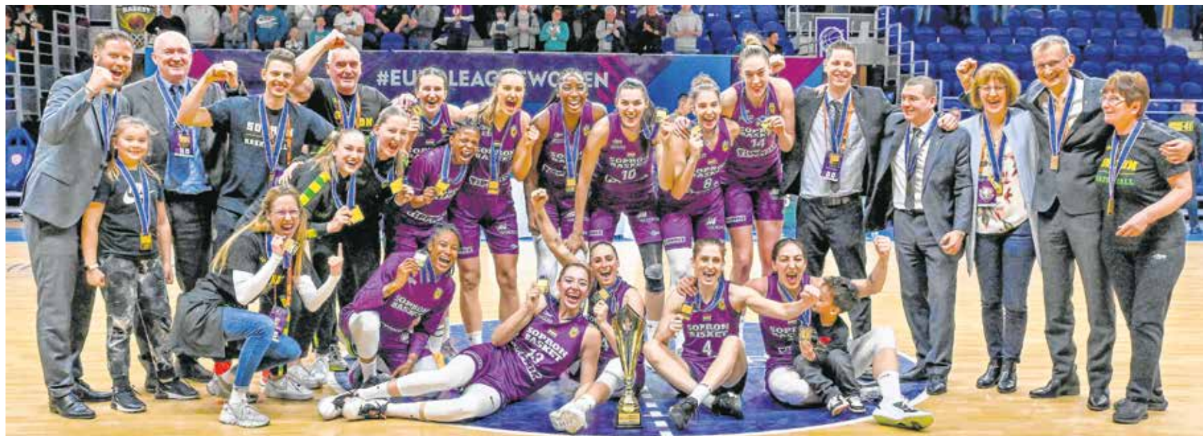
A Sopron Basket Magyar Kupa-győztes csapata – a lányok nem hagytak kétséget a döntőn, több mint 40 pontos fölényrel nyertek a Pécs ellen.

De térjünk vissza a soproni négyesdöntőre! Igazi finálénak inkább az elődöntőt lehetett nevezni, hiszen a hazai bajnokság egyik legerősebb és legjobb formában kosárlabdázó együttese, a Győr ellen kezdtek Fegyvernek. Komolyabb izgalmakat azonban nem hozott a mérkőzés: két negyed alatt olyan különbség alakult ki, amely behozhatatlannak bizonyult, a