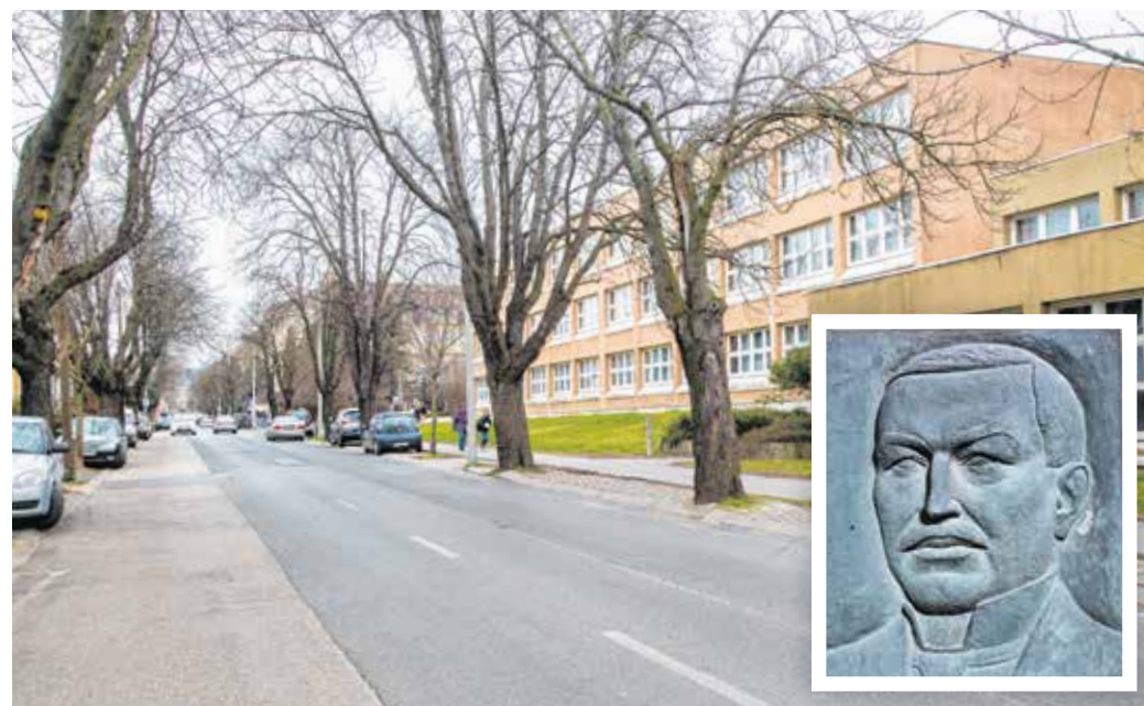
A Ferenczy János utcában óvoda, középiskola és egyetemi kar is megtalálható.

Sopron iskolaváros címéhez ez az utca nagyban hozzájárult. A Gárdonyi-iskola helyén volt az irgalmas nő-