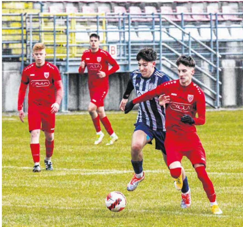
A hétvégi hazai mérkőzésen 9-0-ra kiütötte a Ménfőcsanakot az SC Sopron.

A bajnoki cím inkább már csak matematikailag elérhető a piros-fehérek számára, ezért az a cél, hogy megszerezzék a második, rosszabb esetben a harmadik pozíciót. A jelenlegi bajnoki kiírástól ugyanis változott a szabály, amennyiben a bajnok nem kíván élni az osztályozó lehetőségével, akkor az MLSZ felkéri erre a második, legfeljebb a harmadik helyezettet. Ahogy futballberkekben hallani lehet, a Koroncó nem akar feljebb lépni, így az SC Sopron