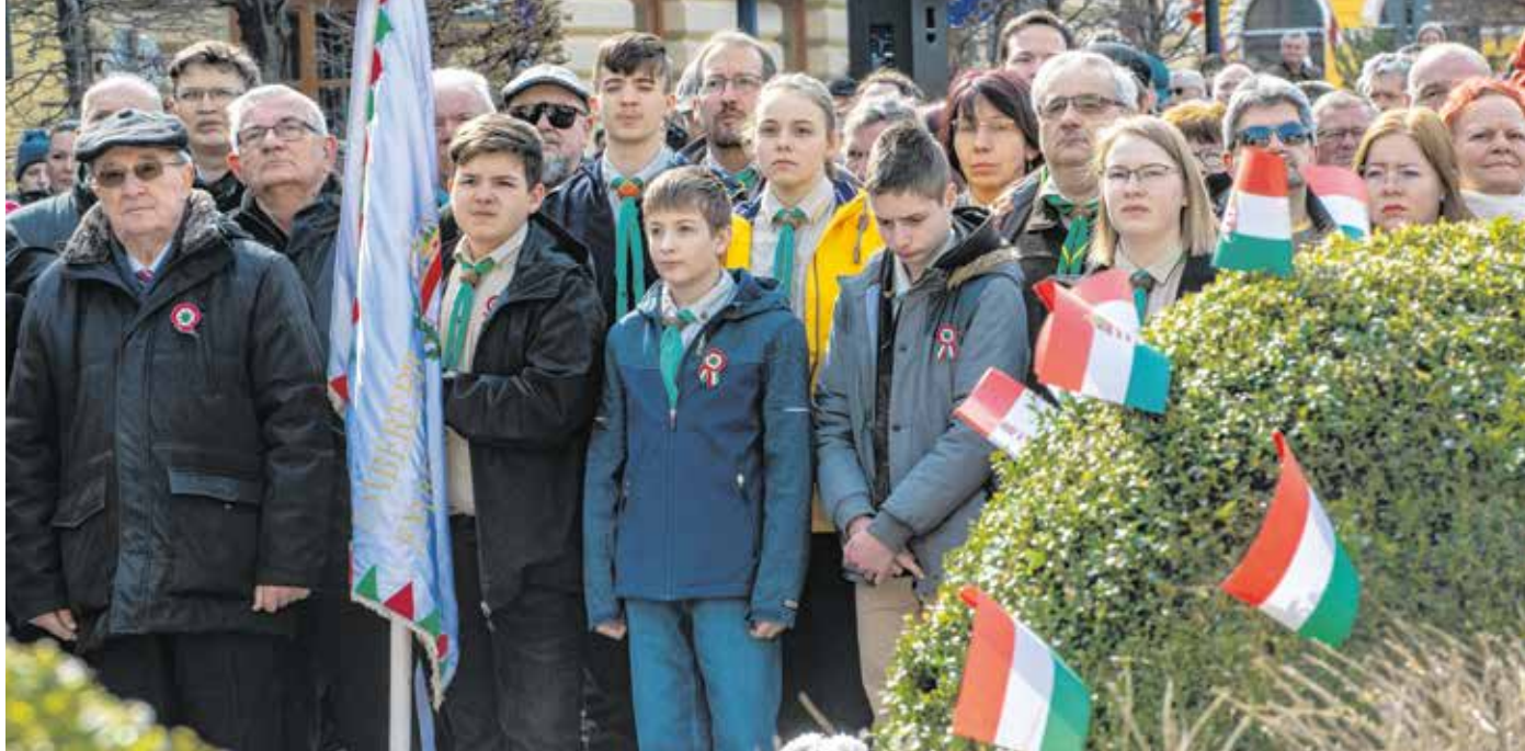
A soproniak a hagyományoknak megfelelően a Petőfi téren idézték fel az 1848-as dicsőséges napokat.