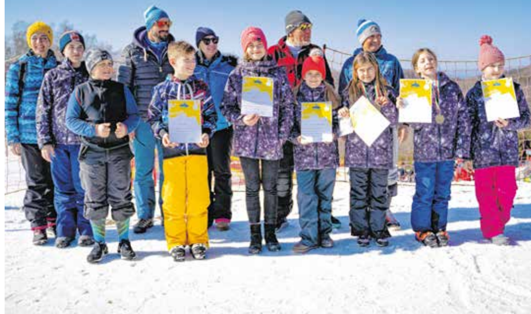
A Scoop Sport Egyesület soproni versenyzői az idei alpesi sí diákolimpián.