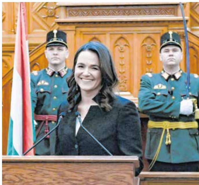
Novák Katalin megválasztott köztársasági elnök esküteletkor az Országgyűlés plenáris ülésén március 10-én.