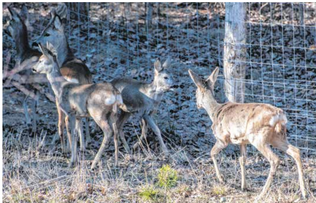
Az Erdő Házában jelenleg nyolc őz él, két bak és hat suta.