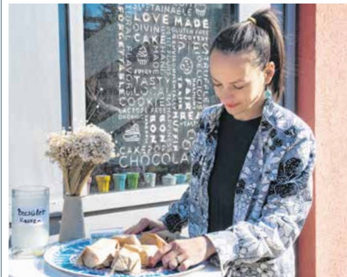
A Csíz Műhely is csatlakozott a kezdeményezéshez, az üzlet vezetője is fontosnak tartja az ételmentést.