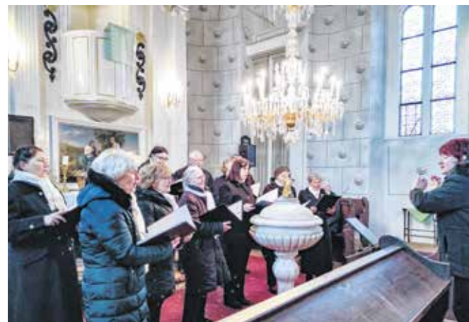
A próbák, a közös fellépések hihetetlen élményt, feltöltődést nyújtanak a Liszt Ferenc Pedagógus Énekkar tagjainak.

is. Számtalan alkalommal hódította meg a közönséget külföldön, így Ausztriában, Csehországban, Horvátországban, Németországban, Svájcban, Lengyelországban, Erdélyben, Olaszországban, Tunéziában és Görögországban is. Számos kiemelkedő hazai és nemzetközi eredménnyel büszkélkedhet. A zenekar személyi összetétele az alapítás óta sokszor változott, de a