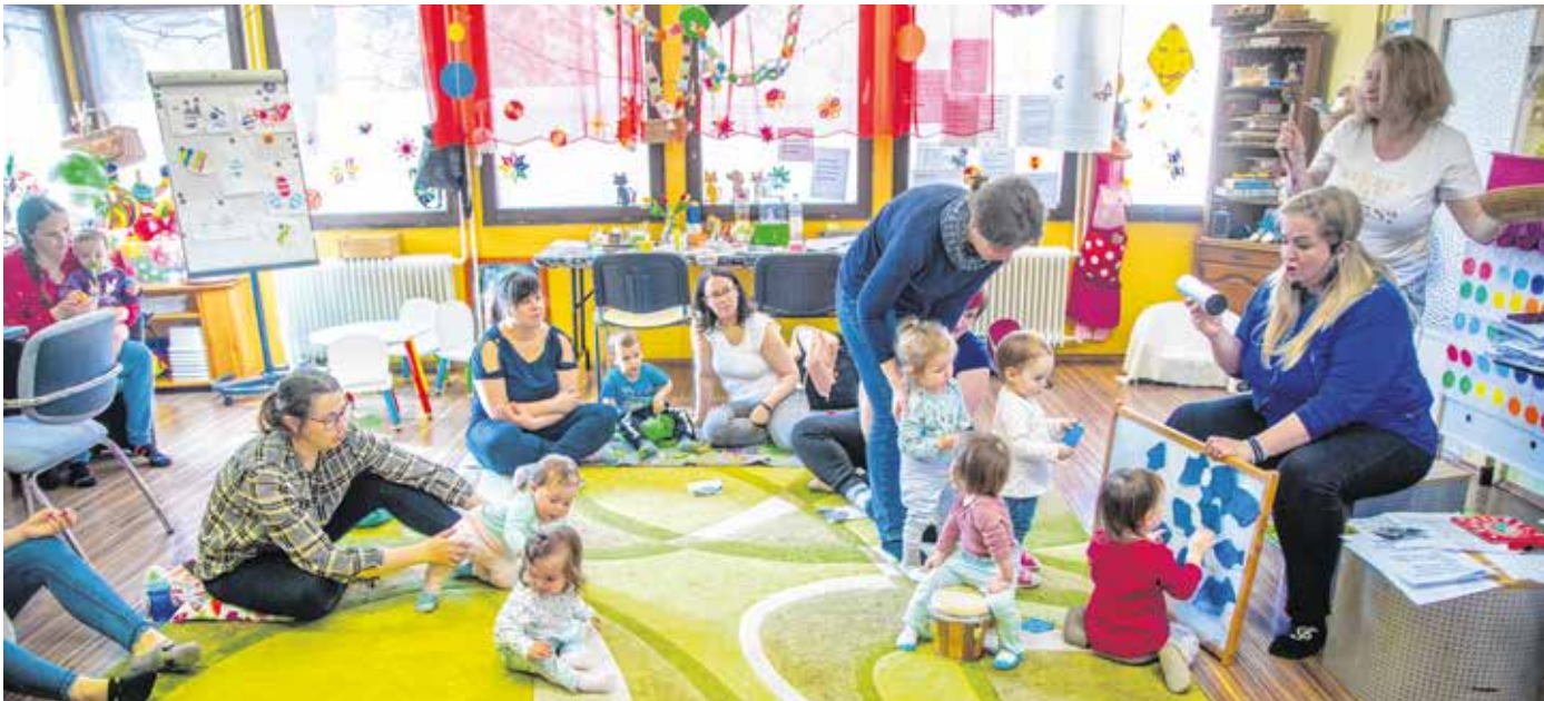
Az intézet szolgáltatásai között szerepel a zenés-mondókás Boróka Klub is, ami a jereváni kis házban működik.