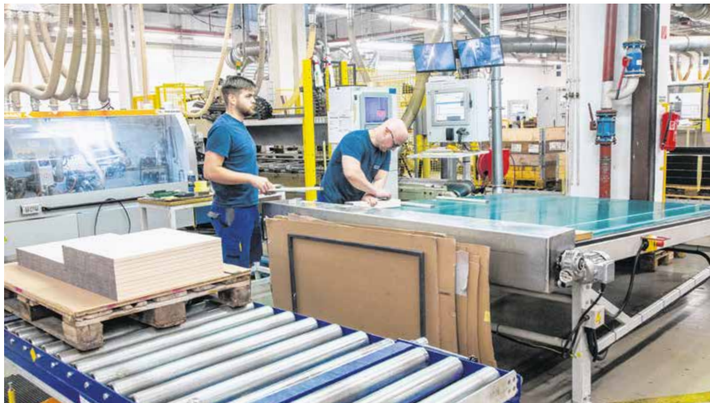
A soproni gyárban közel 600-an dolgoznak – az utóbbi öt évben szinte megduplázták a termelés mennyiségét.

2013-ban a cég neve IKEA Industry Magyarországra változott, azóta csak az anyavállalat által tervezett termékeket gyárt és szállít a világ minden részére (például Amerikába, Indiába, Kínába, Japánba vagy akár Ausztráliába). 2023 újabb mérföldkövet jelent: a tervek szerint nyáron új gyáregységgel bővül a keretüzem, és elindul a kasírozó üzletág. – Fontos, hogy a mai, hektikusan változó