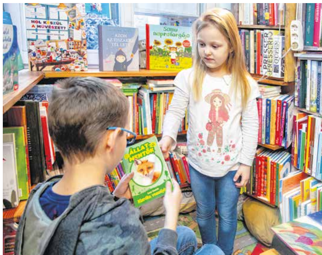
Más mese való a 3–4, a 8–9 évesnek és a kamaszodó gyerekeknek.

Délutáni szórakoztatásra rövidebb, gazdagon illusztrált könyvből meséljünk (ilyenkor ideálisak a műme-