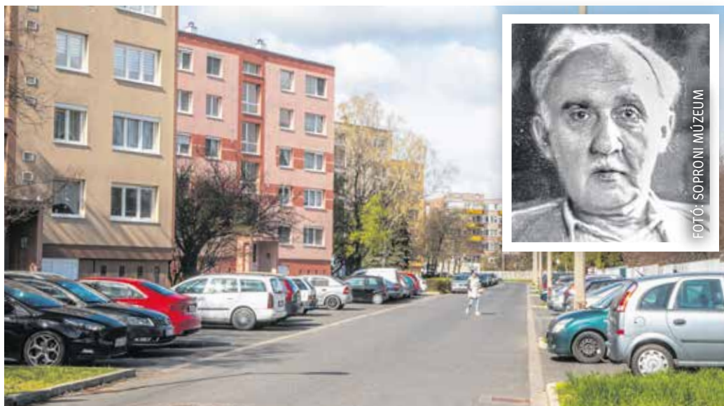
1991-ben kapta a Soproni Horváth József nevet az addigi Munkásör utca.

A második világháború után Sopron népessége folyamatosan gyarapodott: a dinamikusabb változás 1970 és 1980 között zajlott. Az ipari foglalkoztatottak száma nőtt, áramlott a falusi lakosság a városba, állandósult a lakáshiány. A három nagy lakótelep (Jereván-, Kőfaragó téri, József Attila-lakótelep)