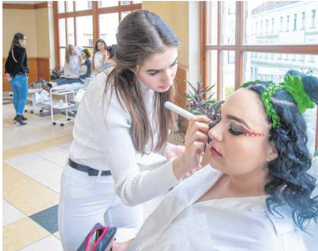
Idén a Petőfi-émlékév ihlette a Handler-divatgála szervezőit – a diákok a kétszáz évvel ezelőtti divatot gondolták újra, és öntötték frizurákba, sminkbe.