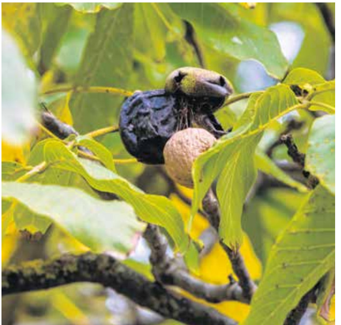
Fontos, hogy védekezünk a nyugati dióburok-fúrólégy ellen, így megelőzhetjük a termés feketedését.

Aki a biológiai megoldást választja, annak nem lesz könnyű dolga, viszont óvja a környezetét. A kártevő báb ellen egy talajgombával lehet védekezni, ami a dióburokfúrólégy-bábok számára kedvezőtlen körülményeket idéz elő, ezáltal a legyek kirepülését ellehetetleníti. A kezelést május elején célszerű elvégezni, szigorúan betartva a technológiai előírásokat. A módszer két év megfigyelési során jó eredményt hozott.