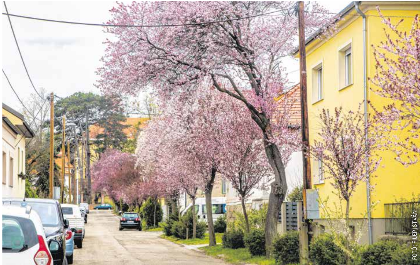
A fák egy része már virágba borult, tavasszal sok munkájuk van a kerttulajdonosoknak és a Sopron Holding Zrt. szakembereinek is.

A cég a téli útüzemet követően először három, majd négy seprűgéppel kezdte az utcák, terek, parkok, parkolók takarítását. A gépek mellett dolgoznak utcaseprők is, valamint ügynevezett mobil csapat is járja a várost. A terek, parkok, játszótérek folyamatos takarítása mellett a Jereván városrészben, a Wesselényi utcában, a Papréten és a Selmeci utcában is 1-1