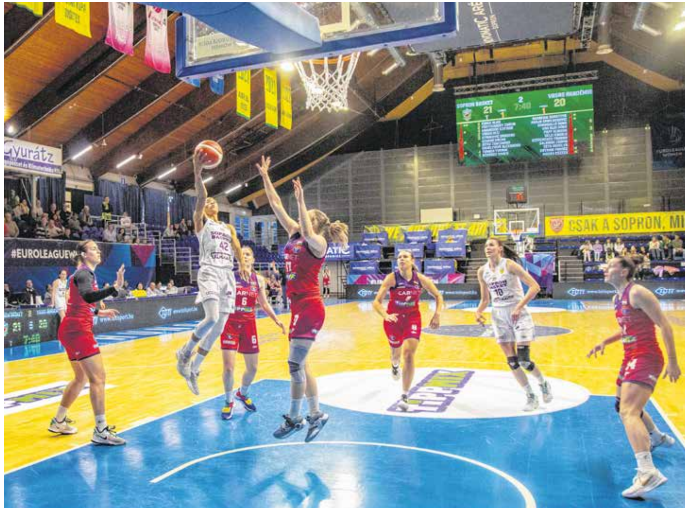
A Vasas ellen itthon és idegenben is nyert a Sopron Basket, ezzel bejutott a bajnokság negyedöntőjébe.

– Az alapszakaszban mindössze két vereségünk volt,