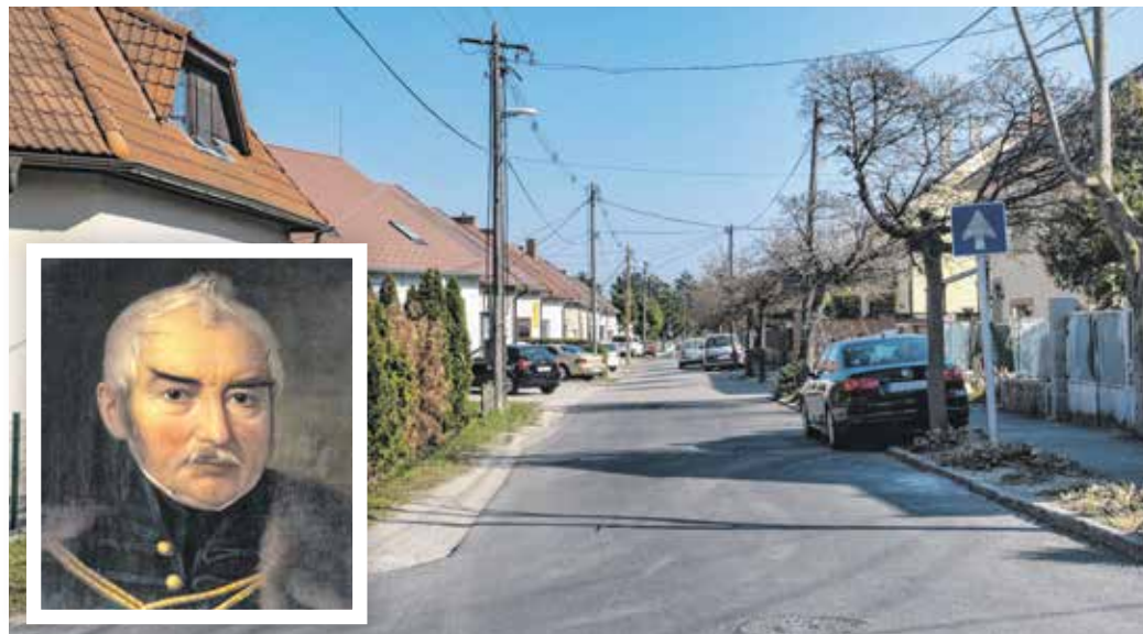
A Vas Gereben és a Felsőbüki Nagy Pál utca között található a Vághy Ferenc utca.

Sopron vármegye követeként részt vett az 1825–1827. évi és az 1832–1836. évi pozsonyi országgyűlésen. A Magyar Tudományos Akadémia elődje, a Magyar Tudós Társaság 1830-ban választotta igazgatósági tagjává. Munkatársával, a szintén soproni kötődésű Felsőbüki Nagy Pállal együtt voltak át küzdött a magyar nyelv politikai és közéleti elismeréséért.