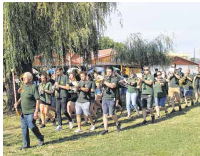
A Soproni Juventus Koncert Fúvószenekar áprilisi jubileumi koncertjére készül.

A járványügyi helyzet ellenére a kórus kitartott, a tagok lelkesen láttak munkához egy esztendővel ezelőtt.