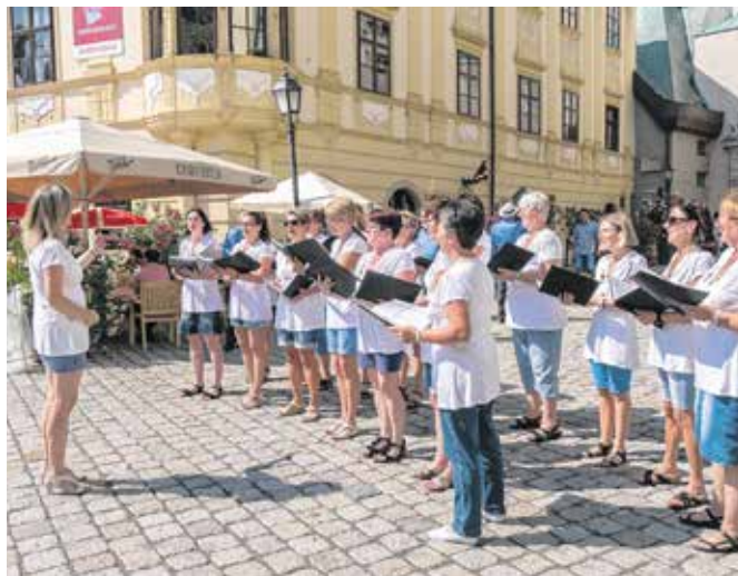
A Sonitus Scarbantiae Nőikar tagjai rendszeresen fellépnek városi eseményeken is.

A kórus 2014-ben vett részt először minősítésen, ahol a nemzetközi zsűri ezüstdiplomára értékelte teljesítményét, egy évvel később a IV. Keszthelyi Dalünnepen arany fokozatú, majd 2017-ben ugyanitt arany fokozat dícsérettel minősítést kapott. 2018-ban a Kodály Zoltán VIII. Magyar Kórusverseny újabb kihívást jelentett a