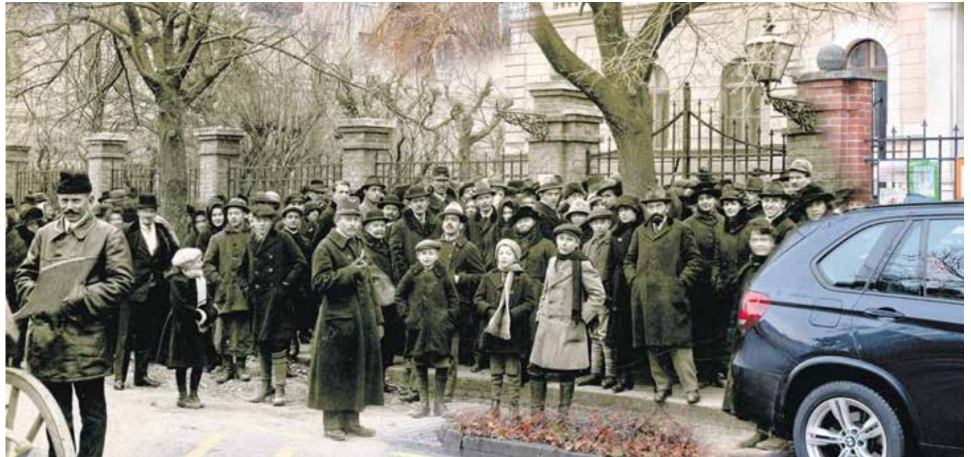
Szavazók a Deák téren, az akkori Állami Leánygimnázium épülete előtt 1921. december 14-én Schäffer Ármint felvételén – és ugyanaz az épület, kerítésén az óvodások és az alsósok népszavazásról készített rajzaival 2021. december 14-én Rombai Péter fotóján. A két képből Rombai Péter készítette a montázst.