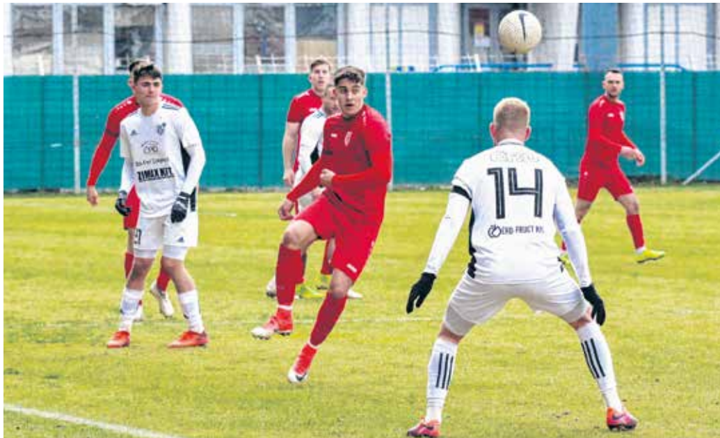
Az Érd ellen lépett pályára vasárnap az SC Sopron – ezúttal sem sikerült a bravúr a csapatnak, 2-1-re kikapott Bücs Zsolt együttese.

Továbbra sem sikerült megtörni a negatív szériát, az elmúlt hétvégén az Érdi VSE győzött az SC Sopron otthonában. Sok sérülés és eltiltás is hátráltatja a csapatot, pozitívum viszont, hogy a klub utánpótláskorú játékosai egyre több játéklehetőséget kapnak.