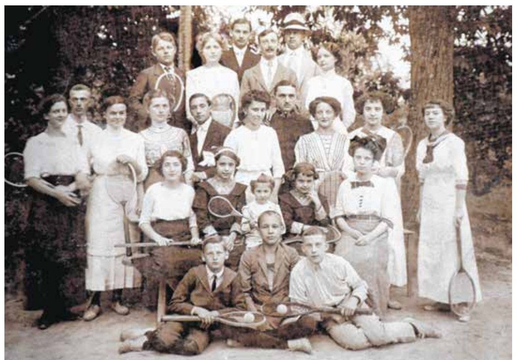
Valószínűleg az 1900-as évek elején készült a fénykép az Erzsébet-kertben, amelyen a soproni teniszélet egykori kiválóságait láthatjuk.