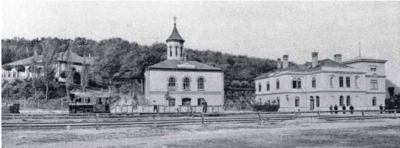
Brennbergbánya központja 1894 körül. Jobbra a bányagazgatóság irodaépülete, balra a későbbi templom látható.