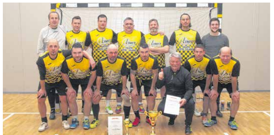
A Közti 2 csapata 2020 februárjában megnyerte a teremtorνάit.