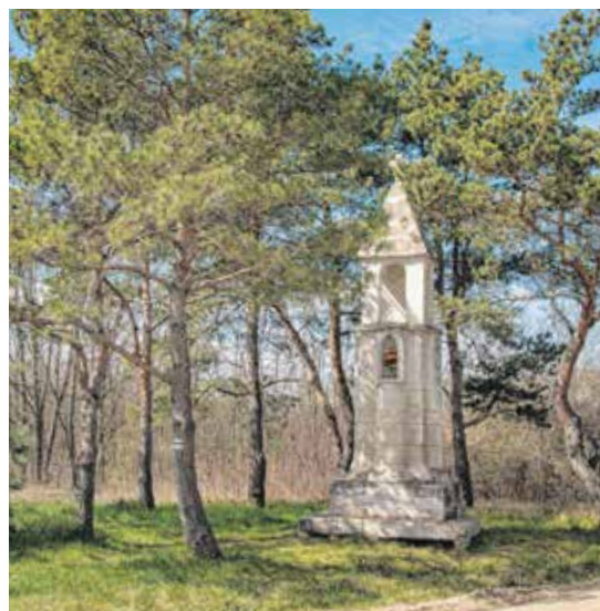
A Pihenőkeresztet ott állították, ahol a legenda szerint Szent Quirinus megpihent. A városrész a keresztől kapta a nevét.