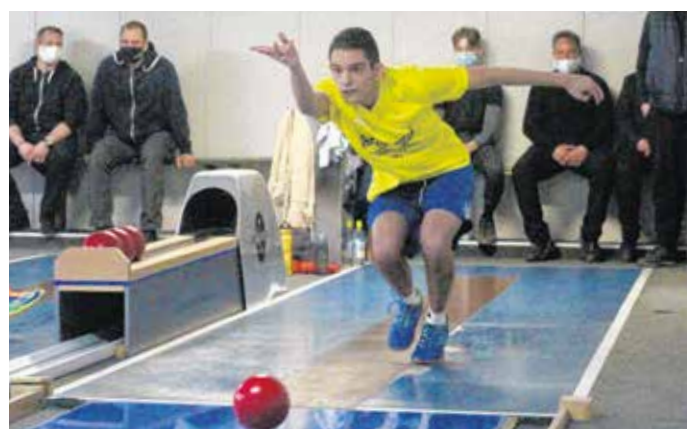
A Soproni Sörgurítók idén megfiatalított tekecsapattal versenyez.

– Az idei év szép meglepetése, hogy a Sörgurítók ifjúsági csapata kiválóan szerepel, tizenöt forduló után vezeti a tabellát – tette hozzá Weinacht János. – Pedig előfordul, hogy az említett játékosok a felnőtt és az ifjúsági találkozókon is szerepelnek egy-egy fordulóban. Fontos visszajelzés ez számunkra, hiszen azt mutatja, hogy az utánpótlás-nevelés rendszerben van az egyesületünknek.