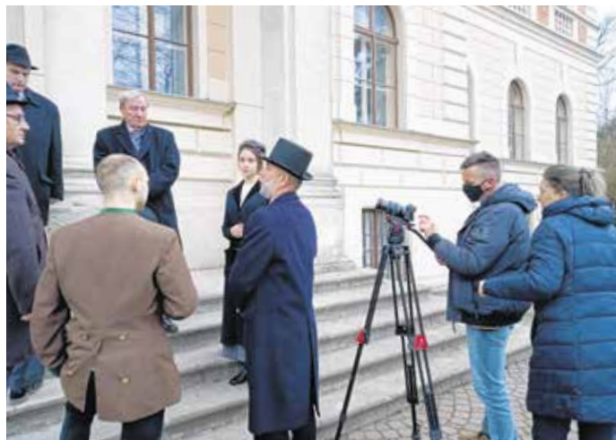
A harmadik közösségi vers április 11-től látható.