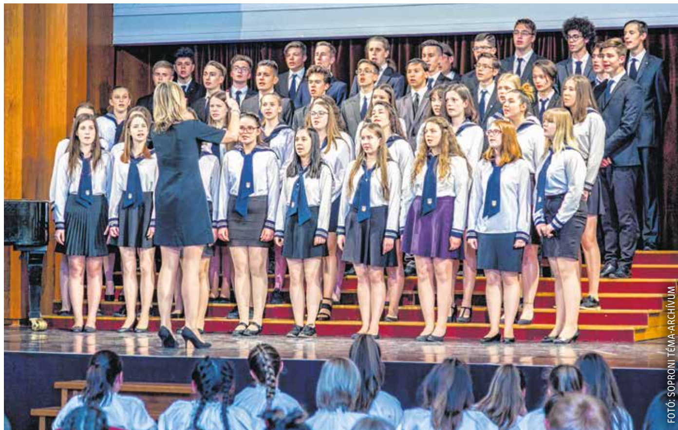
Sopronban több évtizedes hagyománya van az Éneklő Ifjúság kórushangversenyének.

A KÓTA, azaz a Magyar Kórusok, Zenekarok és Népzenei Együttesek Szövetsége által szervezett zenepedagógiai konferencián a látogatók előadásokon, bemutató órákon, próbákon vehetnek részt, kóruskoncerteket hallgathatnak meg, közben megismerkedhetnek az ének-zene-oktatás, valamint az ifjúsági kórusmunka hagyományos vagy épp innovatív módszereivel, és kicserélhetik tapasztalataikat is. A Horváth József Alapfokú Művészeti Iskola is fontosnak tartja a kezdeményezést, ezért is ad otthont a konferenciának. A szervezőknek az is nagyon fontos, hogy nyissanak a zeneszerető