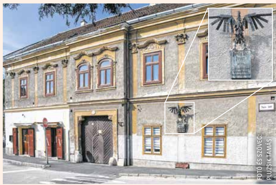
FOTÓ ÉS SZÖVEG: PLUZSIK TAMÁS