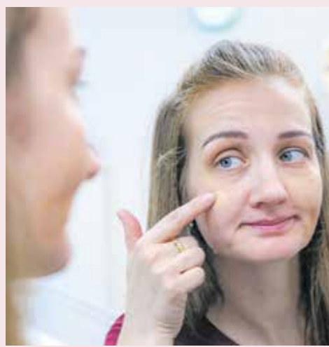
Mindig alaposan dolgozzuk el az ön barnító krémeket!

– A használat előtt érdemes egy alapos testradírozással megszabadulnunk az elszarusodott hámsejtektől – folytatta a szakember. – A krémet először a legvilágosabb testrészeinken osszassuk el, és csak a művelet végén krémezünk be az arcunkat, a nyakunkat és a kezünket! A készítményt alaposan dolgozzuk el, mivel a ráncokban megülő foltokat hagyhat maga után. Ha túl vastagon visszük fel, akkor sárgás árnyalatot kaphat a bőrünk. Ha megtanulunk bánni az ön barnítókkal, egyenletesen barna bőrszínünk lehet viszonylag rövid idő alatt.