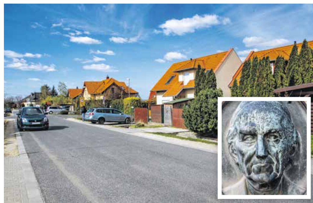
A Fényi Gyula utca az Ágfalvi úttól vezet egészen a Rozsondai Károly utcáig.

Mai lakói talán nem is sejtik, hogy a szomszédjukban