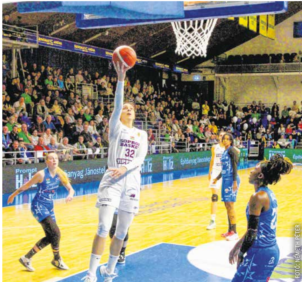
Koncentráltan játszott a bajnoki elődöntőben a Sopron Basket, mind a két meccsen 25 ponttal győzött a Szekszárd ellen a csapat.

Hétfőn délután rendezték a második mérkőzést Szekszárdon. A hazai csapat azonban ezt az összecsapást sem tudta izgalmassá tenni, a tolnaiak mindössze 42 pontot dobtak a meccsen, amelyen végül ismét pontosan 25 ponttal győzött a Sopron Basket, így pedig a bajnoki döntőbe került.