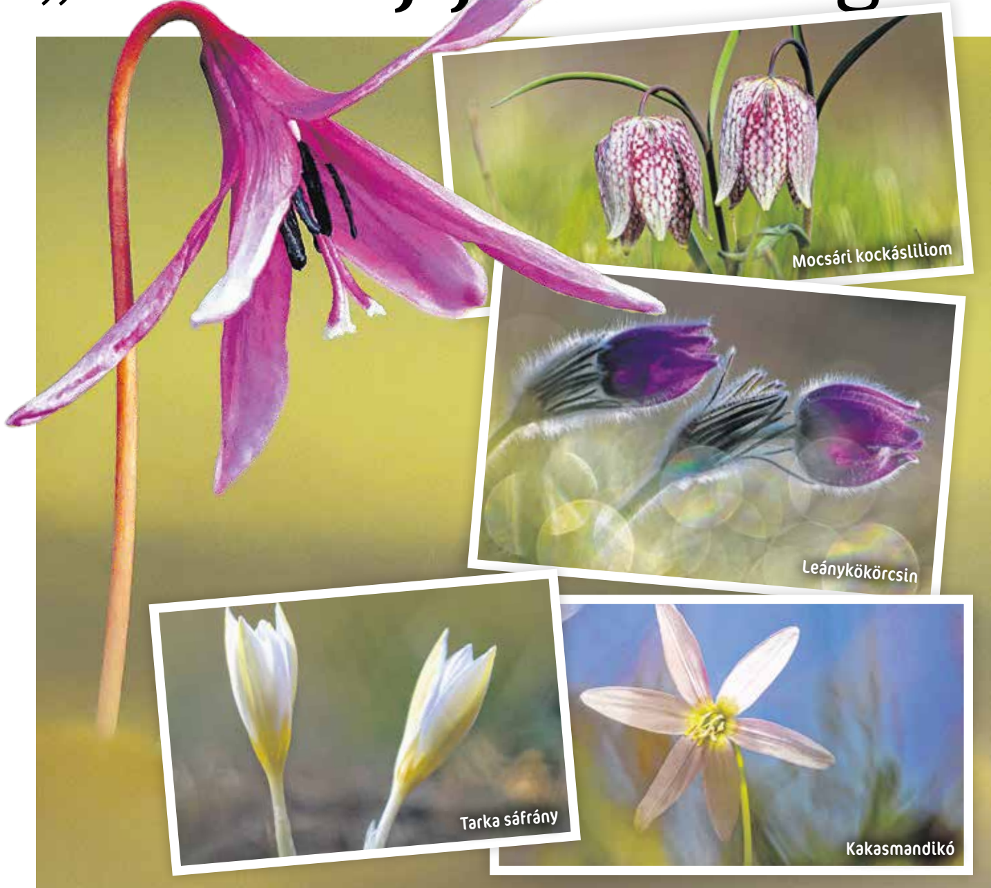
A kakasmandikó virága bókol – hívják még Szent György virágának, illetve kutyafogyókérnek is a növényt.