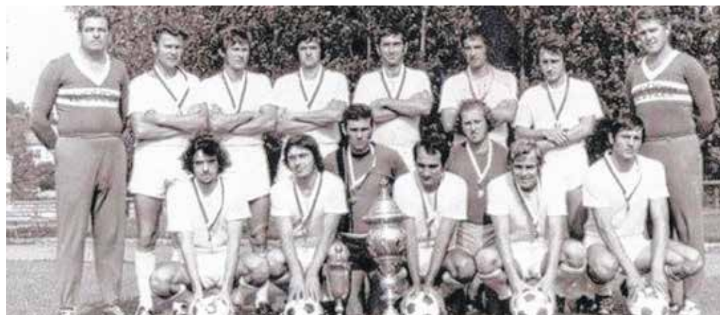
A Soproni Textiles bajnokcsapata az 1971–72-es szezonban.

Az NB III-ban 1972-ben az SVSE szerezte meg az ezüstérmet, így a következő idényben jöttek a Vasút-Textil-slágermérkőzések. Az osztályban újonc kék-fehéreknek annyira jól ment a játék, hogy hatalmas csatában megelőzték az újra ezüstérmes lilákat, és egy évvel később is bajnoki címet ünnepelhetek. Ezzel feljutottak az NB II-be – egy év alatt két szintet ugrottak.