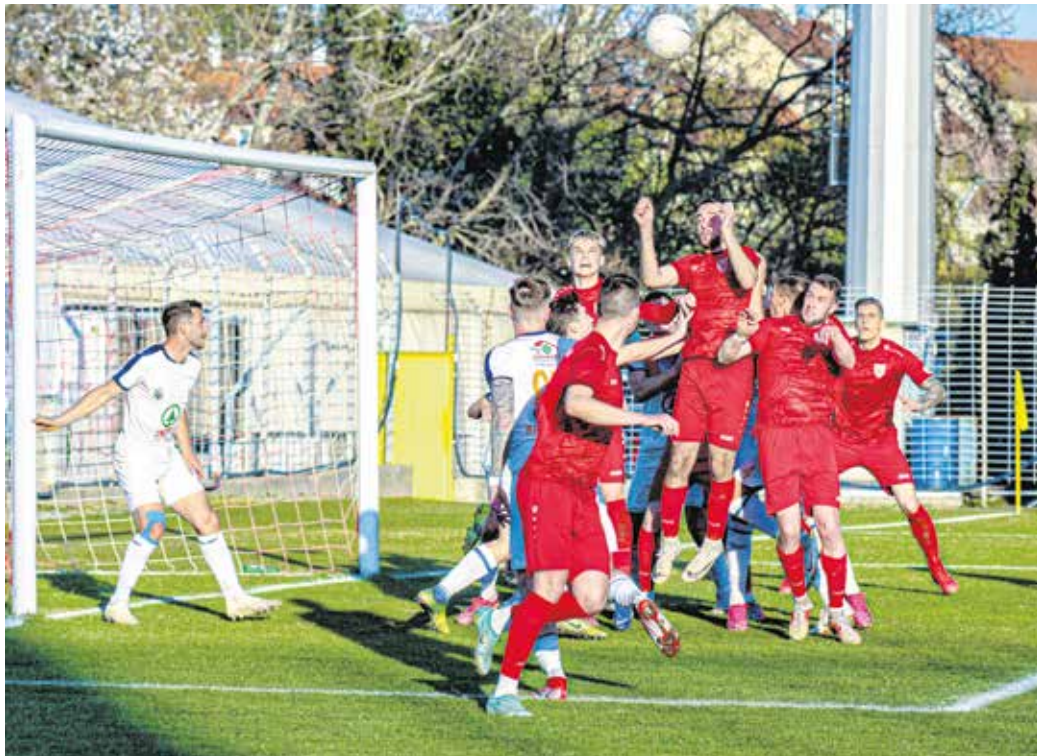
A Bicske elleni hazai mérkőzésen elmaradt az SC Sopron teljesítménye az előzetes várakozásoktól – 2-0 arányban kapott ki a csapat.