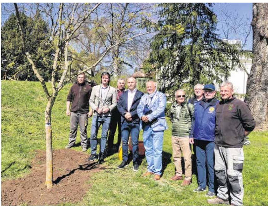
A Lions Club Sopron tagjai egy tatár juhart ültettek el a Lenck-villa parkjában.