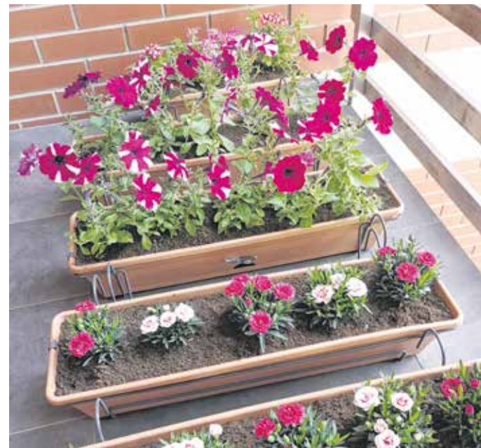
A balkonládák aljára érdemes keskeny vízelvezető réteget helyezni – javasolta a szakember. FOTÓILLUSZTRÁCIÓ

– Az olcsóbb balkonládák általában műanyagból készültek, több szempontból is jobban megfelelnek azonban a célnak a mázas kerámia