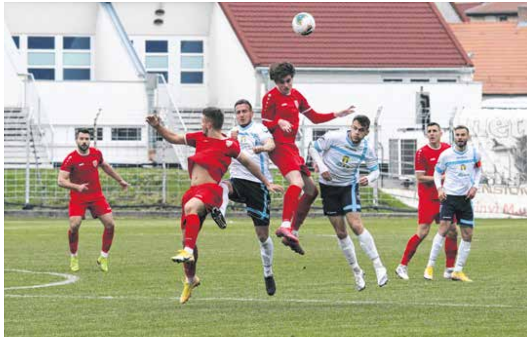
A BKV Előre elleni hazai mérkőzésen 1-1-es döntetlent ért el az SC Sopron.