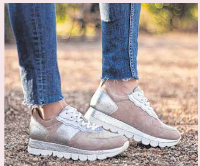
A nők most a laposabb sarkú, sportosabb cipőket részesítik előnyben, amelyek nadrággal és szoknyával is jól mutatnak. FOTÓILLUSZTRÁCIÓ