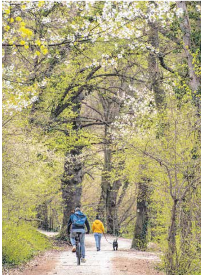
A Föld napja idén is ráirányítja a figyelmet az erdők védelmére.