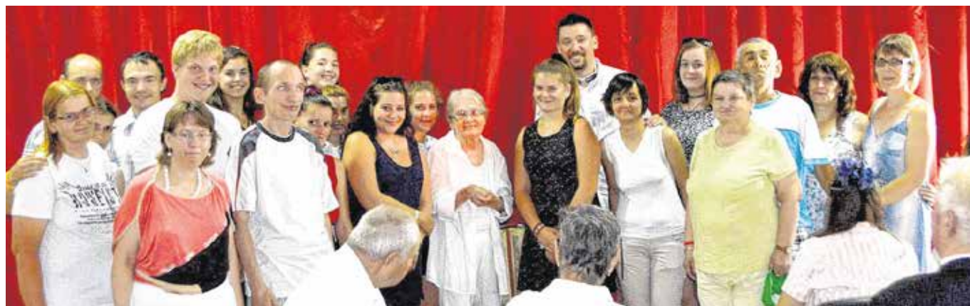
Törőcsik Mari 2015-ben a soproni DESZKa Társulat tagjaival és a zsirai fogyatékos otthon lakóival.

Támogatta az amatőr színjátszást, a soproni DESZKa Társulat több darabjának is ő volt a fővédője, a Valahol Európában soproni bemutatója előtt telefonon köszöntötte a nézőket és az alkotókat.