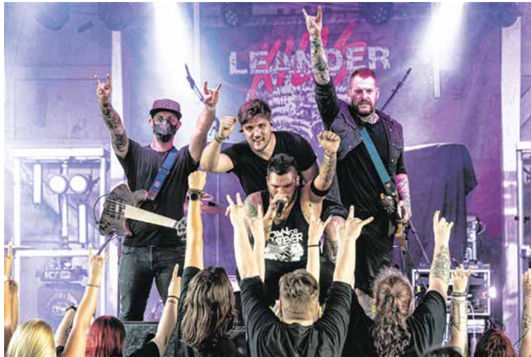
A Plasticocene tagjai bíznak abban, hogy minél hamarabb találkozhatnak a rajongóikkal.

A srácok elárultak, hogy egy közeli, kedves jó barátjuk is megfertőződött a vírussal, és intenzív osztályra került, ahol különböző gépek és az egészségügyi személyzet küzdött napról napra az életéért. Geo, az énekes emiatt döntött