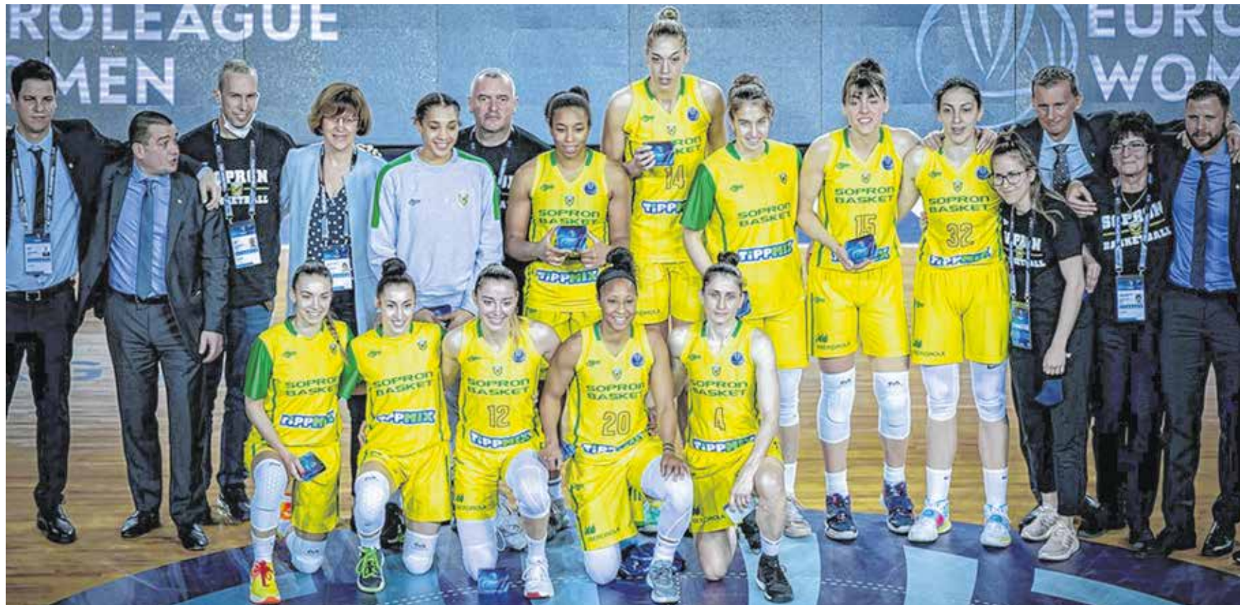
A Sopron Basket negyedszer jutott be az Euroliga Final Fourba, ezúttal két küzdelmes mérkőzés után a negyedik helyet szerezte meg.

A vereség után következhetett a bronzmeccs, méghozzá a hazai pályán szereplő Fenerbahce ellen. Az utolsó pillanatban hozott szabálymódosítás miatt – mégis beengedtek hazai szurkolókat – valóban otthon érezhette magát a török sztár csapat. Ráadásul az Euroliga legjobb védőjének választott Gaby Williams nem