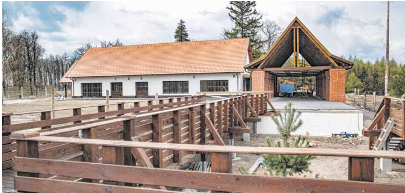
Gőzerővel készül az Erdő Háza Ökoturisztikai Látogatóközpont, ahol egy interaktív oktatóterem is helyet kap.