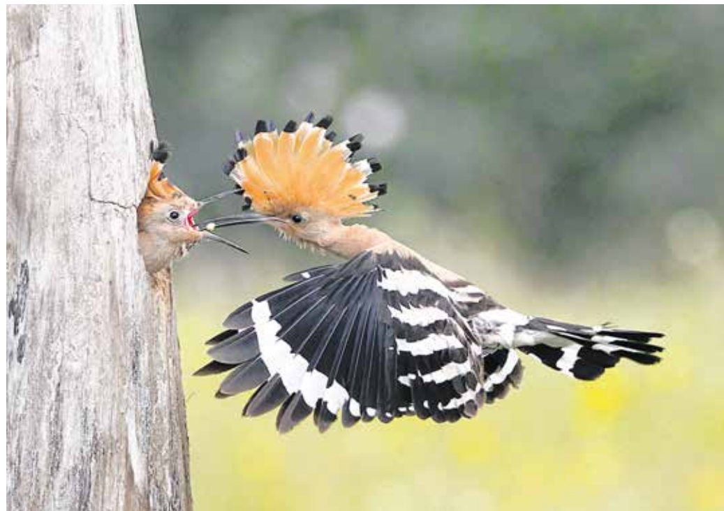
Kránitz Roland, a Soproni Fotóklub tagja Pontos találat című képével több nemzetközi pályázat is díjat nyert.

A fotóklub évente két pályázatot szervez tagjainak. Az egyik a fotófutam, amelyet egy évben öt alkalommal, öt különböző témában