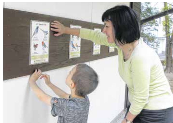
A Lewinszky Anna Gyakorló Óvoda idén pályázik az Örökös Zöld Óvoda címre.