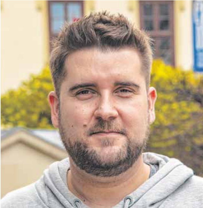
Savanyu Gergely színművész