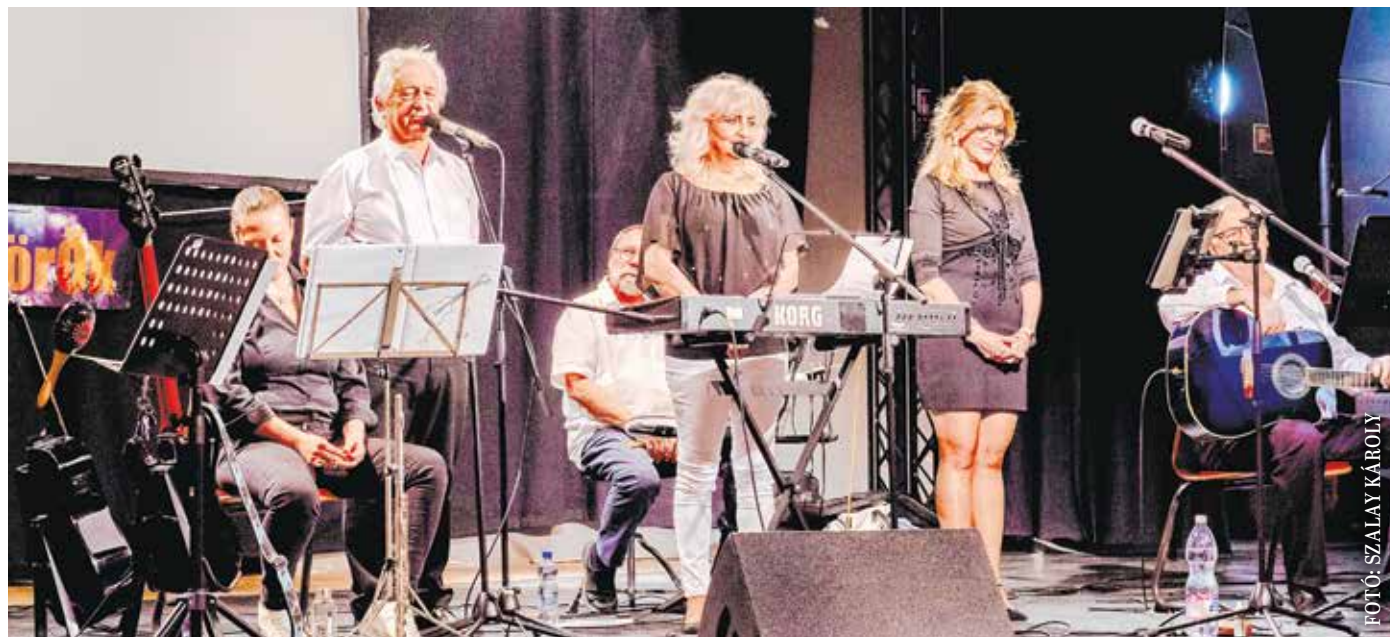
Valami csoda volt a levegőben abban a két órában – mesélték jótékonyági koncertjükéről a Csendtörők zenekar tagjai.