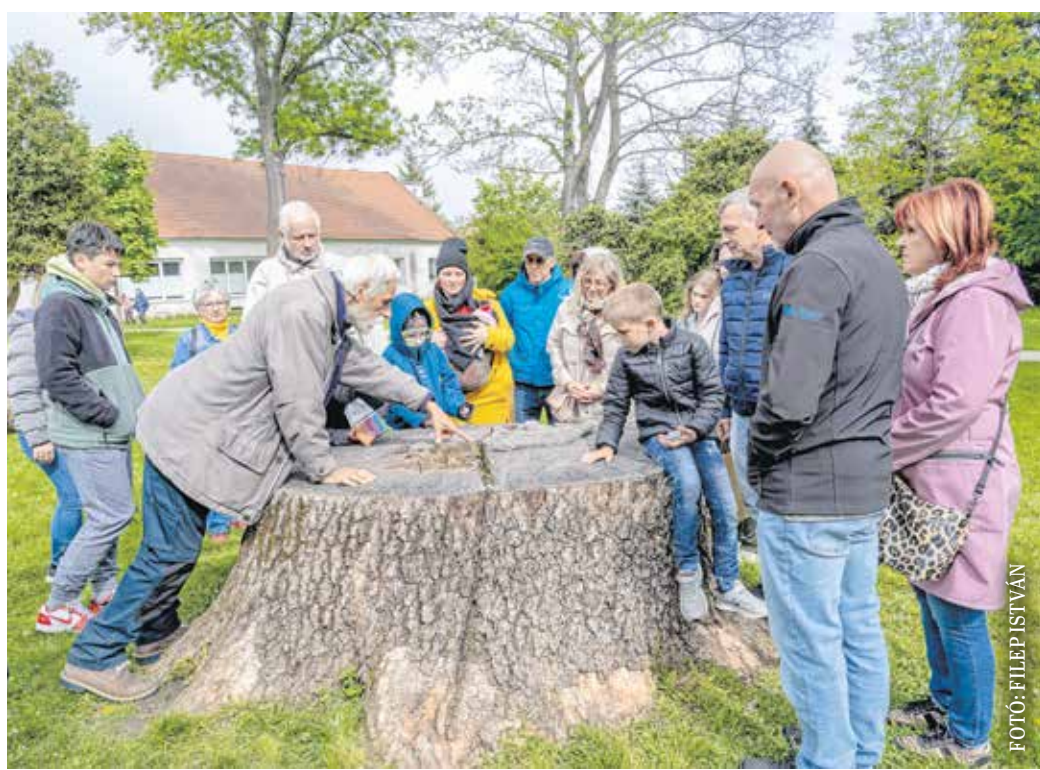
A program résztvevői megismerhették a Lenck-villa parkját és különleges növényeit.