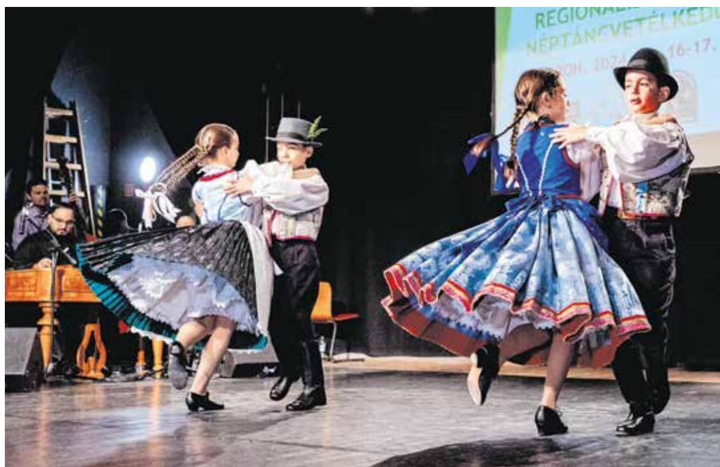
Közel háromszáz ifjú néptáncos lépett fel múlt héten a GYIK-ban.