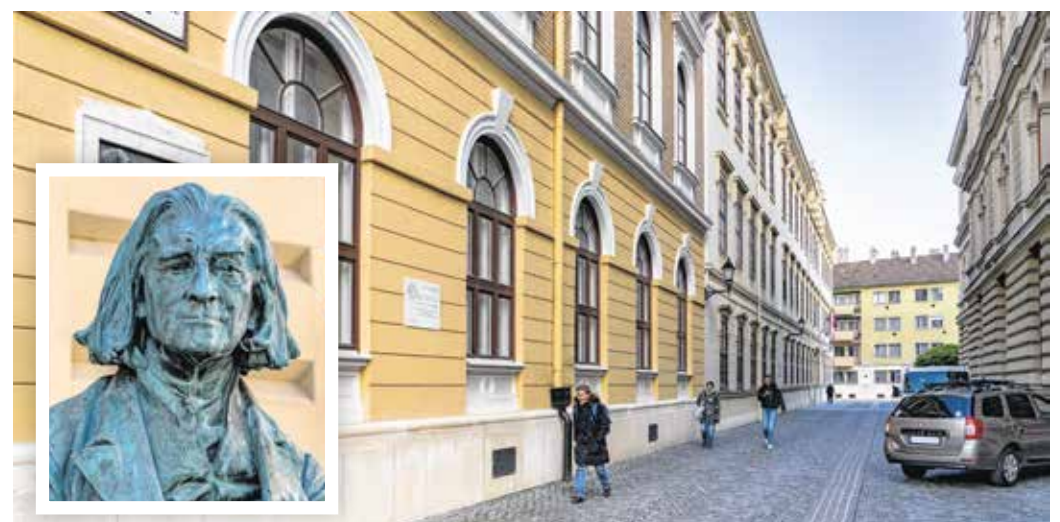
A Liszt Ferenc utcában volt a régi kaszinó – ahogy az emléktáblán is áll, itt adott 1820-ban (9 éves korában) koncertet Liszt Ferenc.

Az első kaszinó céljára épült kétemeletes ház az egykori Színház téren (ma Petőfi tér 3.) állt, ahol Liszt Ferenc többször is koncertet adott (először kilencévesen 1820-ban). Ugyanitt 1840-es felépésekor a zongorasoraiiban élvezte a zongoraművész előadását – civil ruhában – a