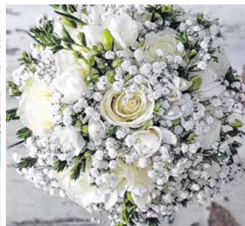
– Az utóbbi években rendkívül népszerűek a közepes méretű, vintage csokrok, melyekben a törtfehér és a púder színek dominálnak – mondta Zügn Judit virágüzlet-tulajdonos.