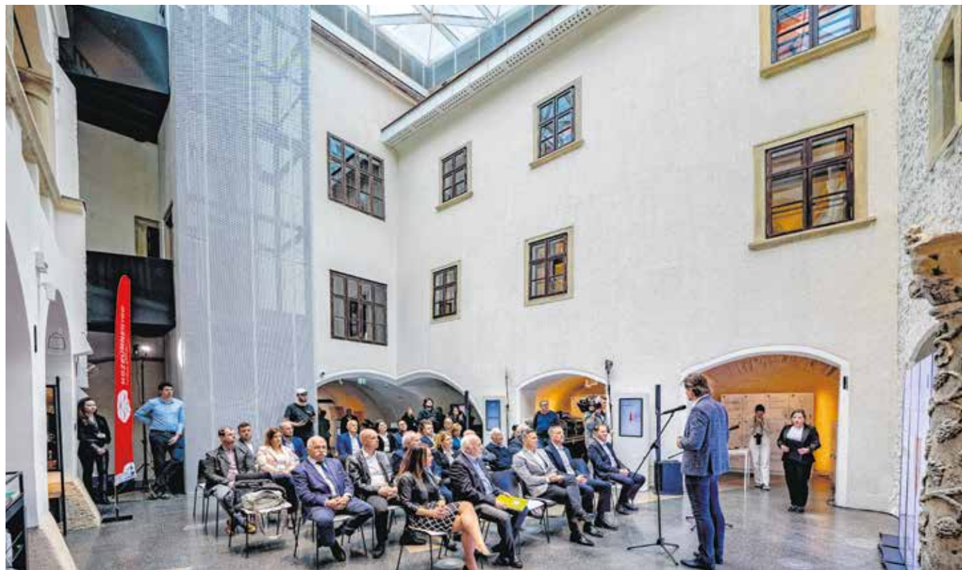
Az új múzeumtér nemcsak az építész szakma, de a soproniak és a hozzájuk látogató turisták tetszését is elnyerte – hangzott el az építőipari nívódíj emléktáblájának leleplezésekor.