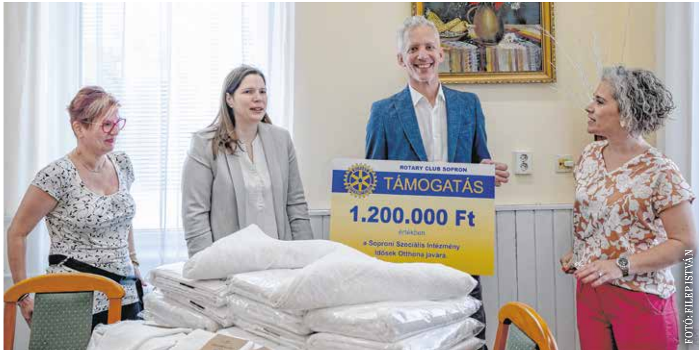
A bál bevételéből 350 törölközőt és 700 mosdókesztyűt is vásárolt a Rotary Club Sopron a Balfi úti Idősek Otthona lakóinak.