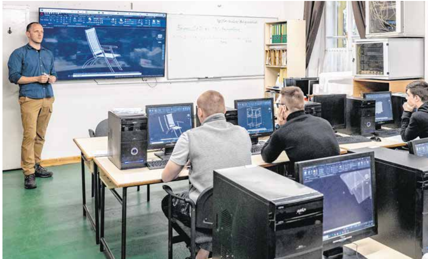
A Roth-technikumban a faiparos diákok modern tervezőprogramokkal, gépekkel dolgozhatnak.

Ehhez a Roth Gyula Technikum minden segítségét megad. Biztosítja a tervezőprogram hozzáférhetőségét, emellett modern gépeken ta-