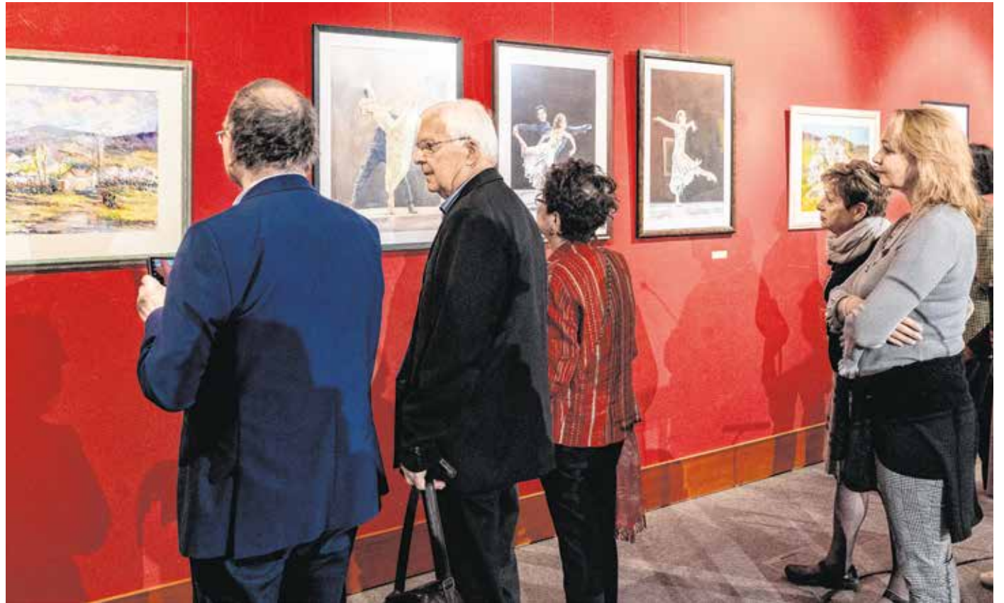
Az idei tavaszi tárlaton összesen 36 alkotó munkáit állították ki a Munkácsy teremben.