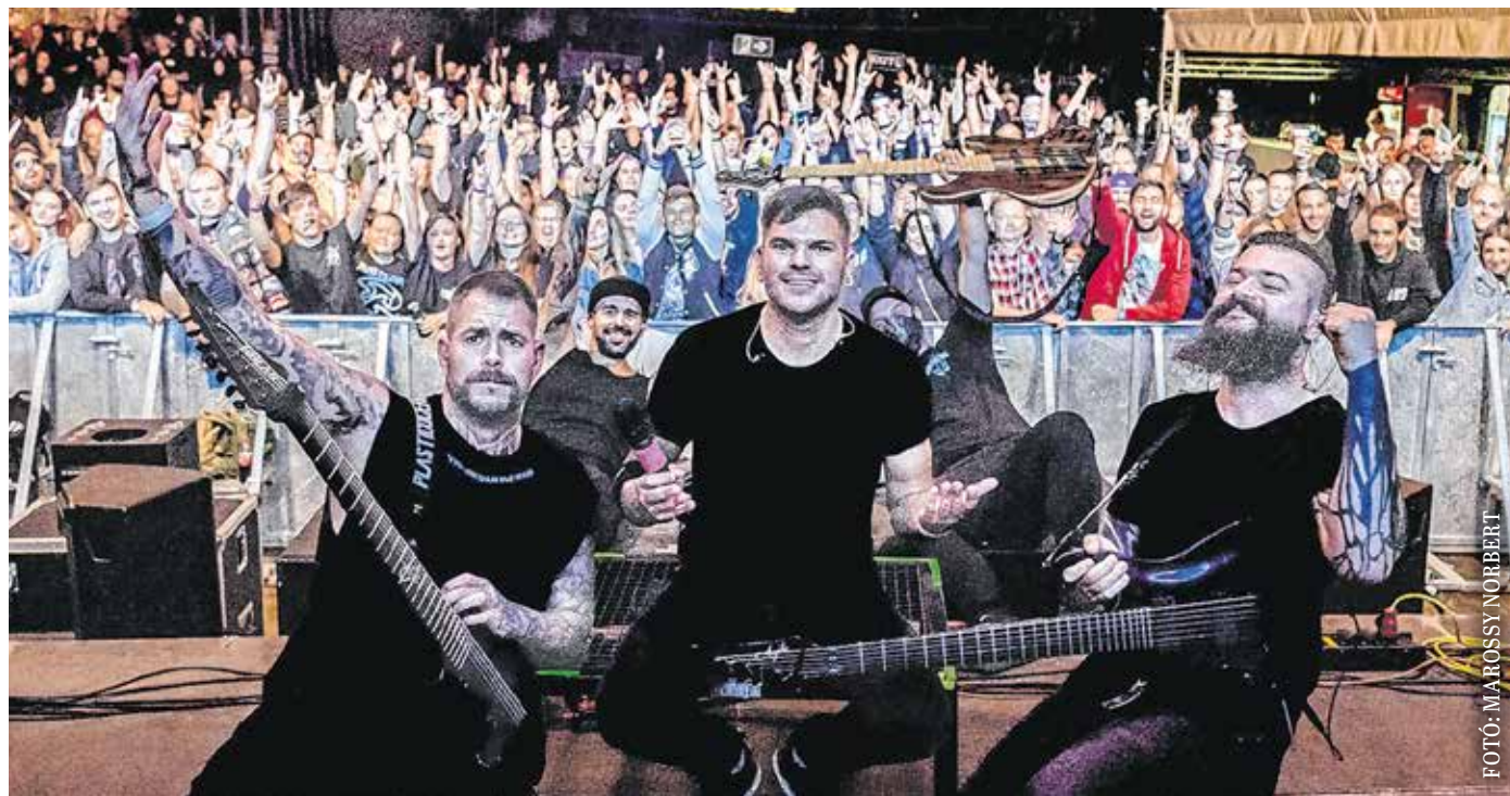
Sodródás címmel jelent meg a Plasticocean zenekar új kislemeze. A fellépéseken már erről is játszanak dalokat.

A soproni csapat szerint egyre többször lehet tapasztalni a világban, hogy a társadalmi kapcsolatok elveszítik a lelki mélységeiket. Sokan