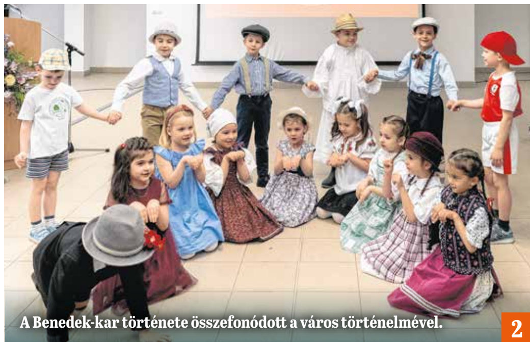
A Benedek-kar története összefonódott a város történelmével.