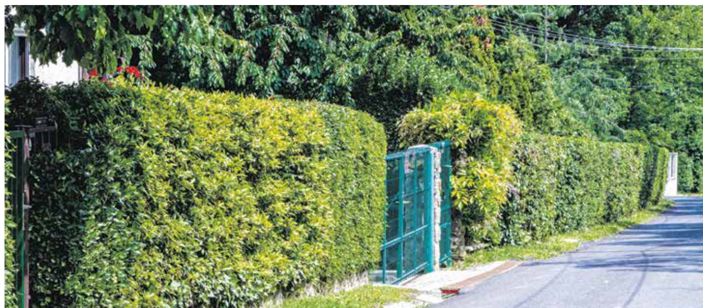
Ha a sövény homogén, akkor egy fertőzés könnyen továbbterjed benne. A szakemberek ezért azt javasolják, hogy aki teheti, mozaikos sövényt telepítsen.

A kiállítás az STKH weboldalon látható: stkh.hu/online-karikatura-kiallitas-2024