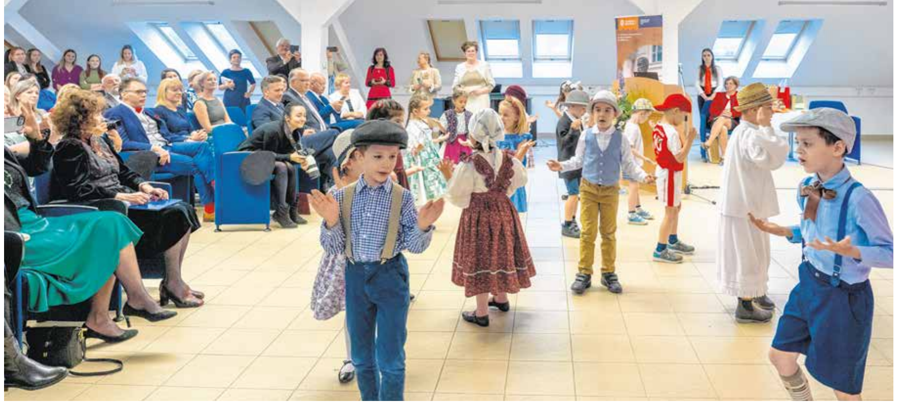
A jubileumi ünnepségen tavaszköszöntő műsort adtak a Lewinsky Anna Gyakorló Óvodába járó gyerekek.