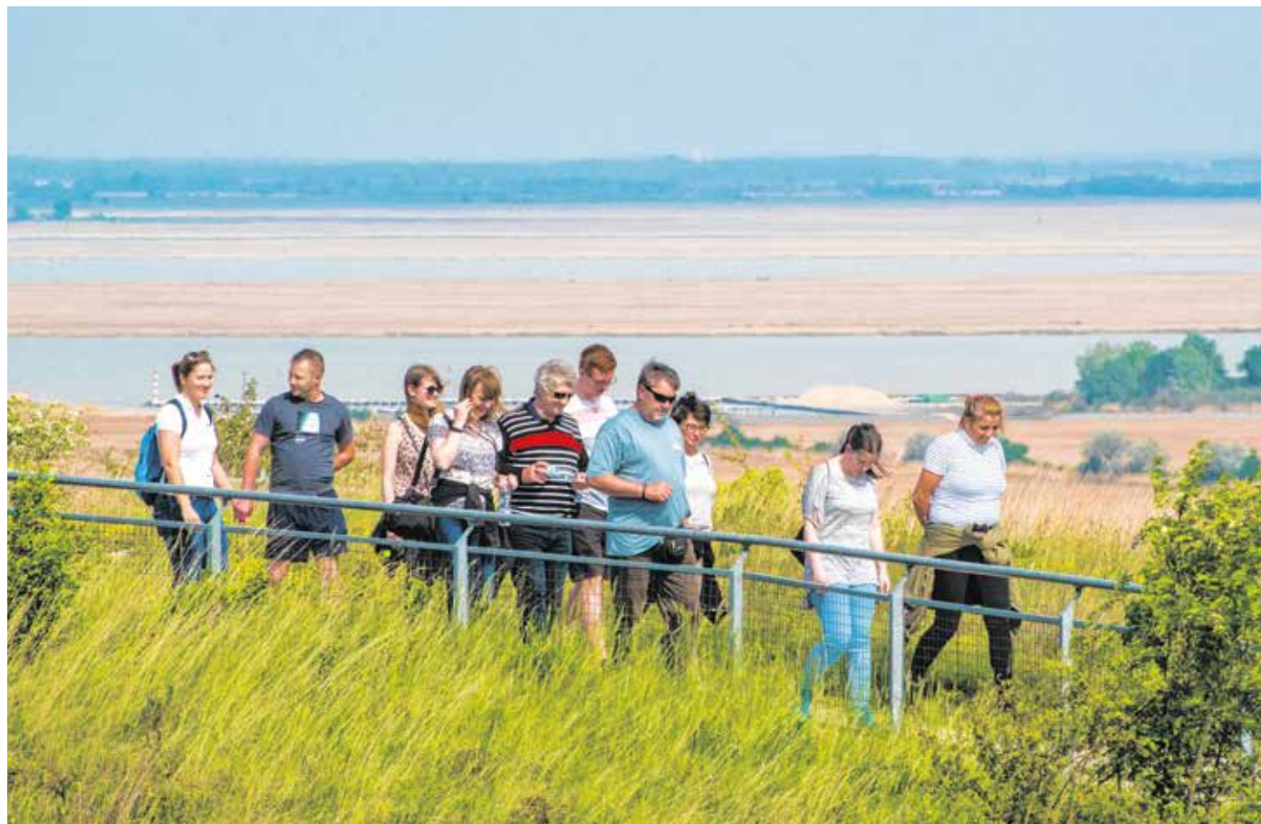
Turistacsoportok, osztálykirándulások résztvevői, biciklisek, családok – szinte minden korosztály körében népszerű a Fertőrákosi Kőfejtő és Barlangszínház. Hétfévégén is sokan bejárták a témaparkot.