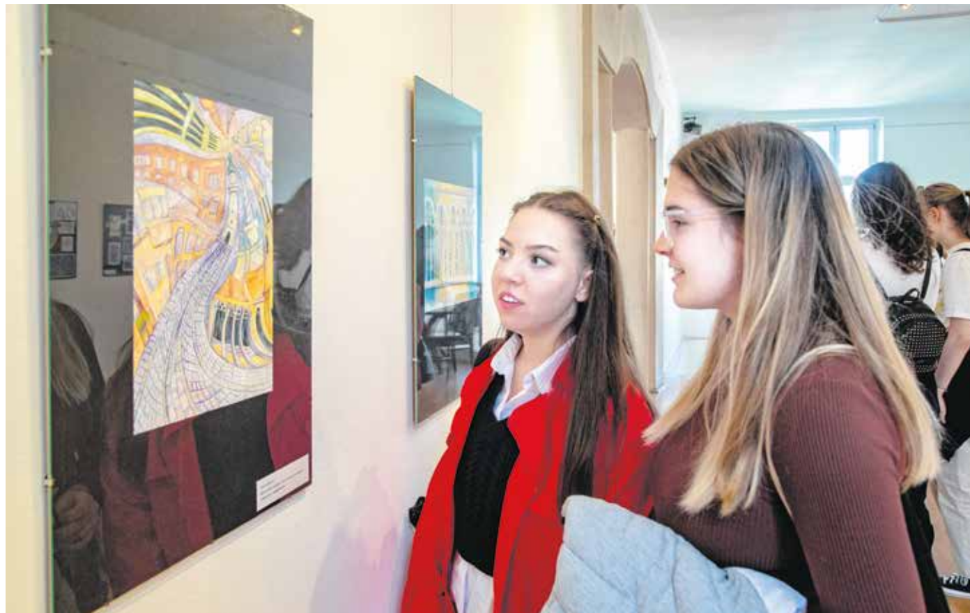
A licisták kiállításának célja, hogy elindítsa az értékteremtést, az értékteremtő közösségek egymás felé közeledését.