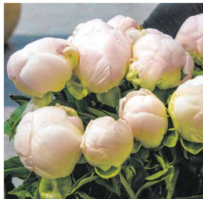
Vágott virágként is nagyon kedvelt a pünkösdi rózsája – gyakran díszít menyasszonyi csokrokat is.

A növénynek szinte minden talaj megfelel, de legjobban a semleges pH-jút kedveli. Az ültetésénél figyelembe kell venni, hogy óriási a helyigénye,