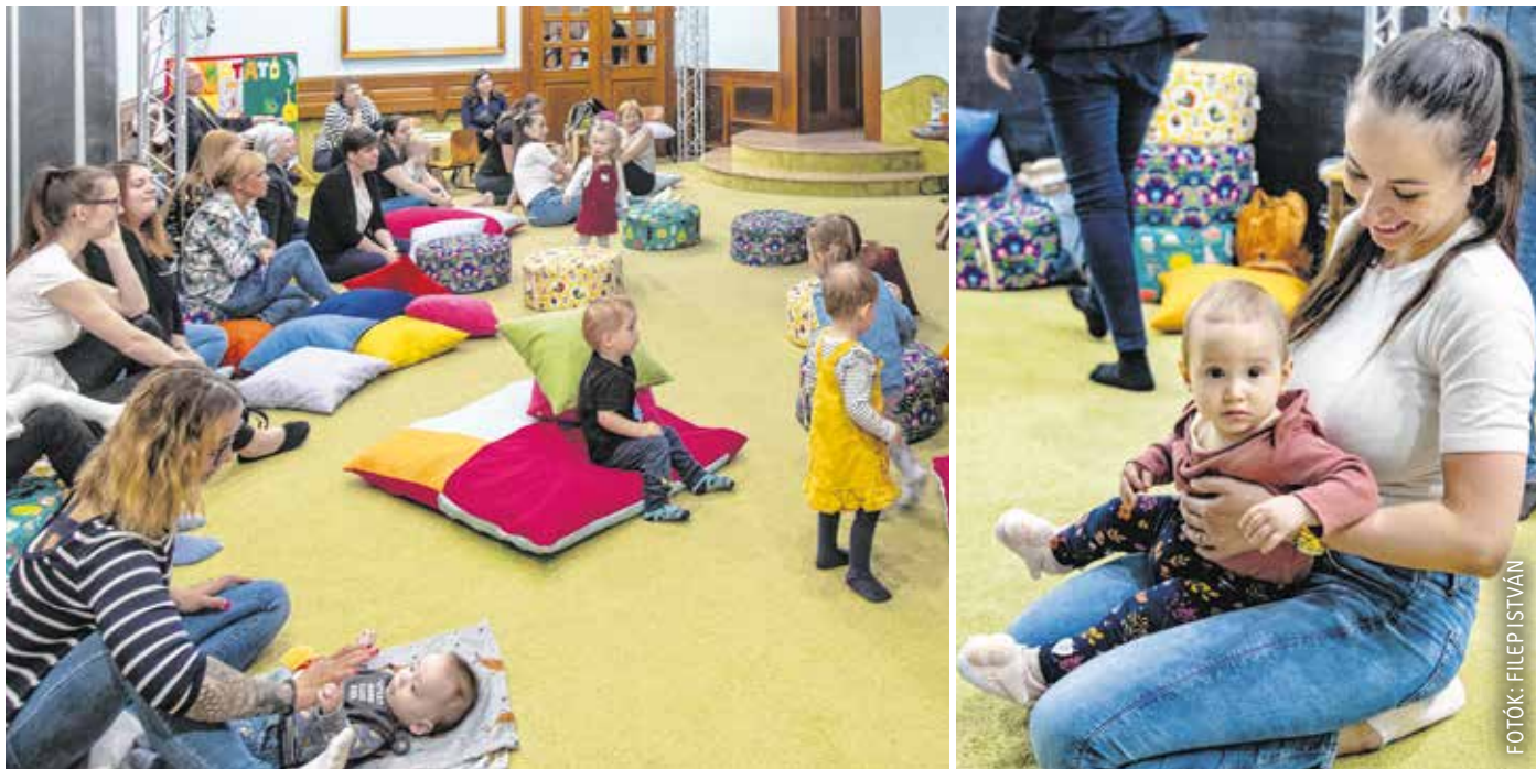
A baba-mama tornán az anyukák társaságban lehetnek és mozoghatnak, a kicsik pedig ismerkednek a világgal és egymással.