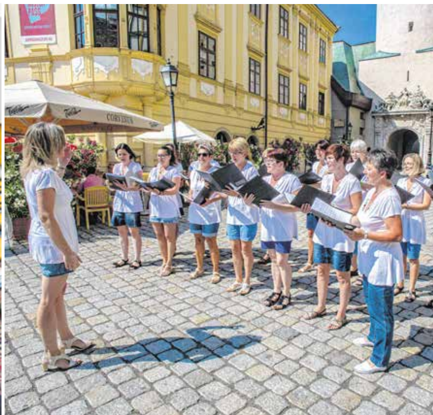
A tervek szerint idén július 10-én tartanák meg Sopronban a 3. kórusünnepet – a rendezvény korábban nagyon népszerű volt.