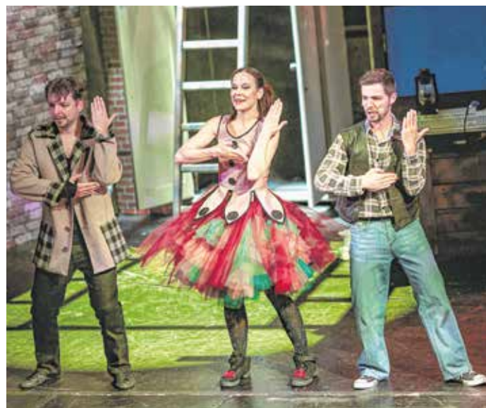
Pénteken a padlással (felvételünkön) folytatódik az évad a Soproni Petőfi Színházban.

A Római karnevál továbbra is szerepel a Soproni Petőfi Színház műsorán a kamara játszóhelyen. A nagyszínpadon május 21-én folytatódik az évad a padlás című produkcióval. A bérletes és jegyet váltó nézők előzetes regisztráció után tekinthetik meg az előadásokat.