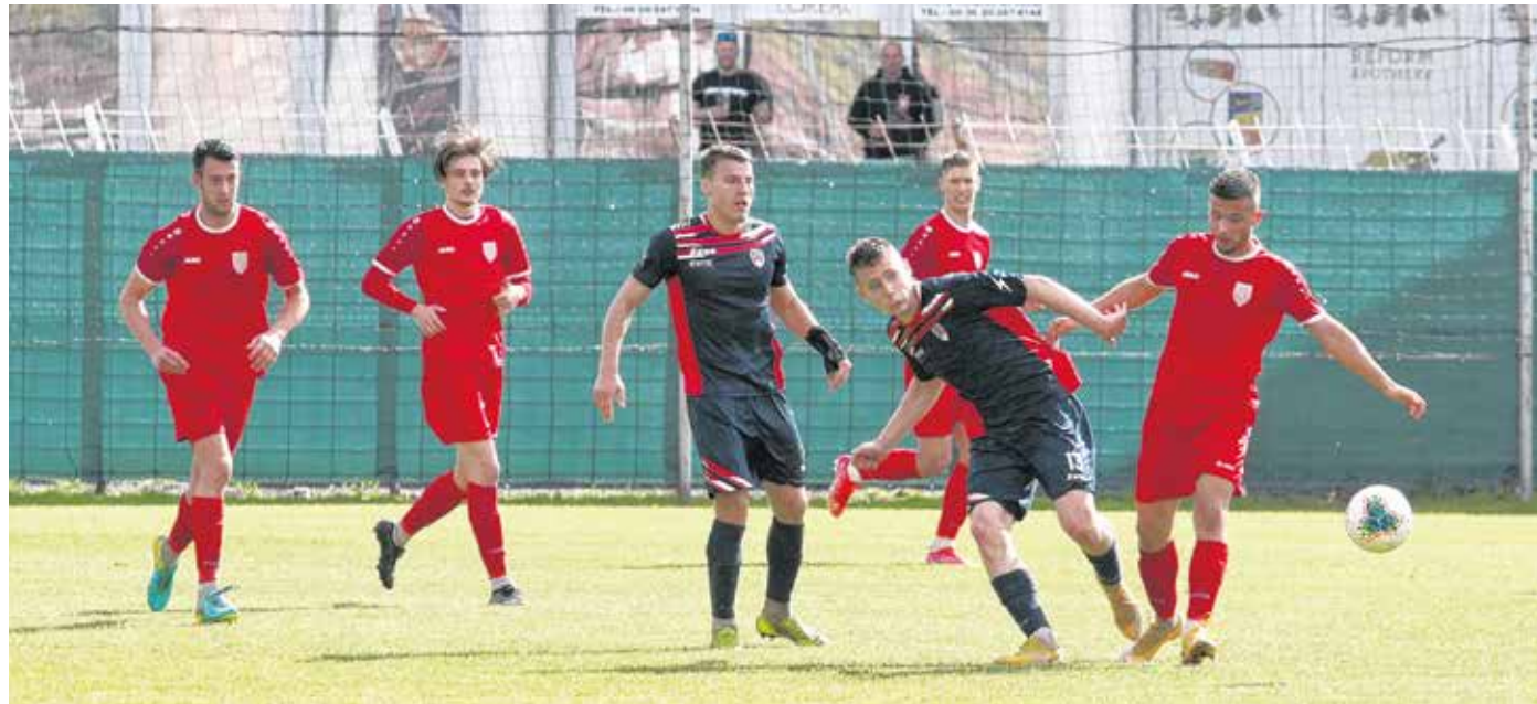
A Nagykanizsa ellen nem sikerült gólt szereznie a soproni csapatnak, 0-0-s eredménnyel zárult az összecsapás.