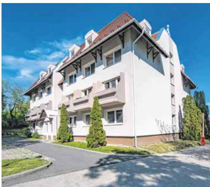
A nővérszálló külső felújítása 2017-ben zárult, most belülről teszik rendbe az épületet.

A mostani felújítás után jelentősen javulnak a soproni egészségügyi dolgozók lakhatási körülményei. A nővérszállóban negyvenhat lakóegység van, ezekben a kórház alkalmazásában álló orvosoknak és szakdolgozóknak biztosítanak kedvezményes szállást.