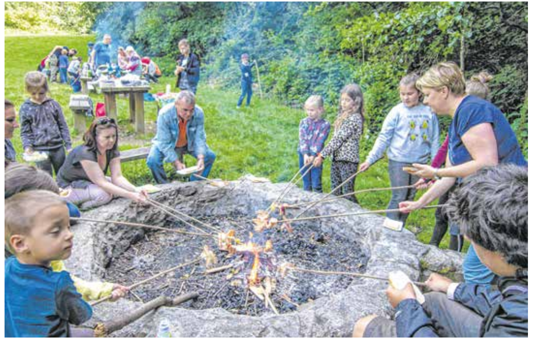
Fontosak a közös élmények, ezért a túratábor végén a szülőkkel szalonnasütést tartanak.