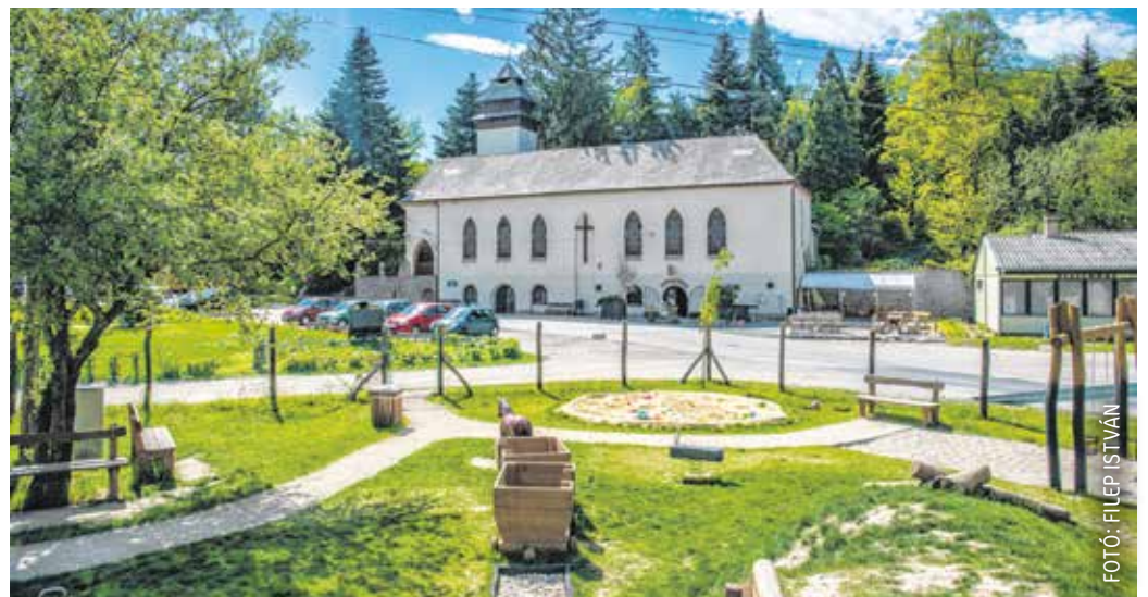
Brennbergbányán őrzik a hagyományokat, az új játszótéren a fajtékok is a bányászmulat idézik.

Az ország legrégebbi szénbányájának otthont adó Brennbergbánya (németül Brennberg) egy szétszórt szerkezettű település, amely összesen 16 kisebb-nagyobb települést áll. A legenda szerint egy birkapásztor 1752-ben tüzet gyújtott, hogy melegegjen, majd amikor el akarta oltani, a tűz tovább égett, sőt a tűzrakóhelyen másnap is izzott a szén. Egy másik történet szerint egy Rieger nevű szénégető boksája (kúp alakú farakás) sehogy sem akart elaludni, mert a boksát egy elfedett kőszénkibúvás fölé telepíthette. Ez az égést tovább táplálta, ami miatt a hegy is égni kezdett. Az égő hegyet németül brennender Bergnek mondják, ebből született a Brennberg.