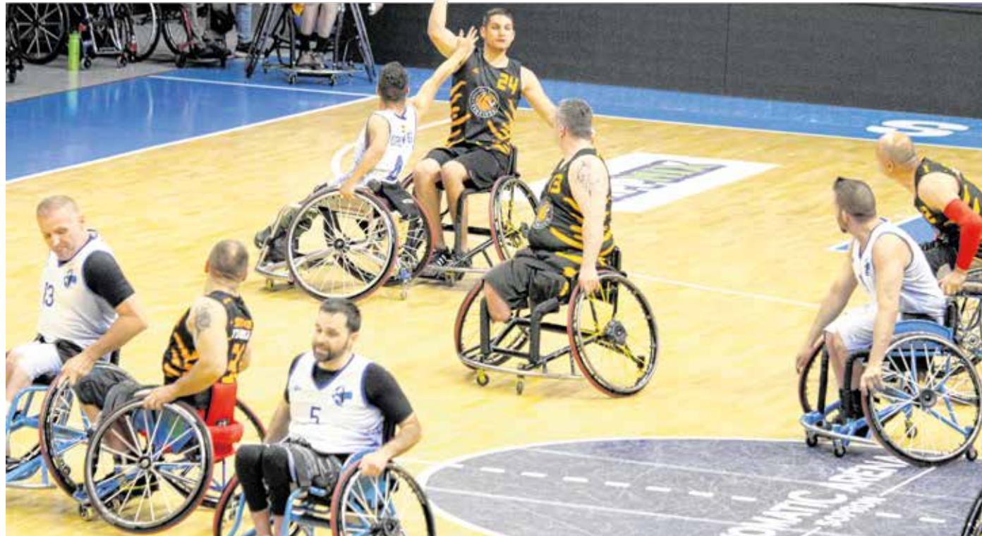
A Soproni Tigrisek SE kerekesszékes kosárlabdacsapata mind a két hétféle meccsén nyert, így harmadszor szerzett bajnoki címet.