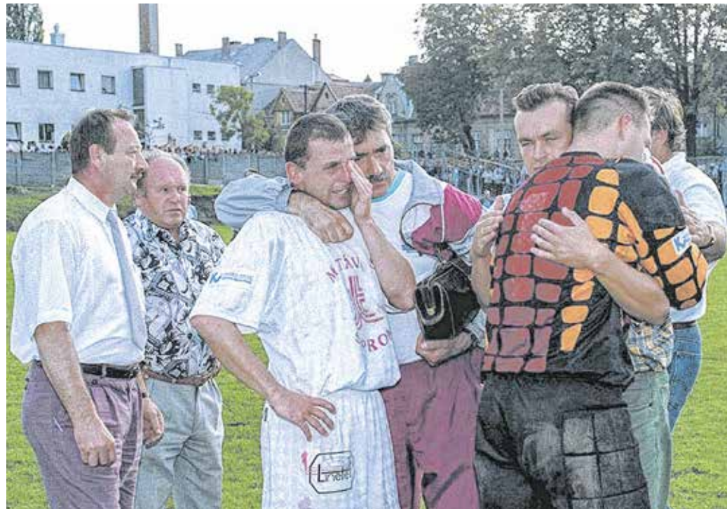
Könnöző matávosok az ETO elleni osztályozót követően: hosszabbítás után 2–1-re kikapott a csapat.

A második meccsen, június 30-án 5000 szurkoló zsúfolódott össze a József Attila utcai pályán. A hazai csapat