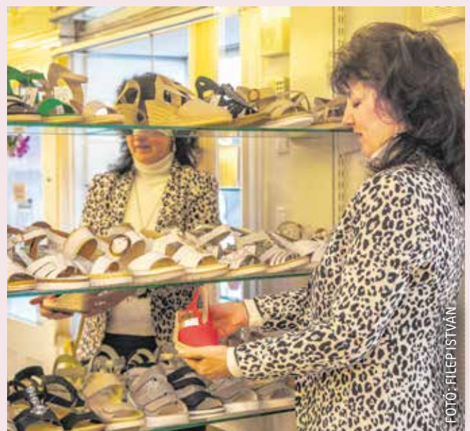
A hölgyek hétköznap szívesen viselnek hosszú távon is kényelmes, telitalpas vagy vastagabb sarkú szandált.

Az idei kínálatban mindenki megtalálhatja a neki leginkább megfelelőt: a visszafogott, minimalista stílusú, vékony pántos szandálok magas és közepes sarokkal, valamint teljesen lapos talppal is