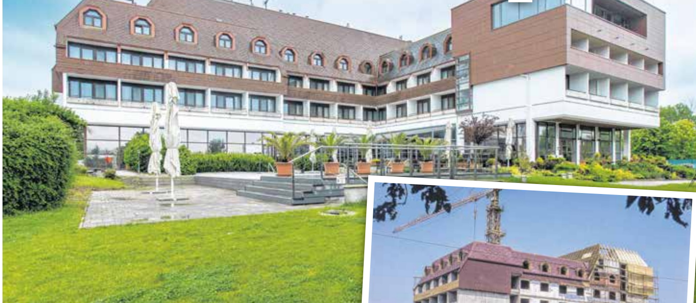
A Hotel Sopron napjainkban és 1982-ben, az építéskor.