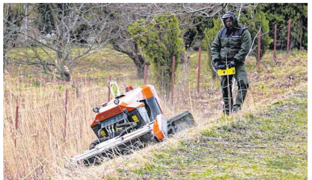
Útszéleket, gátakat, töltéseket is karban lehet tartani a mulcsozó robottal.