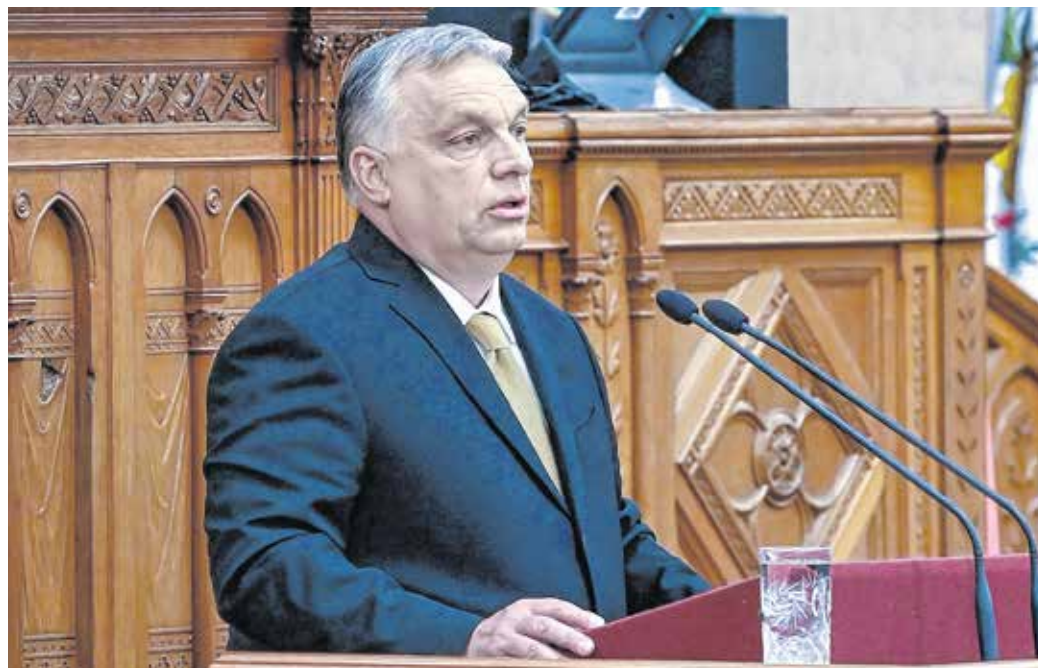
Orbán Viktor miniszterelnök beszédet mondott eskütételét követően az Országgyűlés május 16-i ülésén.

Orbán Viktor leszögezte: Magyarország az Európai