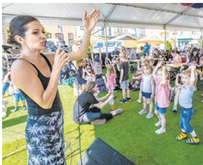
A borünnepen nemcsak a felnőtteknek, de a gyermekeknek is szerveztek programokat.

a bor a kultúránk része. Arra pedig vigyáznunk kell. Éppen ezért az önkormányzat is támogatja a borászokat, a hegyközséget és a borlovagokat, tehát mindenkit, aki abban érdekelt, hogy a soproni bornak a színvonala emelkedjen és a soproni bor megítélése jóval magasabb polcra kerüljön, mint amilyen most van. Mi tudjuk pontosan, hogy amit a pohárba töltünk, az jó! De hogy ezt máshol is így érezzék, ahhoz még sokat kell dolgoznunk.