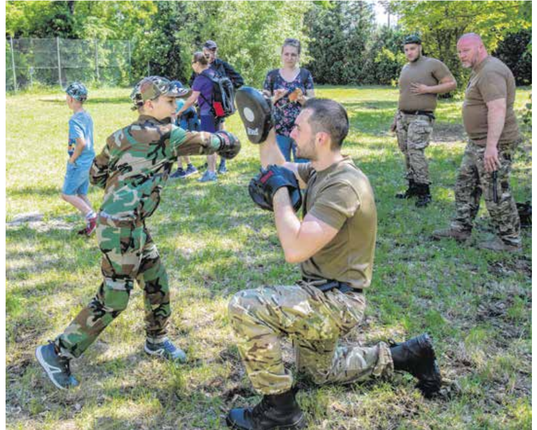
A Magyar Honvédség Sopron Járás Területvédelmi Századának tagjai önvédelmi oktatást is tartottak a szombati rendezvényen.

A rendezvényt a Sopron Járás Területvédelmi Század szervezte, melynek egyik fő feladata, hogy kapcsolatot teremtsen a lakosság és a Magyar Honvédség között. – A rendezvény résztvevői