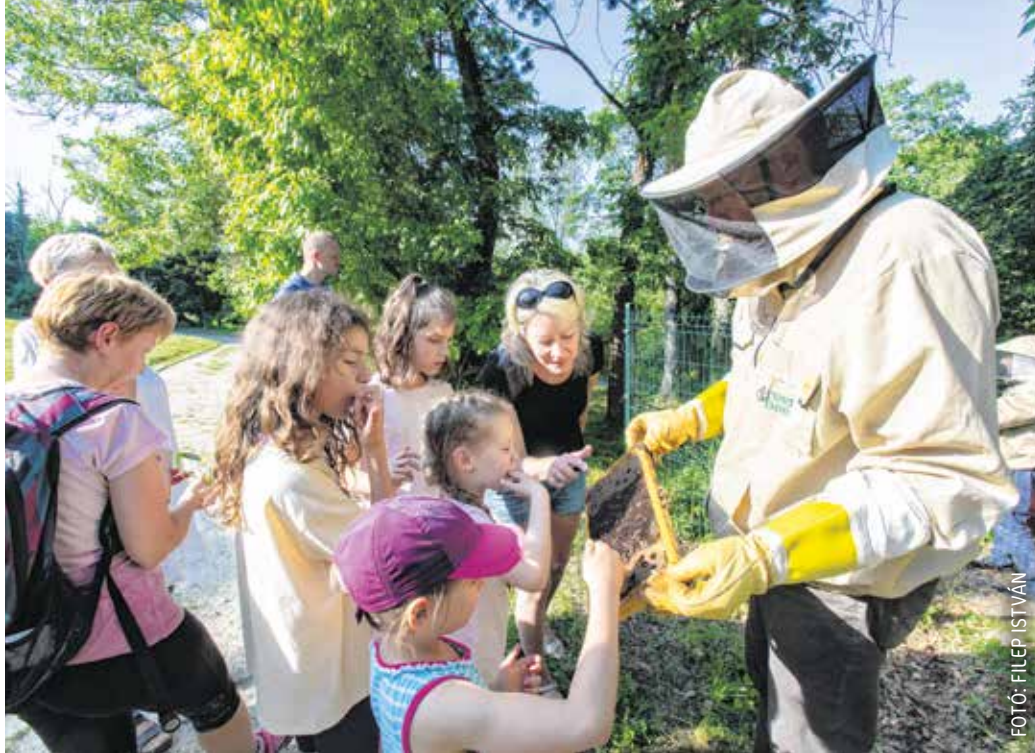
A méhek napján az érdeklődő gyerekek megnézhetik a botanikus kertben lévő méhkaptárakat is.