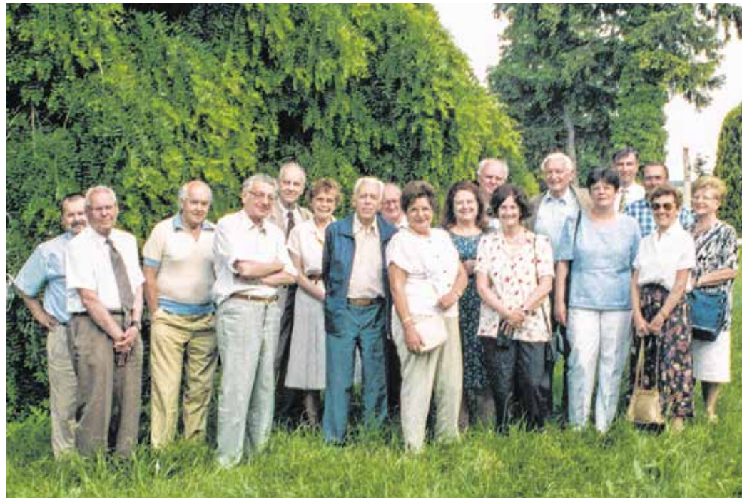
1999-ben Nagylózsra kirándultak a Soproni Helytörténet-szek Baráti Köre tagjai.

A kört heten alapították, a fél évszázad alatt összesen 68 taggal rendelkezett. Ahhoz, hogy valaki taggá váljon,