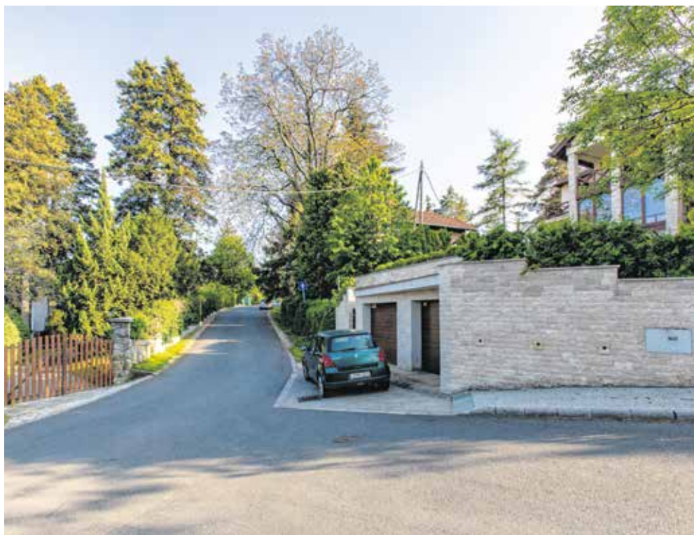
A Mikoviny utca és a Lánzséri út között húzódik a 450 méter hosszú Winkler út.