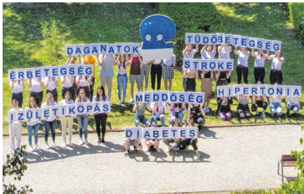
Az Eötvös-szakköznevelő diákjai polipot formálva mutatták be a túlsúly veszélyeit.

Magyarországon minden negyedik ember elhízottnak számít, az Európai Unió tagállamai közül csak Málta előz meg minket ebben a nem éppen előkelő rangsorban. A szakemberek szerint életmentő a megelőzés.