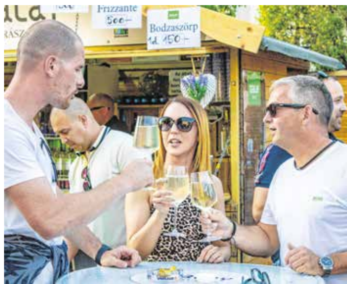
Idén is üvegphorból lehetett kóstolni a soproni borokat.