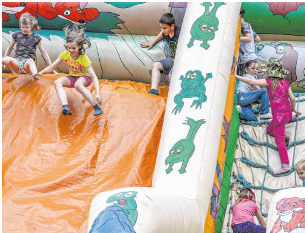
Önfleddt játék a 2019-es gyereknapon – a vírushelyzet miatt tavaly nem lehetett programokat szervezni, idén is szűkösebbek a lehetőségek.

Enikő úgy látja, ma kevesebb idő jut a családi időtöltésekre. A gyerekeknek az lenne a legjobb, ha anya és apa sokat