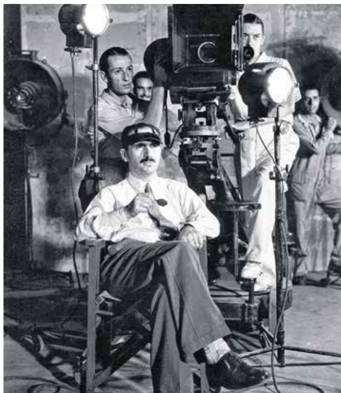
John Alton operátor filmforgatás közben.

1952-ben vehette át John Alton azt a bizonyos Oscar-díjat a Gene Kelly főszereplésével forgatott Egy amerikai Párizsban című filmmusical operátora munkájáért. Pályája csúcspontján, 1960-ban, 59 évesen vonult vissza a filméletről. Ezt követően még közel negyven évet élt.