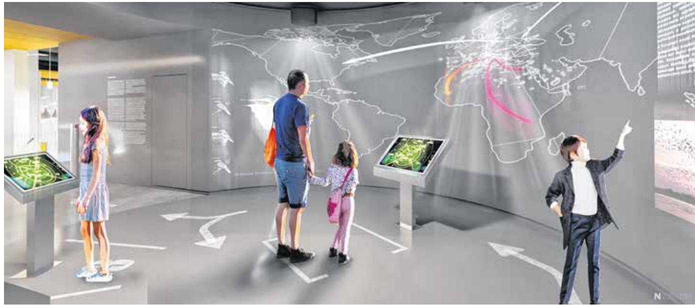
Az ökocentrumban egy légiirányító-központot is kialakítanak, ahol repülőgépek helyett a madarak útját lehet nyomon követni.

B. S.: – A kiállítás és az ökocentrum belső terének kialakítása két fontos kiindulási ponton nyugszik. Az egyik, hogy a Fertő mint Eurázsia legnyugatibb sztyepp-tava különleges természeti és földrajzi adottságokkal bír, ez alapvetően meghatározza az élővilágot. A másik, hogy részben a tó saját adottságainak, részben az elmúlt évszázadok emberi beavatkozásainak következtében a Fertő jelentős része elnadasodott, és mára az ország legnagyobb kiterjedésű, náddal borított területévé vált. A nádasok hangulatának megteremtése végig jelen van az épületben. Az ökocentrum bemutatja ezt a rejtett