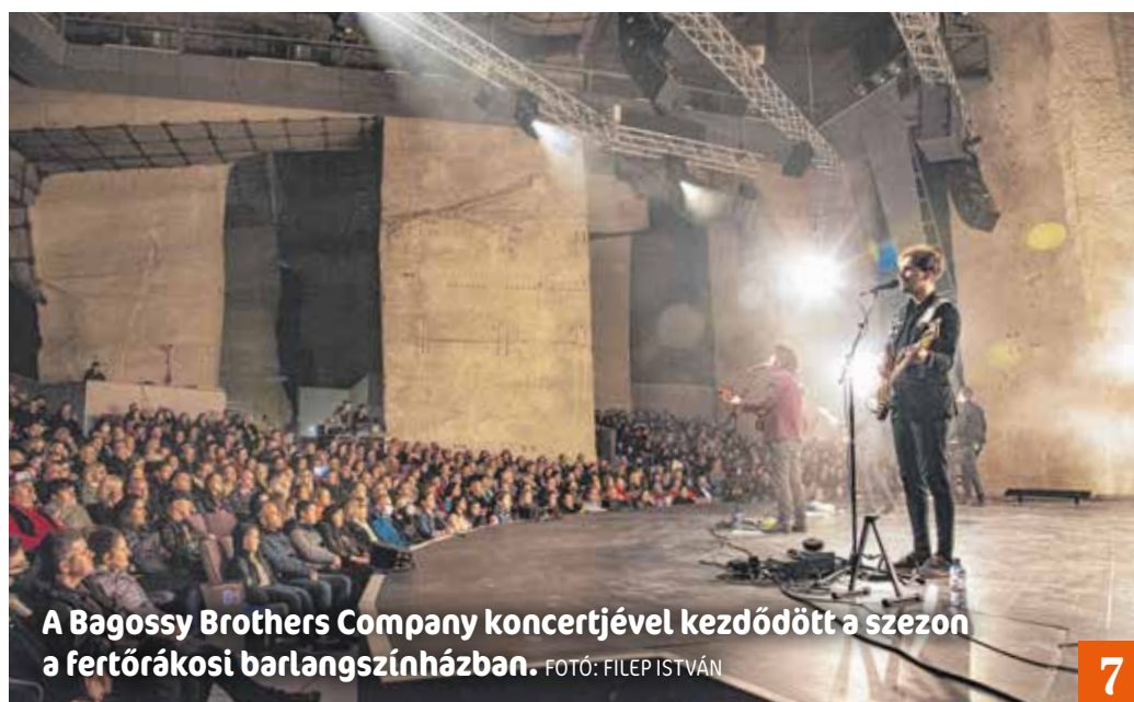
A Bagossy Brothers Company koncertjével kezdődött a szezon a fertőrákosi barlangszínházban.