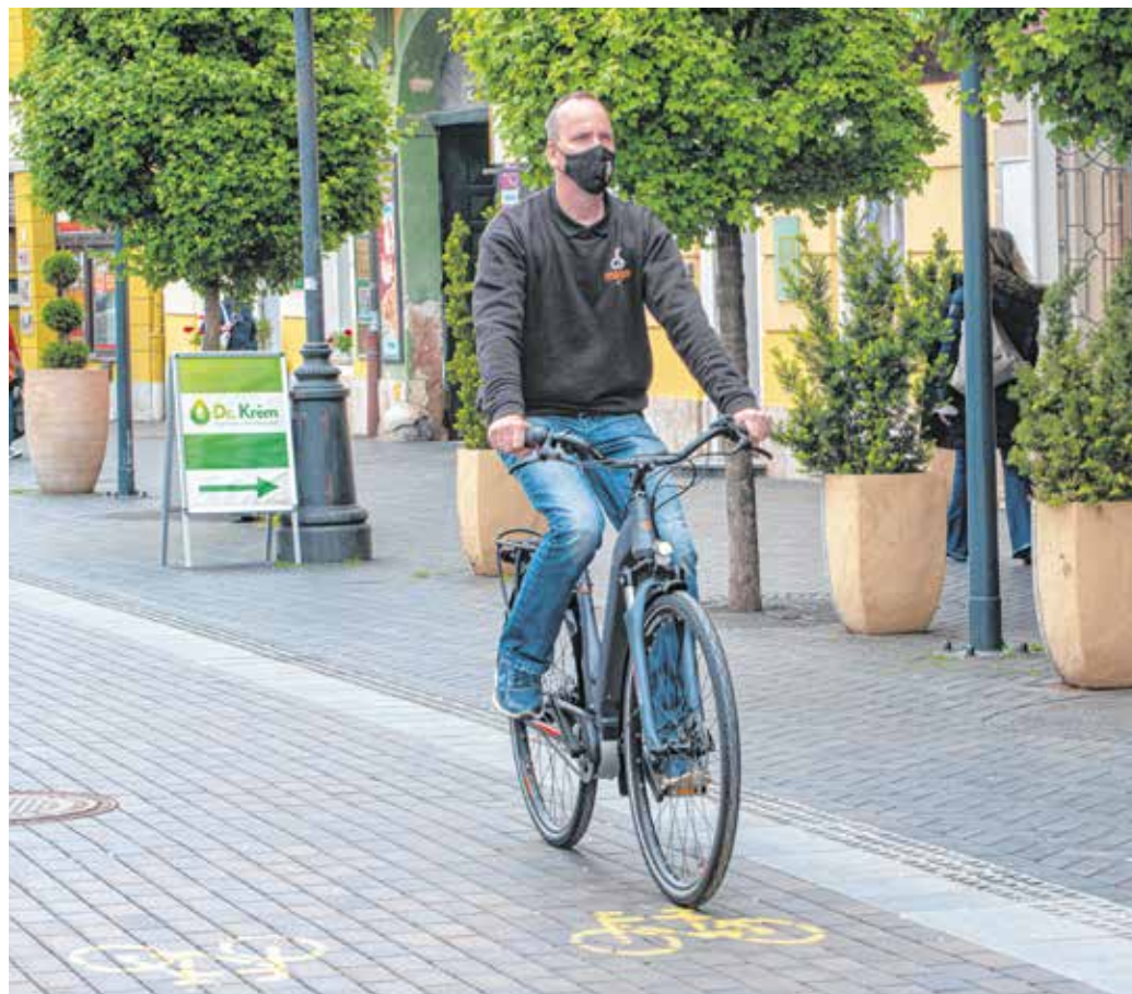
Tavasszal egyre többen pattannak két kerékre – a hagyományos biciklik mellett népszerűek az e-kerékpárok és a rollerek is.

Szót kell még ejtenünk az ugyancsak egyre népszerűbbnek számító elektromos rollerről is. Ez a jármű még mindig nevesítve a KRESZ-ben. Az ügyben Pintér Sándor