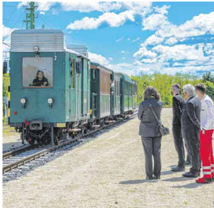
A felújított Dmot motorkocsi a nagycenki múzeumvasúton.

Fertőboz állomáson megújultak a fűtőház szerkezeti elemei, lecserezték a teljes tetőhéjazatot, új burkolat készült, valamint kívül-belül újravakolták és festették a