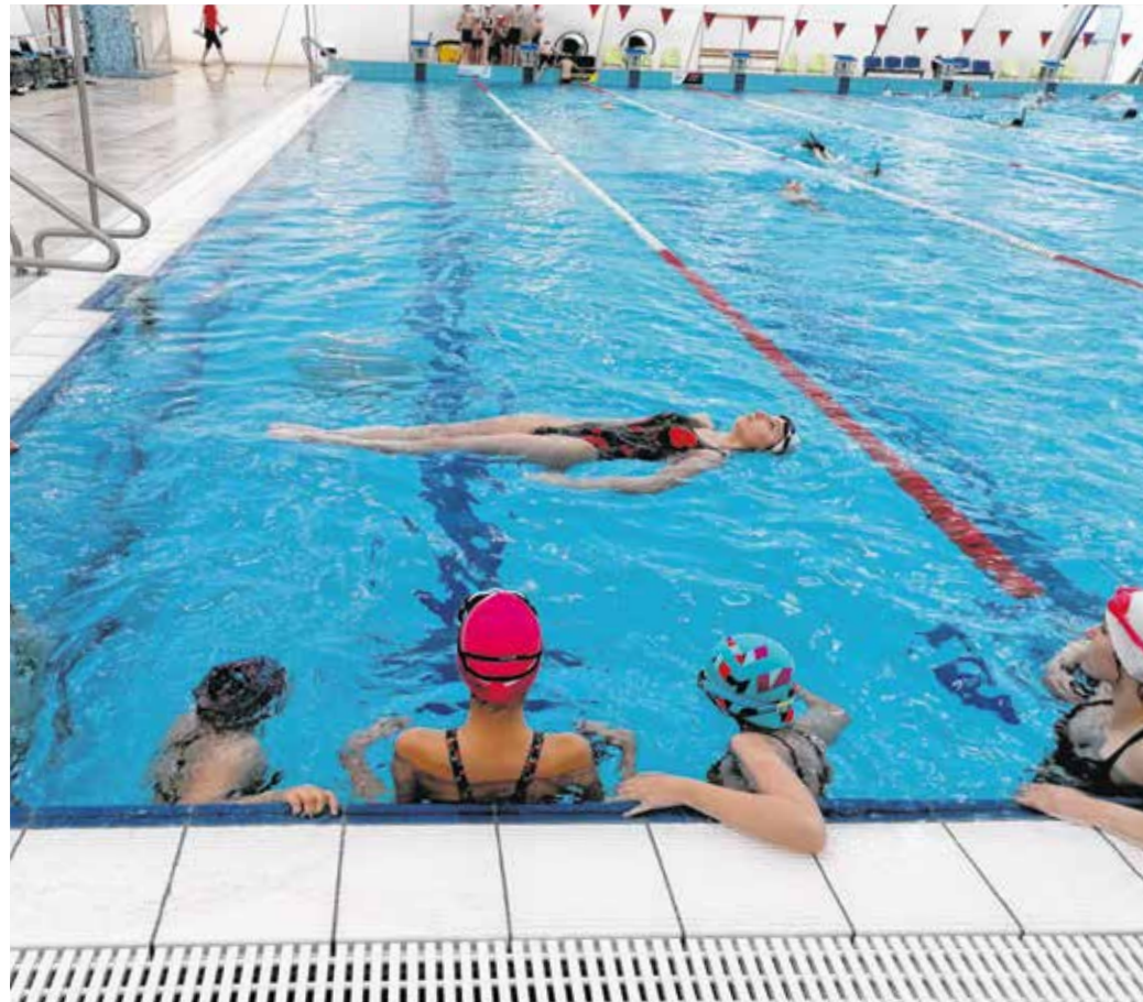
Az Eb bronzérmes Götz Lilien bemutatót és élménybeszámolót tartott a soproni szinkronúszóknak.

Götz Lilien a budapesti rendezésű vizes Eb-n három versenyszámban is indult a magyar válogatott tagjaként: a hosszú csapatprogram, kombinációs kúr, valamint a highlight kúr programjaiban