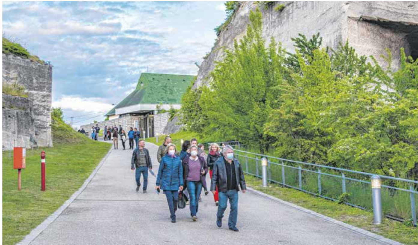
A Fertőrákosi barlangszínházban hétvégén tartották az évad első koncertjét, lelkesen érkeztek a nézők a programra.