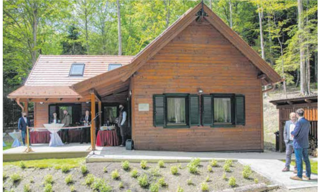
A Roth-turistaház épülete a Hidegvíz-völgyben – már várja a vendégeket.