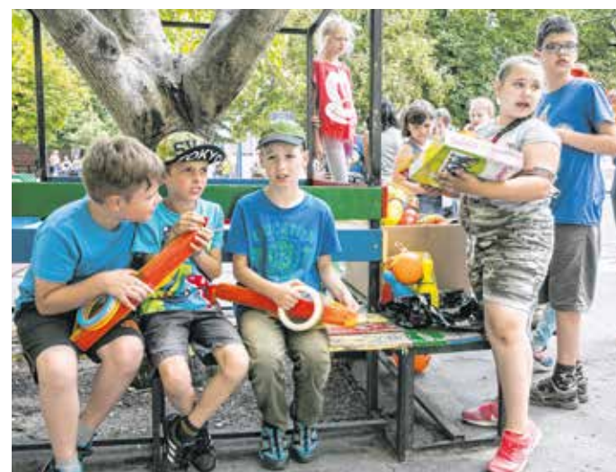
A nyári napközinek több évtizedes hagyománya van.

A nyári napközinek több évtizedes hagyománya van. Az előző években hatalmas sikere volt a kezdeményezésnek, napi szinten 180–200 gyerek élt a lehetőséggel. A napköziben nem gyermekmegőrzés történik, hanem a szervező Lackner-iskola színes programokat biztosít a kicsik és a nagyobbak számára. Ha az időjárás engedi, szabadterei eseményeken