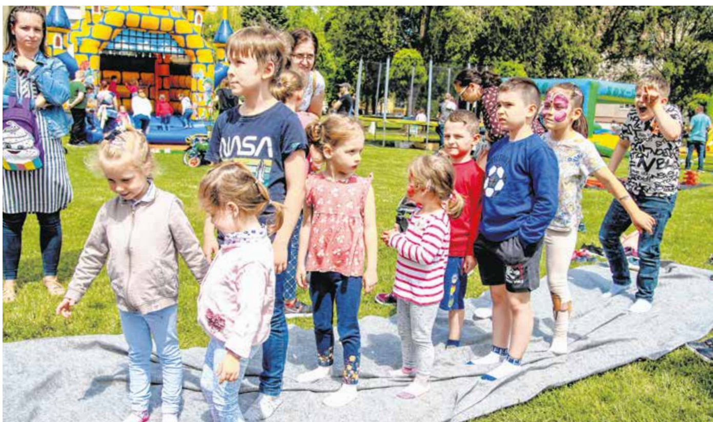
Az ugrólóvák mellett az egyik legnépszerűbb játék az óriáscsúszda volt az idei gyereknapiakon is.

A rendezvényen népszerű volt a kézműveskedés, sokan festettek az arcukra, de a lufihajtogató bohócnál is sorban álltak a gyerekek. Több tucatnyian beszálltak a rendőrautóba, és elindították a szirénát, de láthattak tűzoltóautót és rabomobilt is a résztvevők. A színpadon a helyi diákcsoportok mellett felléptek népszerű együttesek is.