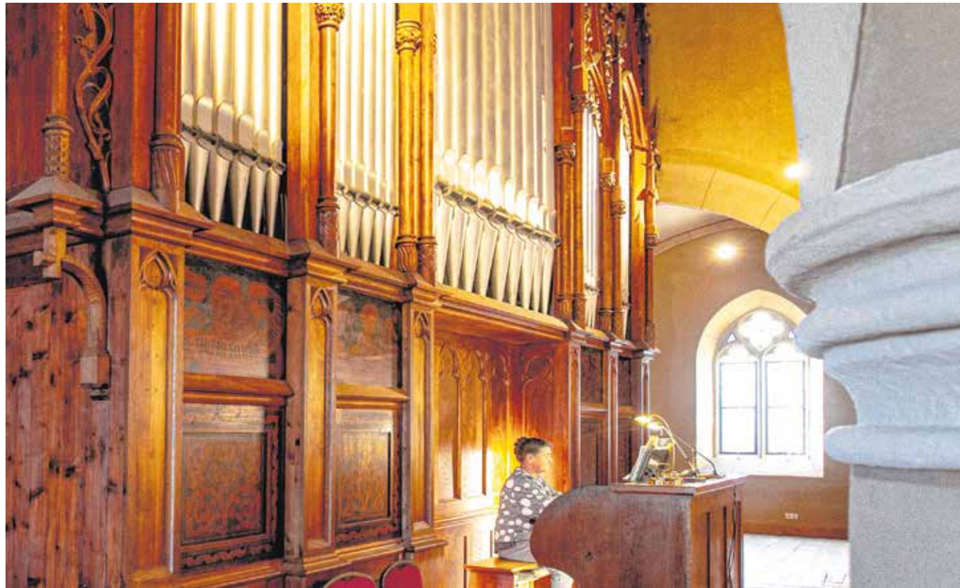
Közel 80 év után újult meg most a Szent Mihály-templom orgonája – csodálatosan szól a szentmiséken, esküvőkön.

A Szent Mihály-templom orgonáját a budapesti Rieger Ottó-féle orgonagyár készítette, a hangszerben részben felhasználták a templom korábbi, Karl Hesse 1866-ban készült orgonájának egyes sípsorait. A templom belső építészeti stílusának megfelelő, régi, neogótikus szekerény két-két szélső sípmezőjét is