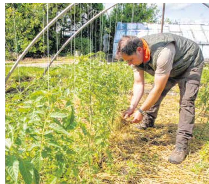
A talajt takarhatjuk többek közt levágott fű nyesedékével, felaprított lombbal vagy avarral, ágdarálás során képződött nyesedékkel és szalmával is.