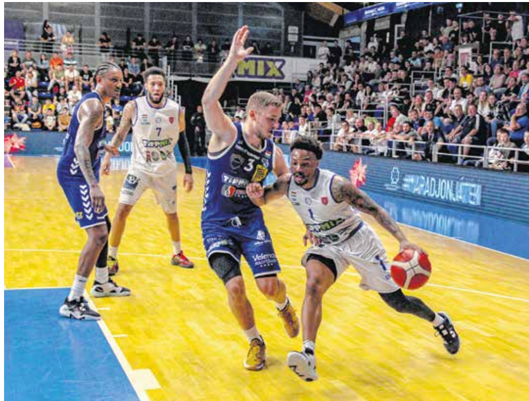
A Sopron KC a középszakaszban a negyedik helyen végzett, az elődöntőbe azonban nem sikerült bejutnia a csapatnak, mind a három mérkőzést elveszítette a Fehérvár ellen.

– Mi kellett volna ahhoz, hogy az elődöntőbe ke-