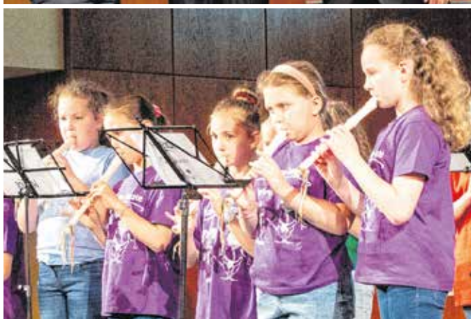
Az ünnepi műsorban felléptek az intézmény óvodásai, jelenlegi és korábbi diákjai, valamint az iskola kamarakórusa, de itt adták át a Sopronért emlékéremet is.

pedagógusok munkáját, valamint a szülők együttműködését. Az evangélikus egyház nevében dr. Tóth Károly igazgató lelkész köszöntötte a születésnapos iskolát. Az ünnepi műsorban felléptek az intézmény óvodásai, jelenlegi és korábbi diákjai, valamint az iskola kamarakórusa is.