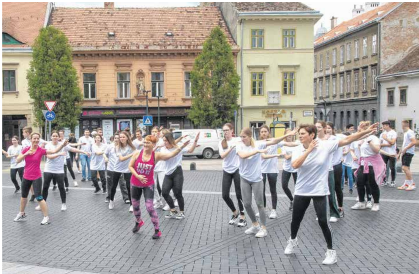
A kihívás napján a legtöbben a Mária-szobornál mozogtak – aerobik- és karateedzők tartottak foglalkozásokat.