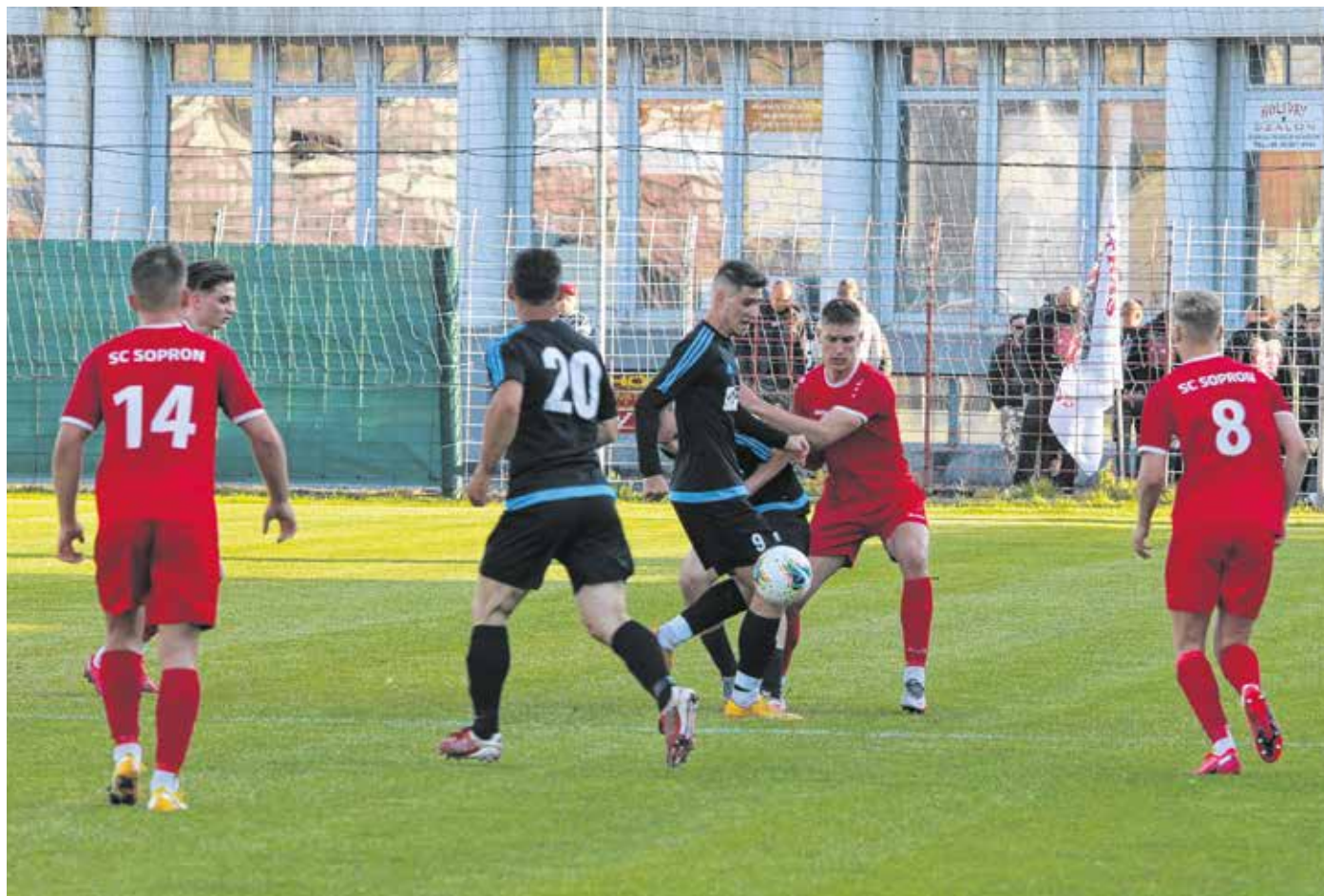
Gólokban gazdag mérkőzésnek lehetnek szemtanúi azok, akik kilátogattak az idény utolsó bajnoki meccsére.