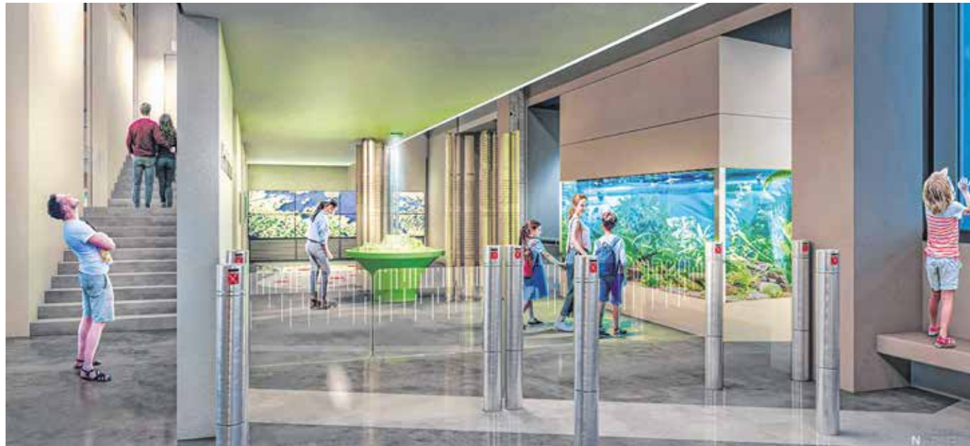
Az új ököcentrumban változatosan, innovatív technikával mutatják be a Fertő tó élővilágát. LÁTÁNYTERV

B. S.: – Ahhoz, hogy valami vonzó legyen, szükség van arra, hogy a tér, a kiállítási tartalom párbeszédet folytasson a látogatóval. Legyen egy kölcsönös kapcsolat csak úgy, mint az oktatásban. Ha jó kommunikációs eszközöket találunk, akkor a tartalom és a befogadó közt kölcsönhatás alakul ki. Célunk egy olyan változatos látványú térsor tervezése volt, amely már a hangulatával is lenyűgözi a látogatót. Izgalmas helyzetekben a Fertő tó élővilágának változatos bemutatásával és a