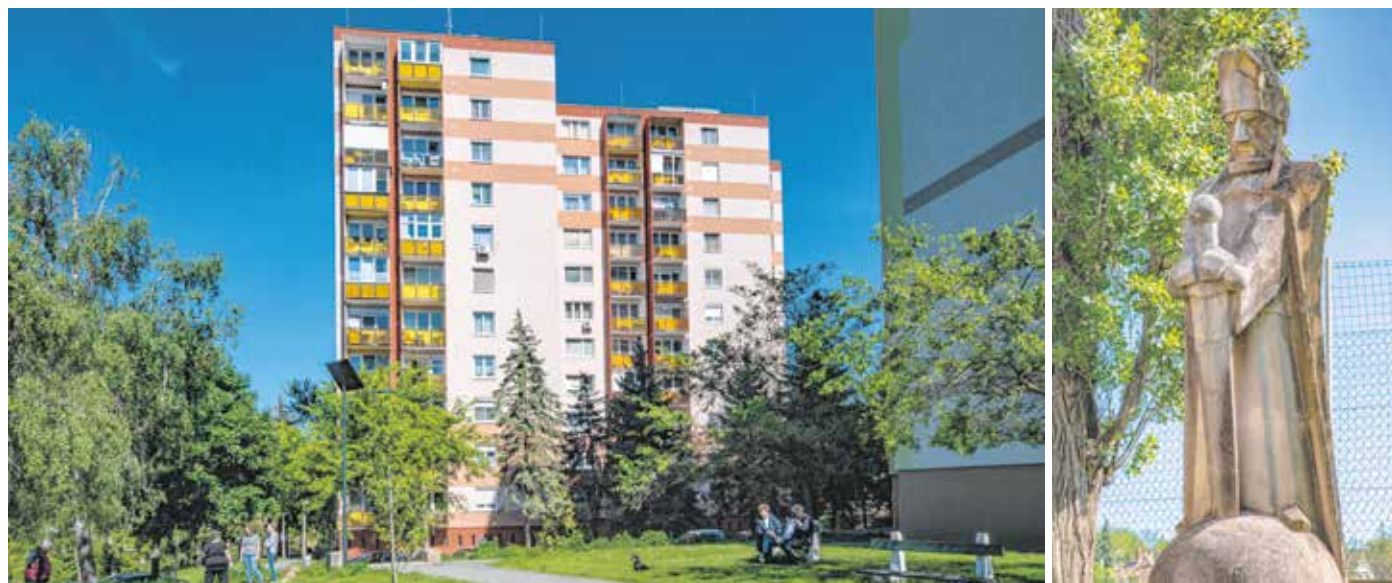
Az Ibolya úti lakótelepen összesen hat 11 szintes magasház áll, ezeket a '70-es években építették. Attila hun király szobra pedig a József Attila-lakótelepen található.