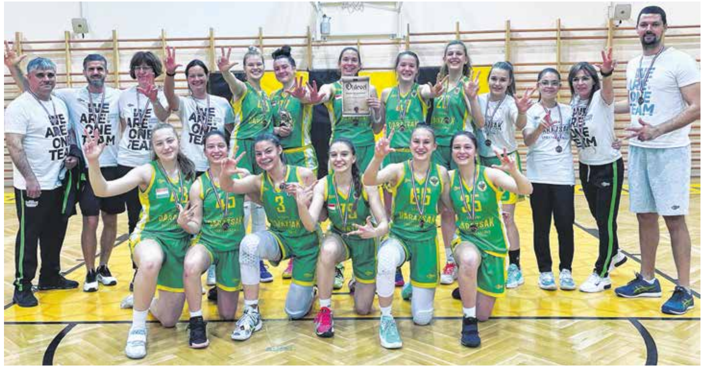
Volt miért ünnepelni: a Darazsak Sportakadémia együttese bronzérmet szerzett leány kadett bajnokságban.