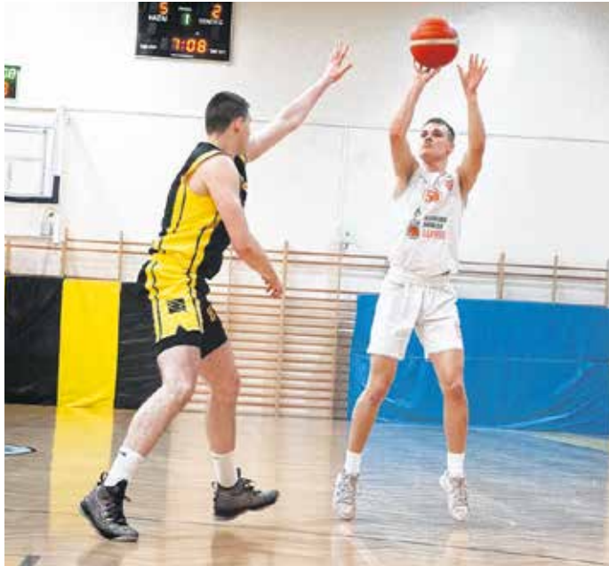
A szezon utolsó mérkőzésén nyert a Falco ellen a Soproni Sportiskola Kosárlabda Akadémia U18-as csapata.