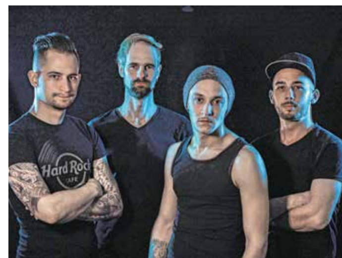
A Pair o' Dice már várja a hétvégi fellépést.

Közel egy év után újra színpadra áll a soproni Pair o' Dice. A formáció június 5-én, szombaton este a Bűgöcsiga Akusztik Gardenben lép fel a Magor mellett.