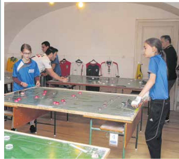
Május 30-án volt 10 éve, hogy megalakult a SMAFC szektorlabda szakosztálya – a jubileumot házibajnoksággal ünnepelték a gombfocizók.

Inczédi Gergely hozzátette: május 30-án, az alapítás tízéves évfordulóján a szektorlabdaszakág keretein belül vívtak egymással komoly mérkőzéseket a versenyzők. Az ünnepi megmérettetésre vendégek is érkeztek, így a budapesti Testvériség és a szombathelyi Vasi GE gombfocizói is ott voltak az alapítás alkalmából rendezett versenyen.