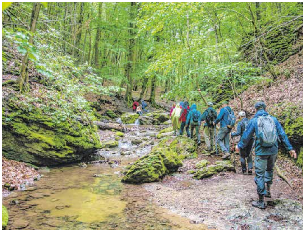
A soproni Túrabotos Természetjáró Klub tagjai a közelmúltban az Ördög-árokba kirándultak.

A tervezett helyszínek közt szerepel például a Bükk és a Tisza-tó. – A túrasorozatot többnapos kirándulásként tervezem, helyet adva több, a klubunk által gyakorolt túranemnek. Lesz egy hosszú erdei kirándulás a Bükk