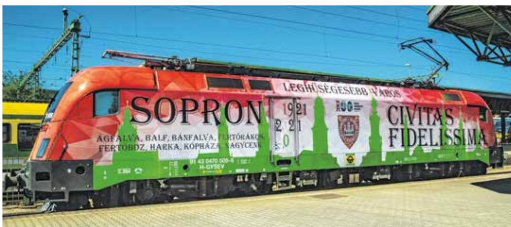
A Hűség-mozdonyon olvasható az 1921-es népszavazásban érintett valamennyi település neve is.

– A népszavazás e térség polgárai számára sorsfordító volt. Ez a győzelem túlmutat