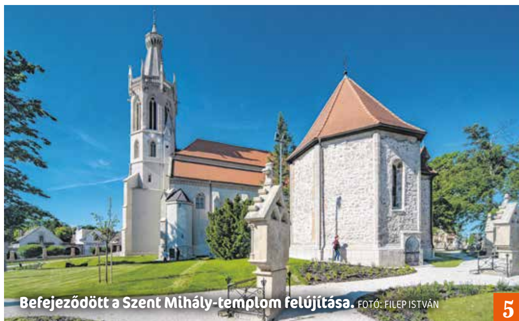
Befejeződött a Szent Mihály-templom felújítása.