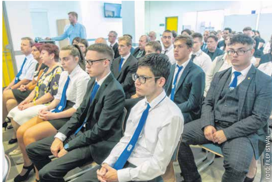
Nyolc szakképző iskolájának negyvenhét tanulója és harminckét oktatóját díjazta a 2022/2023-as tanévben a Soproni Szakképzési Centrum.

– A mai egy örömmel, amikor megsüvegeljük azoknak a fiataloknak a teljesítme-