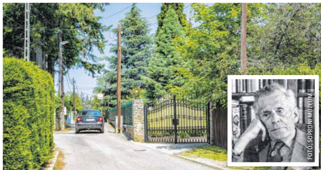
A Becht Rezső utca a Szent Margit úttól vezet egészen a Lőver körútig.