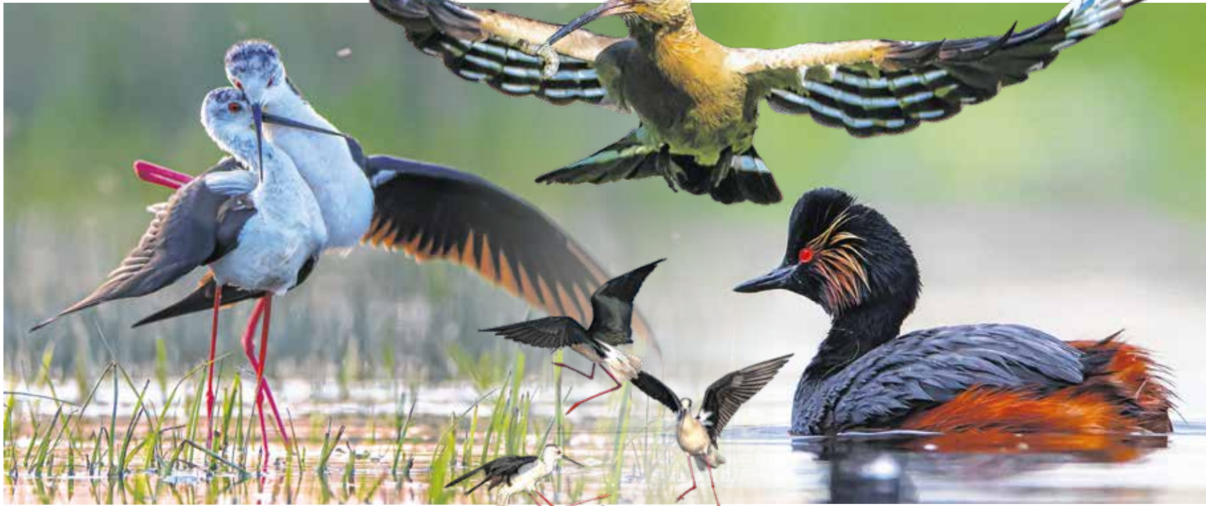
Kránitz Roland fotóin „megszólalnak” a madarak – balra golyatöcs pár öletkezik, fent a búbosbanka viszi zsákmányát, jobbra feketenyakú vöcsök úszkál.