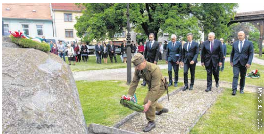
A megemlékezés után elsőként Sopron vezetése helyezte el koszorút az emlékműnél.