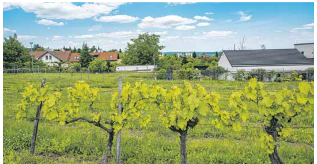
A mai Virágvölgy területén a 16. században már szőlőkertek voltak.

A terület történetéhez tartozik egy érdekesség is. A 18. század közepén ezen a csendes helyen telepedett le egy