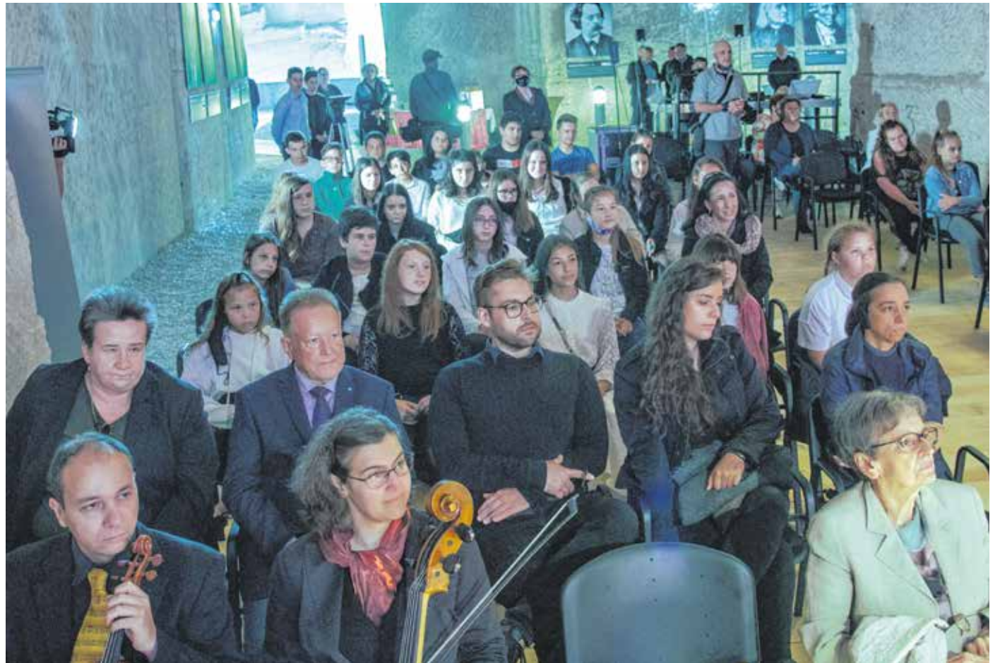
A barlangszínház Dohnányi-termét a nemzeti összetartozás napján adták át ünnepélyes keretek között.