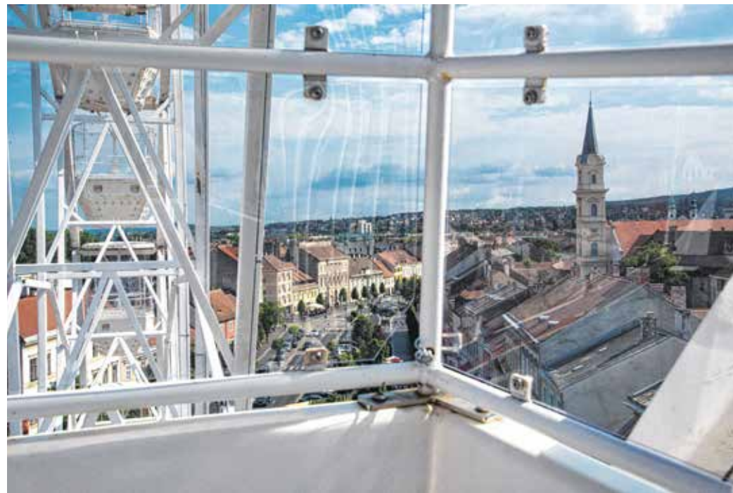
A 30 méteres óriáskerékről megcsodálhatjuk városunk kiemelkedő szépségét.

A szervezők tájékoztatása szerint a felnőtt jegy ára 2500, a gyerek 1500, a családi (két felnőtt, két gyerek) pedig 6000 forint. A szolgáltatás igénybevételéhez nem kell védettségi