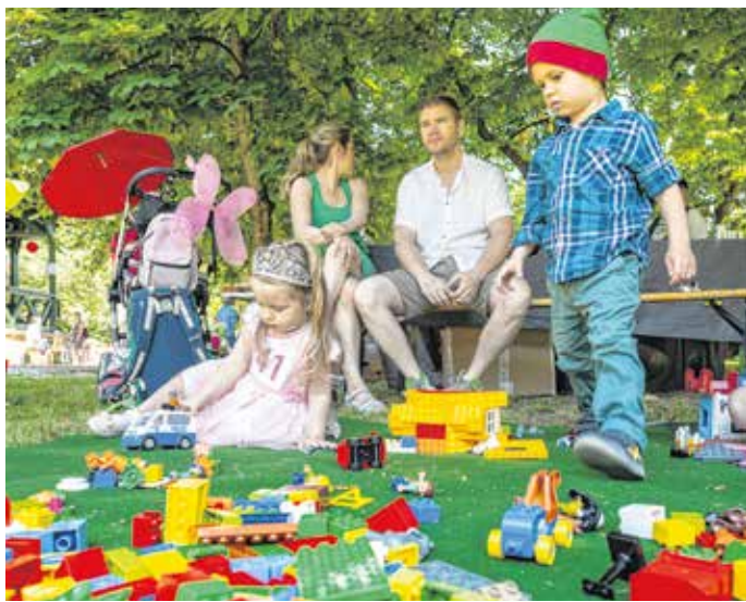
Idén is tündér- és manójelmezben várják a gyerekeket, családokat a fesztiválra.

A Tündérfesztivál szervezői a hatályos jogszabályokhoz igazodnak: mivel 500 fő feletti szabadtéri rendezvényről van szó, a felnőtt kísérők védettségi igazolvánnyal léphetnek be a program területére.