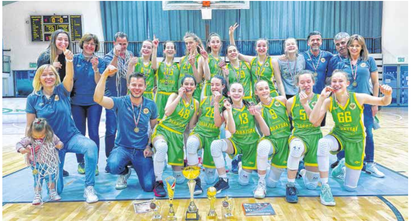
Utóljára 10 éve volt bajnok a Darazsak a serdülő korosztályban – most a Pécs ellen nyerte meg a finálét.