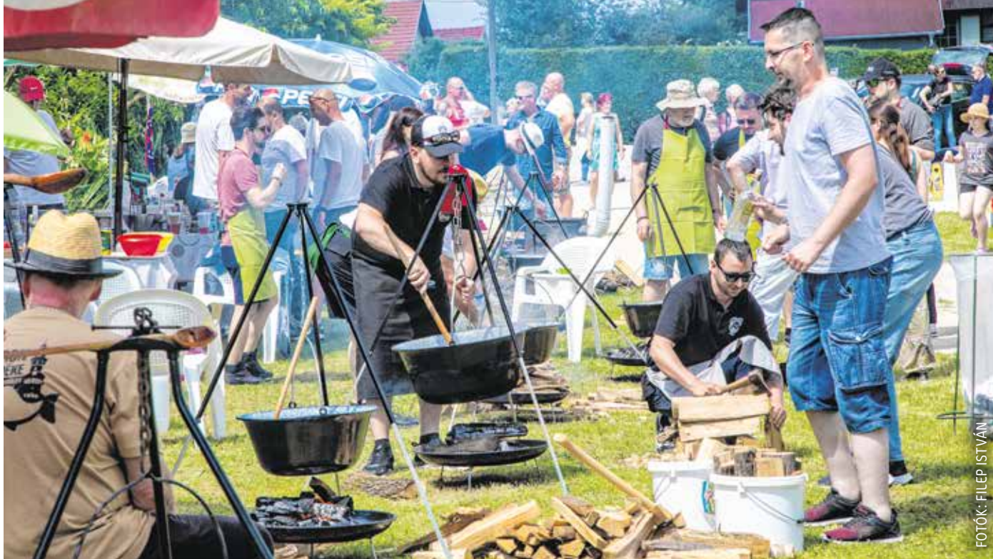
A versenyzőknek három órájuk volt a pörkölt elkészítésére – közben a gyerekeket és felnőtteket színes programok várták.