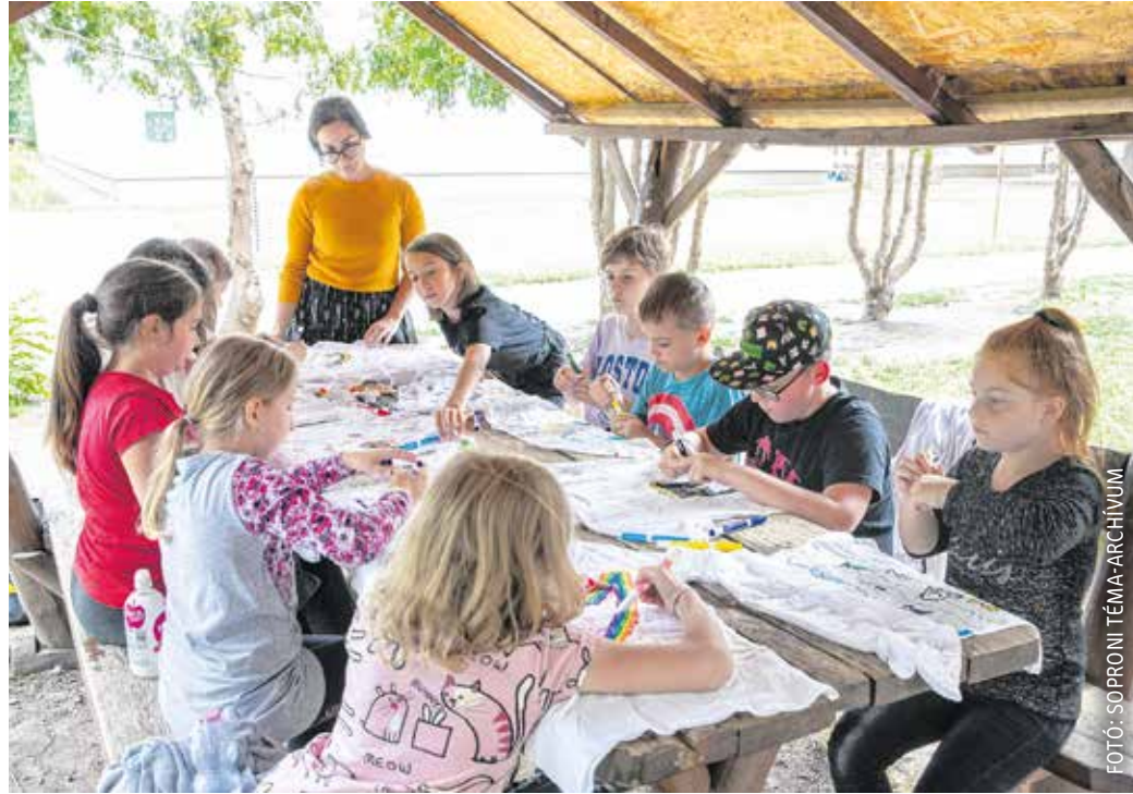
A szervezők elkötelezettek, hogy a nyári napközi ne csak a gyermekfelügyeletről szóljon, hanem a gyerekek változatos, élményekkel teli programokon vehessenek részt.