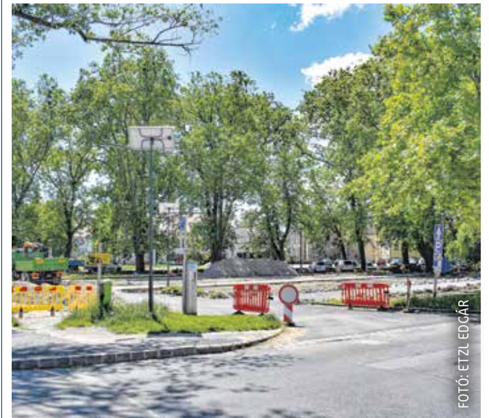
A tervek szerint augusztus végéig lesz lezárva a papréti parkoló.

Nemcsak a Papréten dolgoznak gőzerővel: megújul a Szélmalom tér is, a lejtős parkban gyepesítenek és fákat ültetnek, biztonságos sétányt és lépcsőket, padokat, hulladékgyűjtő edényeket, automata locsolórendszert alakítanak ki. A fejlesztésekről lapunkban is írtunk: Szépülő közparkok, Soproni Téma, 2023. május 17.