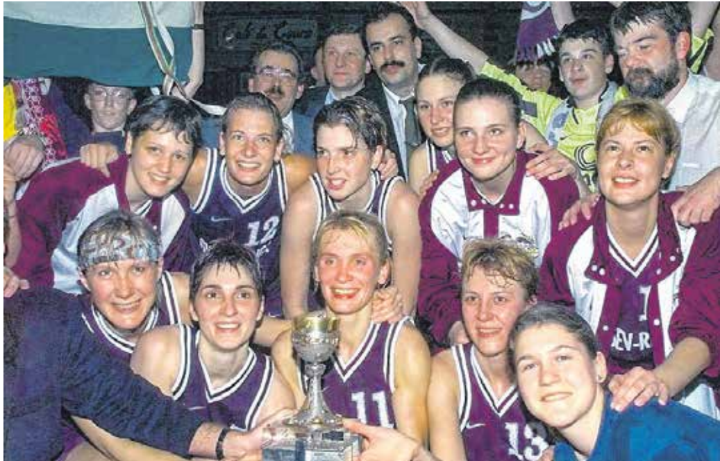
Boldog soproni csapat a Ronchetti-kupával – kosárlabdában ez volt az első nagy nemzetközi siker.

Kedvenceik – akikért 1500 kilométert buszoztak – pedig