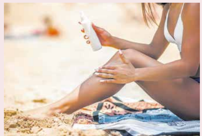
A napvédelemhez különböző faktorszámú készítményeket használhatunk – és fontos, hogy használjunk is!

– A kémiai fényvédők könnyebb állagúak, elnyelik