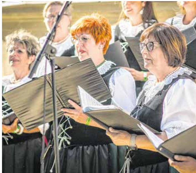
Az idei kórusünnepet a 65. Soproni Ünnepi Hetek keretében szervezik meg.

Kóruspiknik, emléktúra és sok-sok énekszó: július 1–2-án ötödik alkalommal tíz énekar részvételével rendezik meg a Soproni Kórusünnepet.