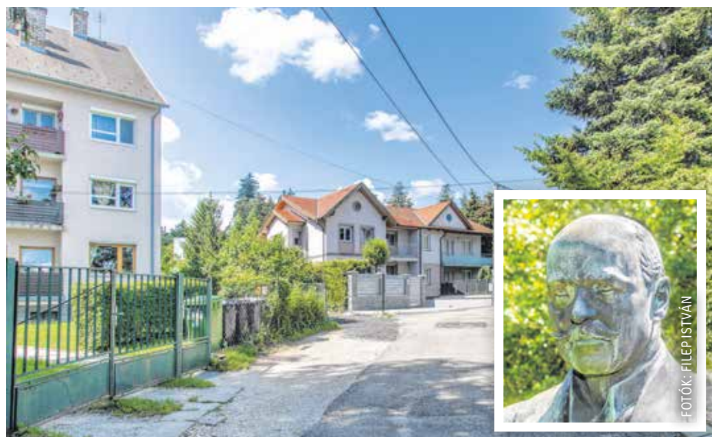
Az Alsólövérceken lévő Vadas Jenő utca a Lövér körutat és a Városligeti utat köti össze.

A Lövérceken Nussranacker nevű részén, a Villa sor és a