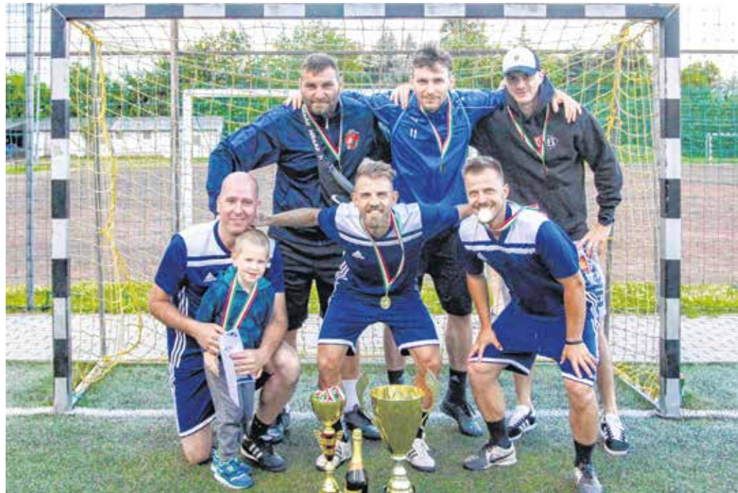
Az első osztály felsőházának bajnoka az idei kispályás labdarúgó-bajnokságon az Aramisz Söröző-Sportuszoda csapata lett.

Sopronban továbbra is a kispályás labdarúgás