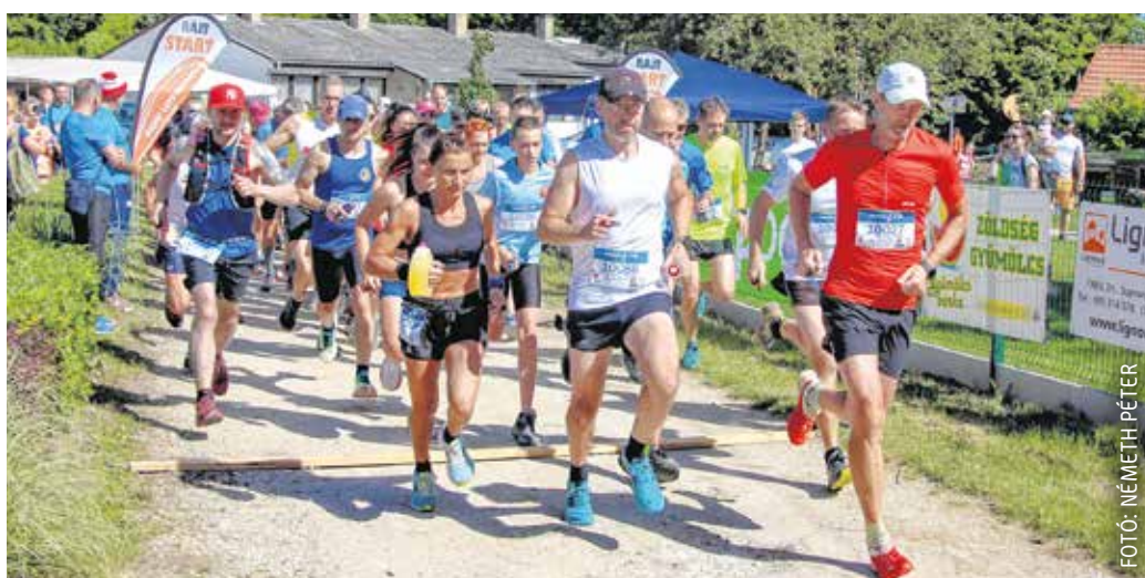
Összesen 351-en vettek részt a Sopron Trailen – a futók és túrázók Brennbergbányáról indultak.