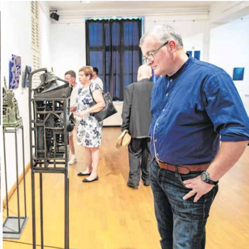
A tárlaton 12 alkotó szobrai, festményeit, domborműveit láthatja a közönség egészen augusztus 7-ig.