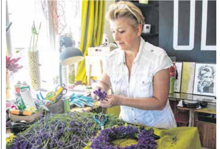
A levendulának most van a főszezonja – a belőle készült koszorú akár egy évig is tartja a formáját.