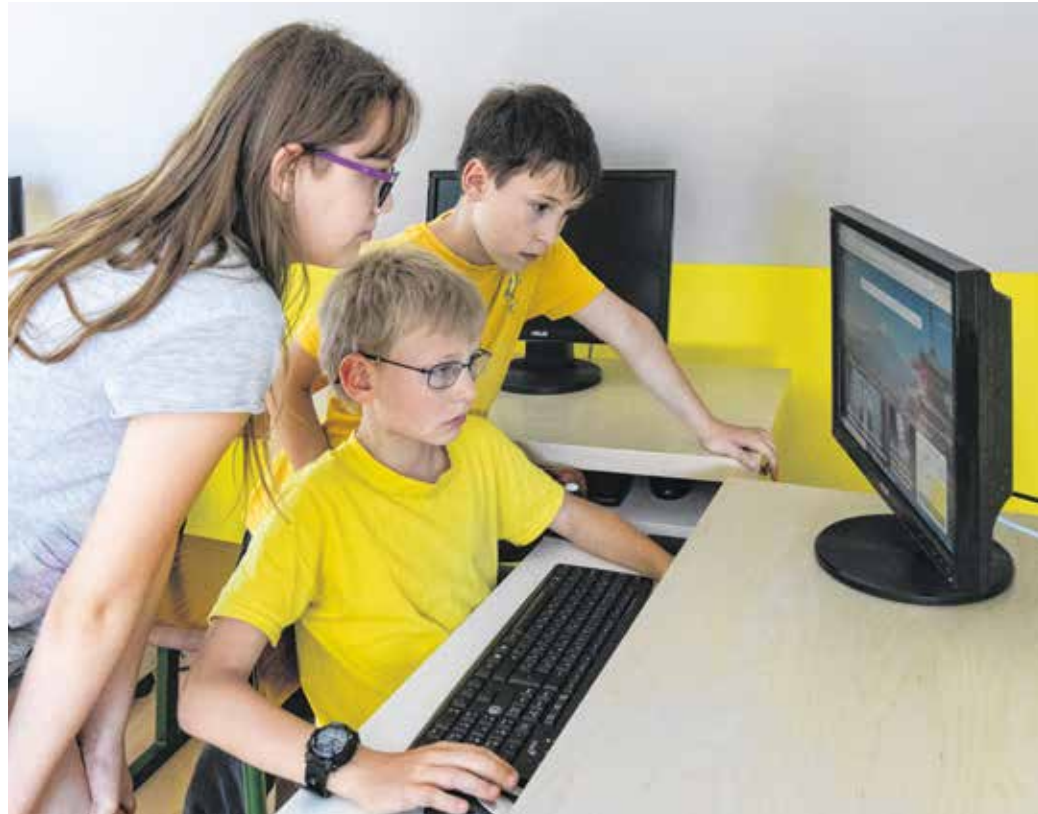
A 10–13 éveseknél – a szakember szerint – iskolaidőben napi 1 óra „kütyühasználat” javasolt. Nyáron nehezebb betartatni a gyerekekkel ezeket a kereteket.