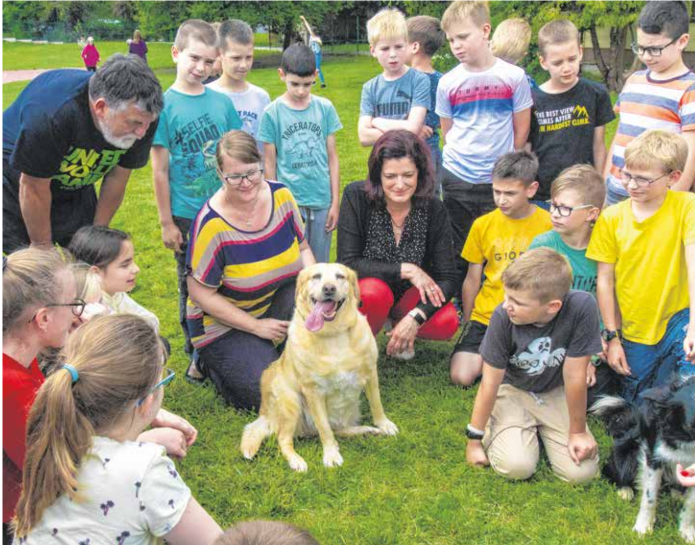
A Hunyadi-iskola diákjai rendszeresen vesznek részt kutyás tanórákon, de más állatokkal is gyakran találkoznak.