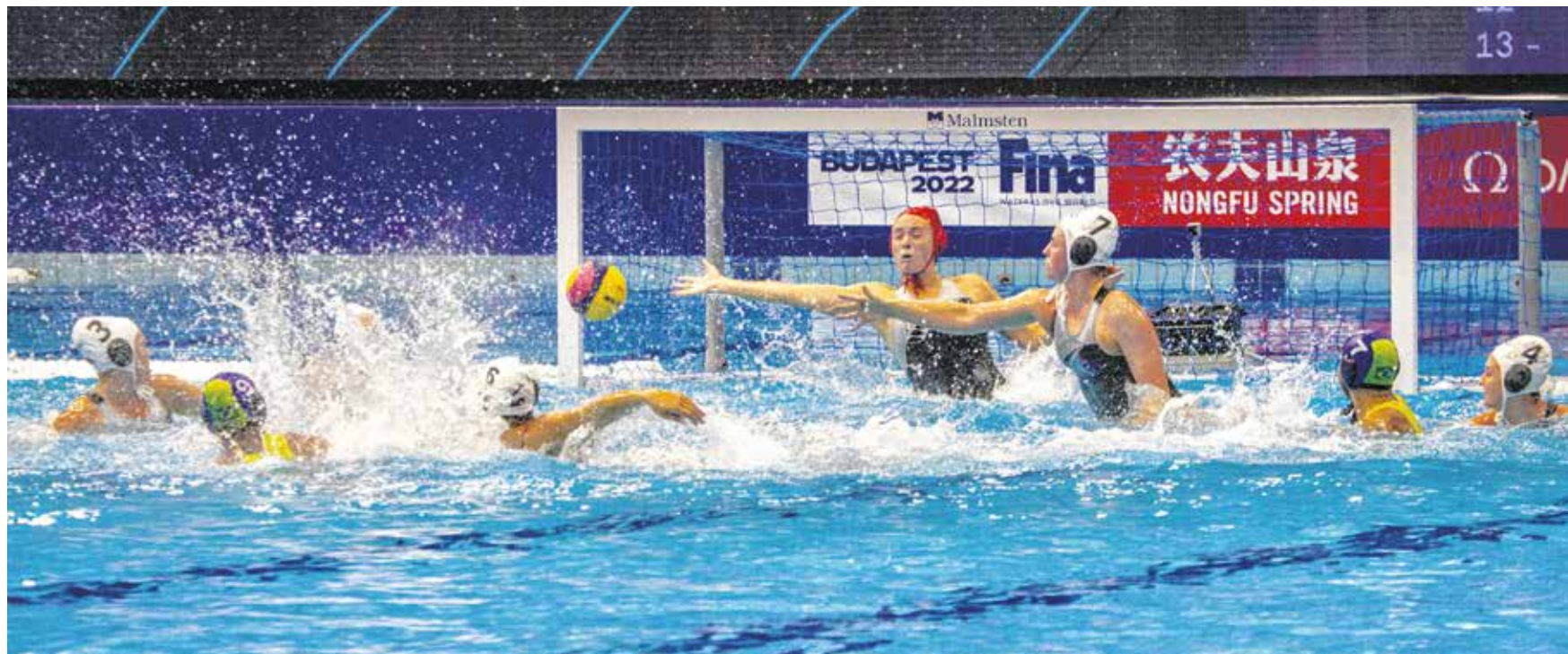
Az első soproni világbajnoki vízilabdameccsen Új-Zéland csapott össze Braziliával. A mérkőzést az új-zélandi együttes nyerte.

Azonban addig el is kellett jutni, hogy a Lóver uszodában világbajnoki mérkőzést rendezzenek. Év elején jelentették be, hogy Budapest mellett vidéki helyszínek is bekapcsolódnak a világbajnokság megrendezésébe. Sopronban két négyes csoport küzdelmeit láthatjuk mind a hölgyeknél, mind pedig a férfiaknál. Hétfőn, szerdán és pénteken női,