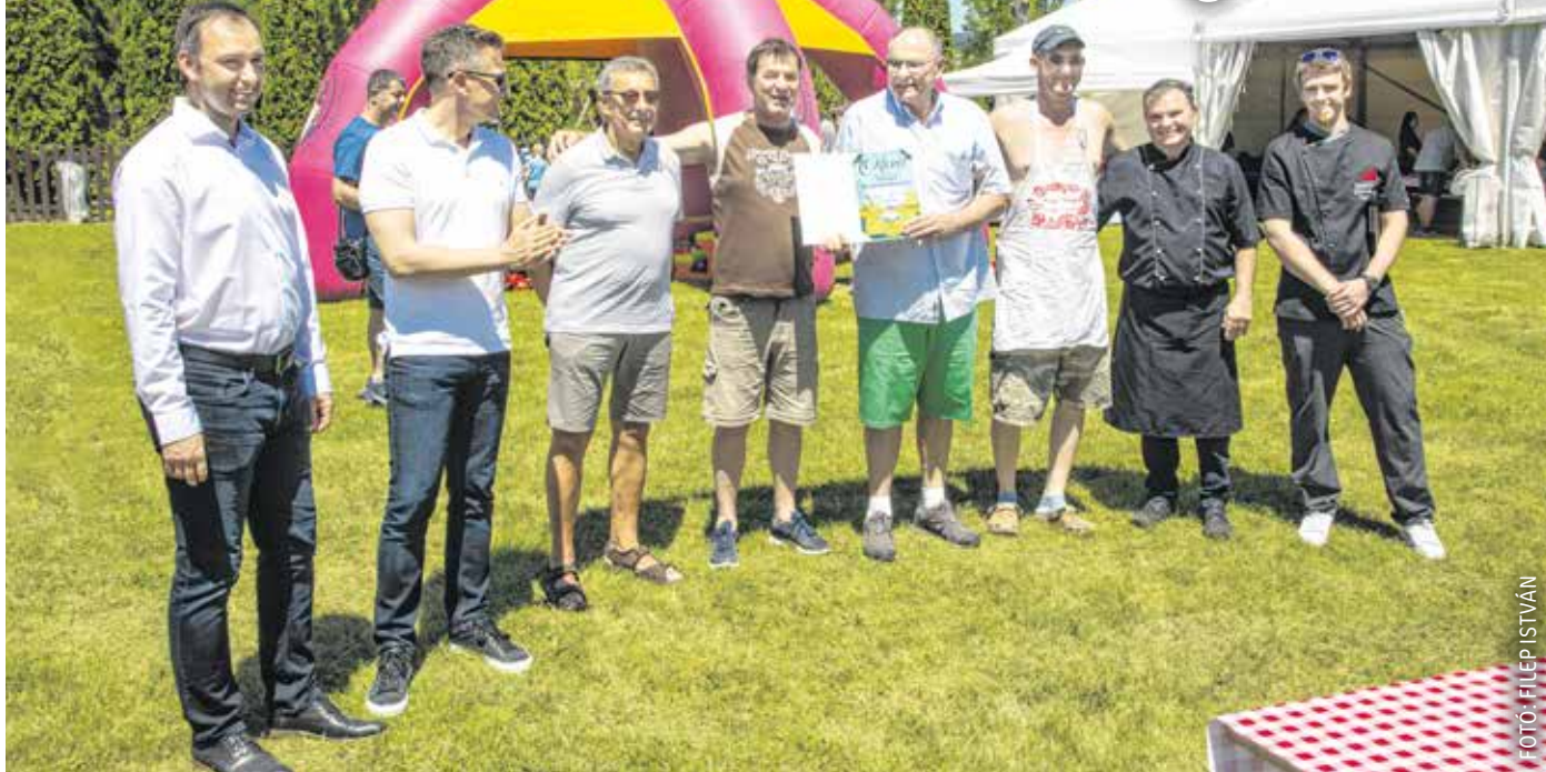
A győztes, Börtön csapat tagjai a zsűrivel – ezúttal is baráti társaságok, munkahelyi kollektívák indultak a pörköltfőző versenyen.