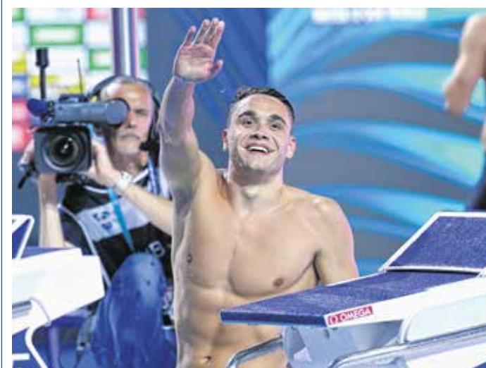
Milák Kristóf két aranyérmét is szerzett. A Honvéd 22 éves klasszisa 200 méter pillangón világsúccsal védte meg címét, és 100 méteren sem talált legyőzőre.