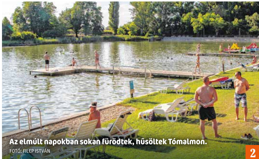
Az elmúlt napokban sokan fürödtek, hűsöltek Tómalmon.