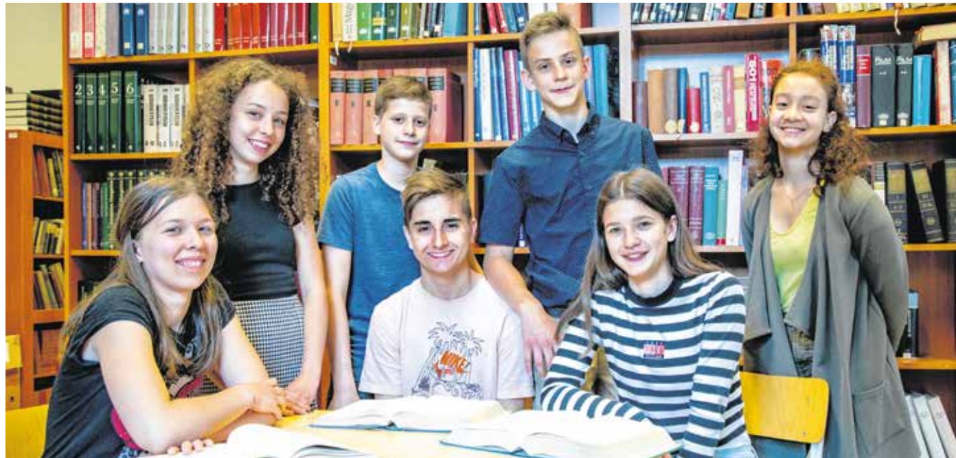
A Soproni Széchenyi István Gimnáziumot a 8.A osztály csapata képviselte a vetélkedőn.