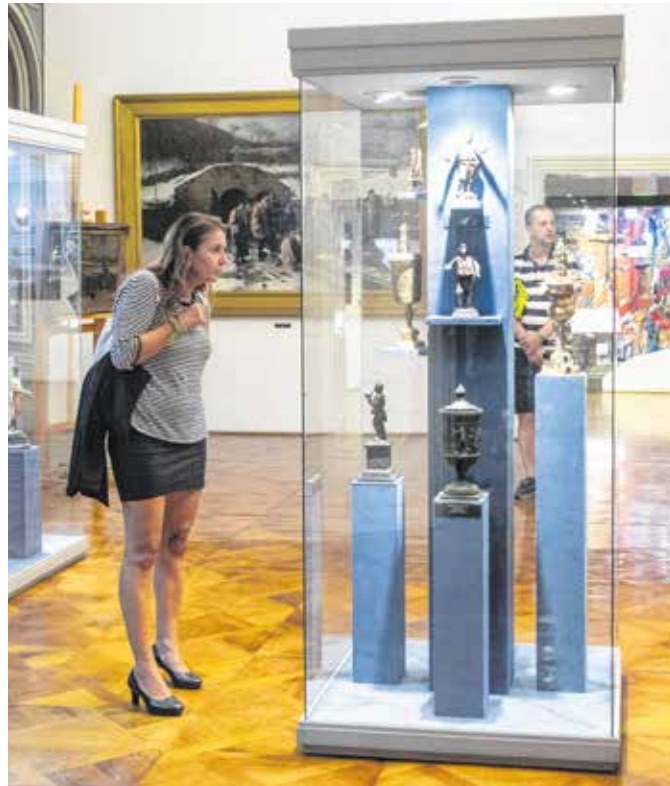
A bányászati múzeum kiállításait sokan megnézték, a Macskakő Gyermekmúzeumban pedig rengeteg kisgyermek készített gombékszert szüleiével.