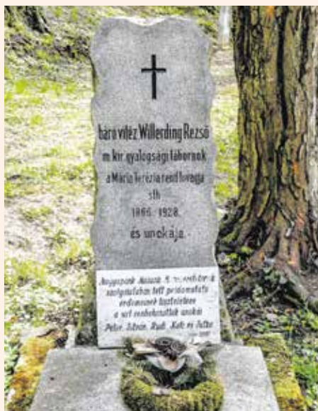
A sopronbánfalvi Hósi temetőben található Willering Rezső tábornok sírja.

Az 1918. novemberi összeomlást követően nyugállományba helyezték, és vissza-