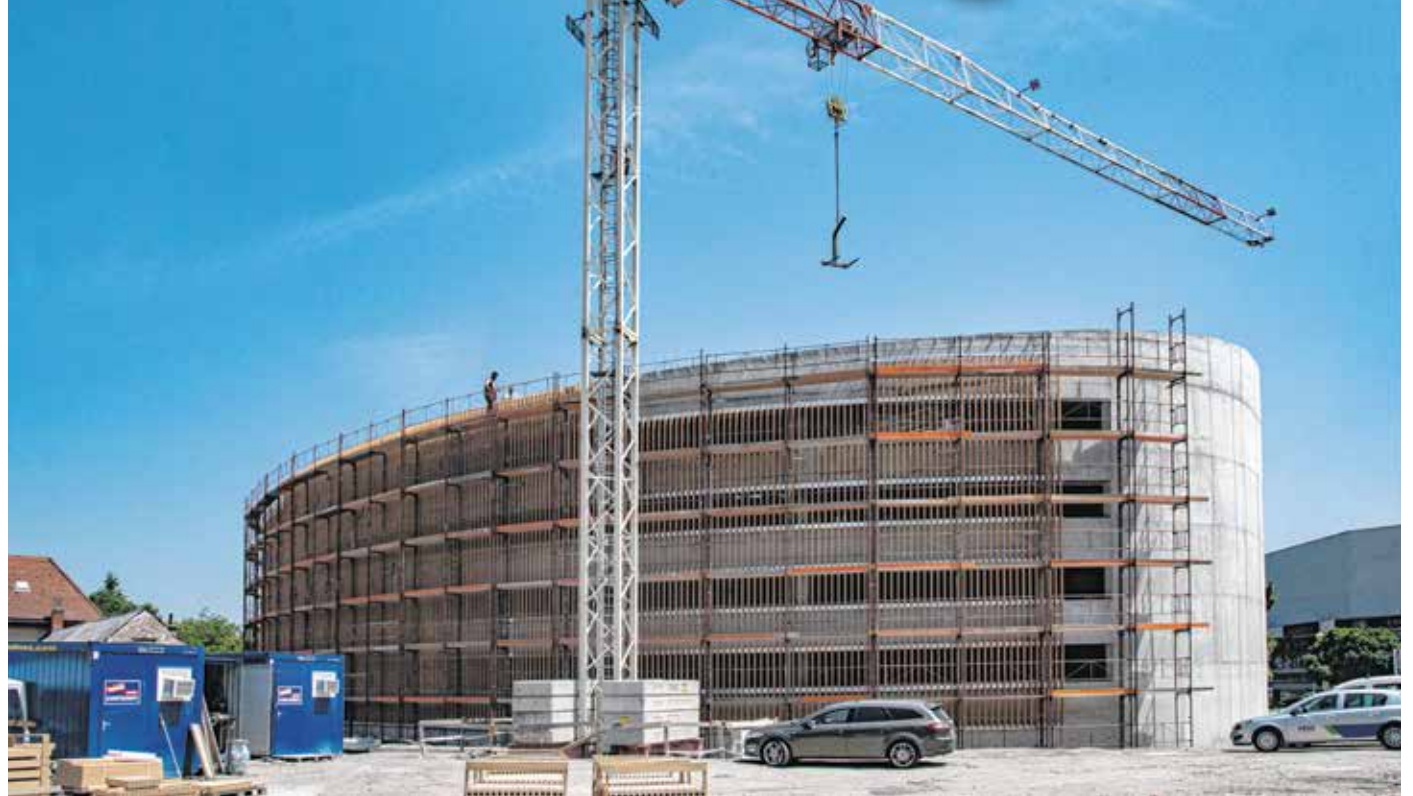
Folyamatosan dolgoznak a szakemberek a parkolóházban, a tervek szerint ősze elkészül az épület.