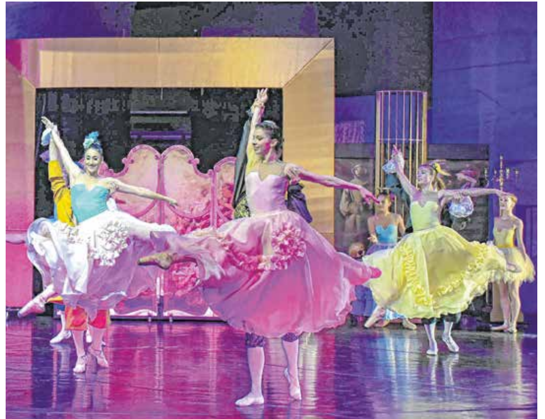
Carlo Broschi kalandos életét, eltöltött szerelme iránti érzéseit, önmagával vívott harcait mutatja be a grandiózus táncmű.

Már maga a történet is izgalmas: a Farinelli művészneven ismert Carlo Broschi (1705–1782) a XVIII. század egyik leghíresebb kasztrált operaelege, valamint a megújuló energiaforrások jelentőségére. Az olvasók gyorsan megtalálhatják itt akár a biokertészkedéssel, bioételekkel, az újrahasznosítással vagy a natúr kozmetikumokkal foglalkozó könyveket, kiadványokat. Kényelmes fotelokban, gyönyörű növényekkel körülvéve, kellemesen tölthetik el az időt a Zöld sarokban.