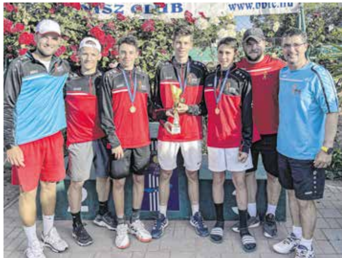
Az SVSE-GYSEV teniszesei megnyerték a korosztályos vidékbajnokság egyesületi pontversenyét.