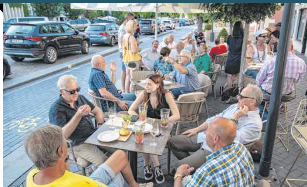
Az elmúlt hetekben megélné a élet a belvárosban is. Sokan kihasználják a jó időt, és kiülnek a teraszokra fagyizni, hűsítőket inni, kávézni, vagy az Eb-mérkőzéseit nézni. Szerencsére egyre több terasz nyílik a városban. A legújabb a múlt hét óta várja a vendégeket a várkerületi szépségszalonnán.