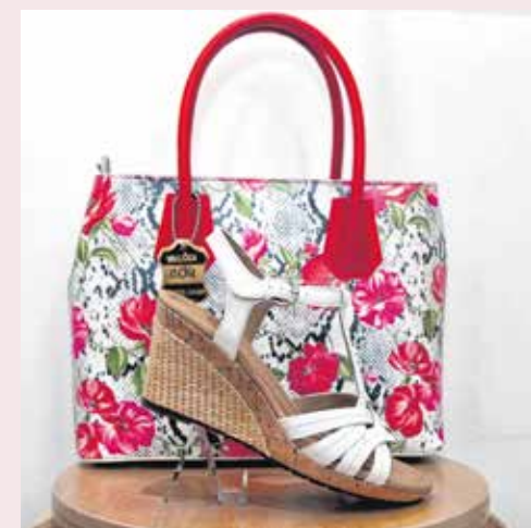
A vastag talp idén is divatos, valamint arra ügyelnek a hölgyek, hogy a táskák és a cipők harmonizáljanak.

A fehér, a sárga, a púder, a vízkék, a zöld és a fehér táskákon kívül a virágmintások is nagyon trendinek számítanak, ezeket azonban még véletlenül sem szabad mintás ruhával párosítani! Ma már nem szentírás, hogy a cipő és a táskák ugyanolyan színű legyenek, de lehetőleg tartozzanak azonos szín családba.