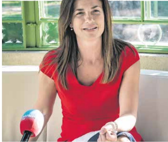
Varga Judit baráti meghívásra érkezett Sopronba, ahova saját bevallása szerint mindig szívesen jön.

– Nem tudjuk elégszer hangsúlyozni, hogy nem állhatunk meg. Az a cél, hogy minél több ember be legyen oltva, hiszen aki nincs, az elkaphatja a vírust. Vakcina van bőven, bármiből lehet választani. Jó érzés most újra együtt lenni, mindenki örül a nyárnak. Ugyanakkor meg kell erősíteni az országot!