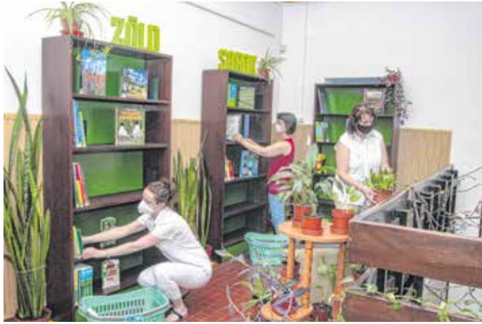
A környezetvédelemmel kapcsolatos könyvek kapnak helyet a könyvtár Zöld sarkában.