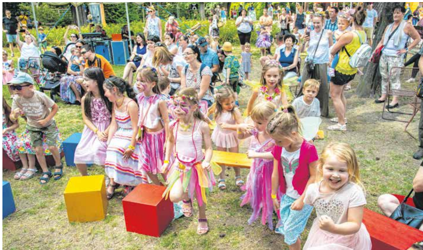
Kicsik és nagyok – tündérek és manók is jól érezték magukat az idei Tündérfesztiválon.

Sopron ikonikus gyermekrendezvényének a fő témája