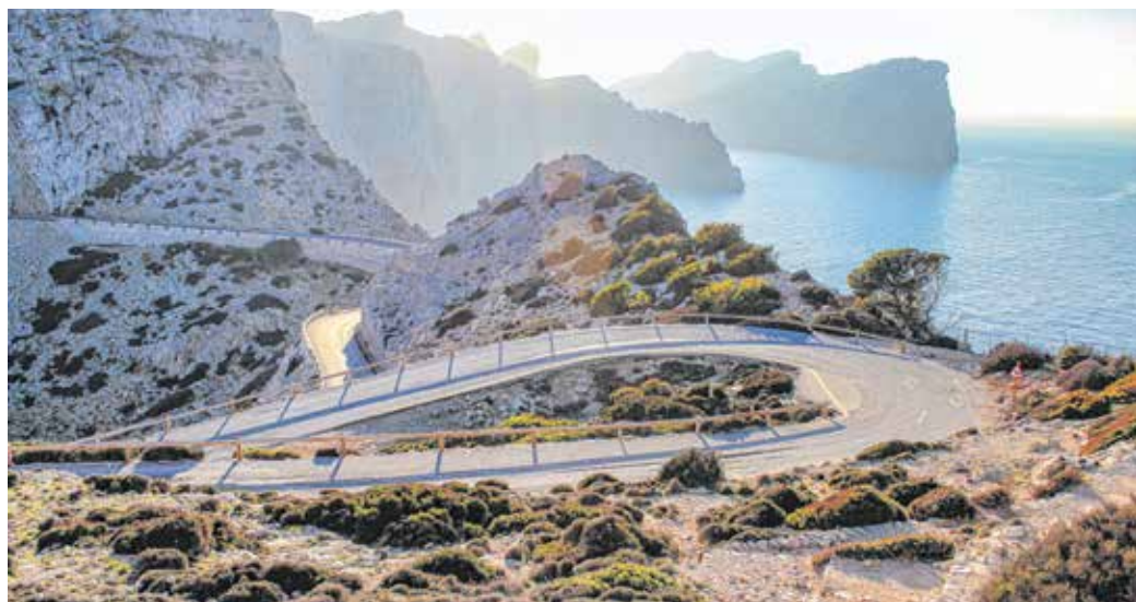
Lencsés Roland Spanyolországban készült felvétele lett a hónap fotója.