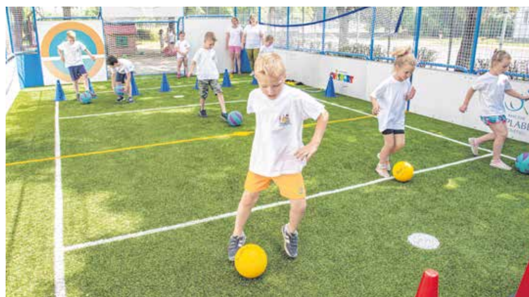
Korszerű körülmények között sportolhatnak a gyerekek a multifunkciós pályán.