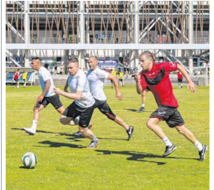
Tizenhat csapat vett részt a tizenhatodik SÜH kispályás labdarúgótornán.

Az eseményen jelen volt Czene Attila olimpiai bajnok úszó, a Magyar Szabadidősport Szövetség elnöke is, aki a szövetség nevében is arra buzdította a résztvevőket, hogy minél többet, minél változatosabban mozogjanak.