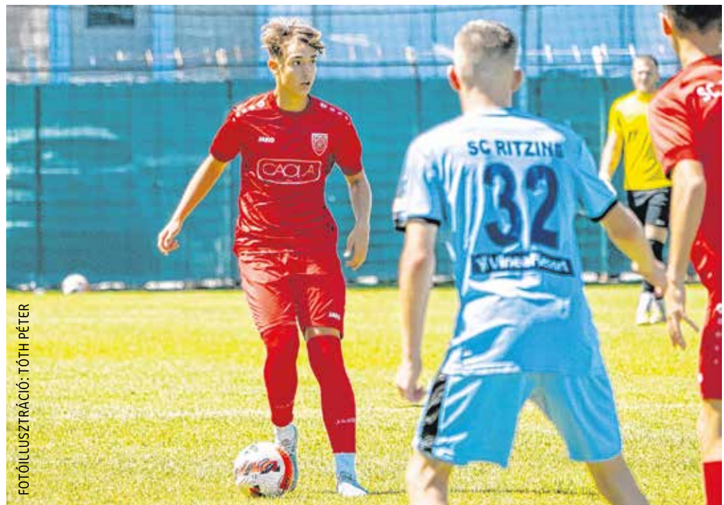
A Sopron játékosai még nem szereztek gólt az idei szezonban – szerdán ezen is változtatnának.