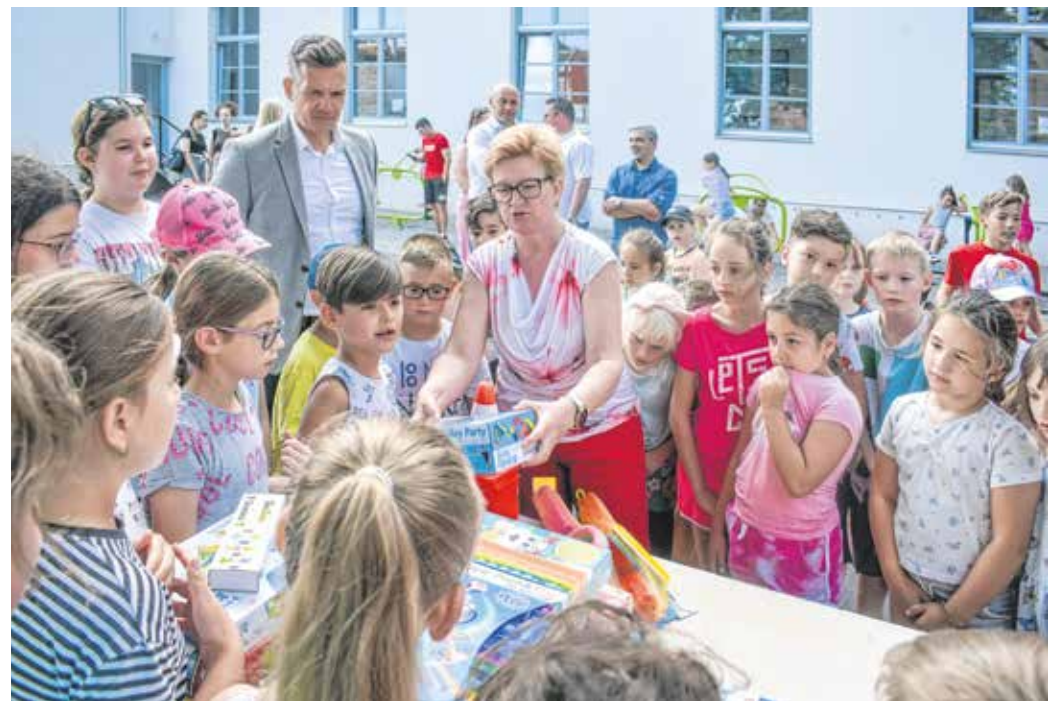
Július 3-tól augusztus 18-ig hetente 200–250 gyermek vett részt a nyári napköziben.