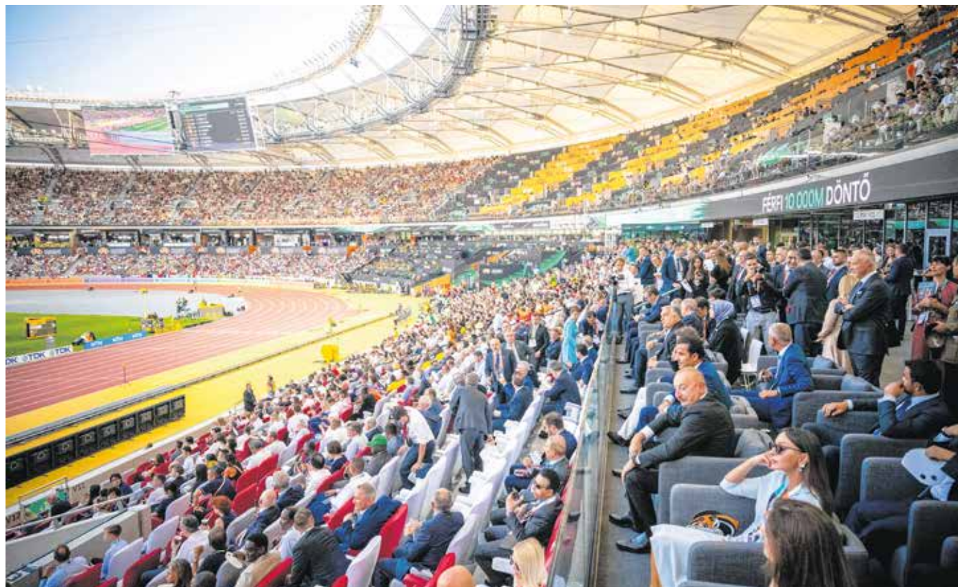
A Nemzeti Atlétikai Központban rendezik meg a versenyszámok többségét.