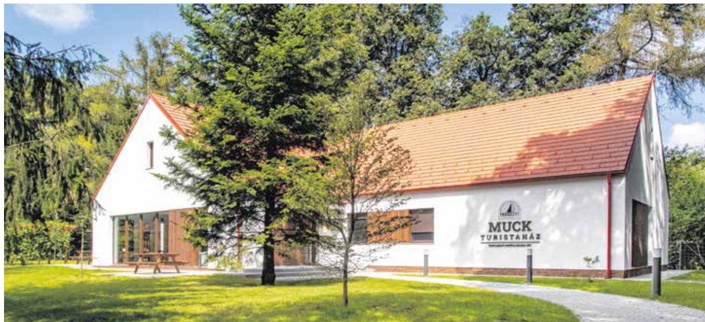
Az utóbbi időszakban különösen büszke a cég az Erdő Háza, illetve a Muck turistaház (felvételünkön) kivitelezésére.

Széles a tárháza a vállalkozás referenciamunkáinak. Az utóbbi időszakban különösen büszke a cég az Erdő Háza, illetve a Muck turistaház kivitelezésére, jelenleg Répcelakon, illetve Sopronban az Uszoda utcában épít saját fejlesztésű lakóparkot, a Fertő-Hanság Nemzeti Parkban egy téli szálláshelyet alakít ki a szürkemarha-állomány számára. Mindemellett jól működő, nagy építőipari cégek megbízható alvállalkozója.