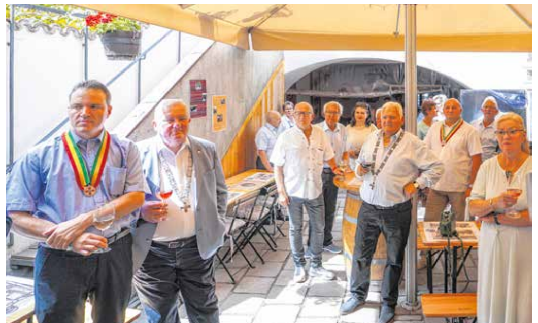
A Rejpál-ház felavatásáról emlékeztek meg a Soproni Borlovagok és Borbarátok Egyesületének tagjai. Az épületben igazi otthonra leltek.