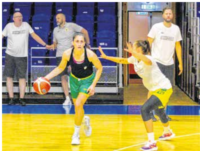
A Sopron Basket gőzerővel készül a magyar bajnoki és kupaküzdelmekre.

A Sopron Basket női kosárlabdacsapata is megkezdte a felkészülést a 2023–24-es szezonra. A klub ebben az évadban nem vállalta a nemzetközi szereplést, így kizárólag a Magyar Kupa, illetve a bajnoki mérkőzéseken lépnek pályára a játékosok.