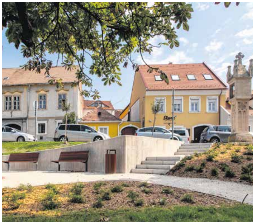
A Washington park felújítása elkészült, új padokat is elhelyeztek itt. A Szélmalom téren sétányokat, lépcsőket és támfalakat építettek.