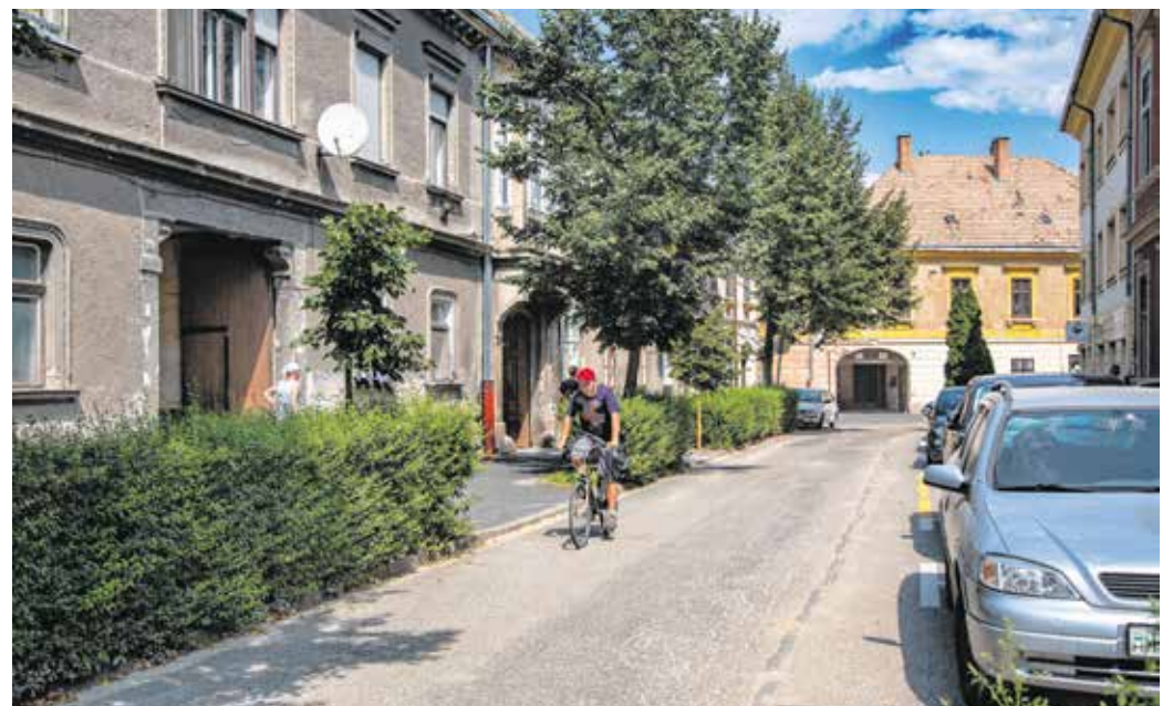
Újra járható az Újteleki utca, az ideiglenes piactér innen nyílik majd. A tervek szerint augusztus végén költöznek az árusok.