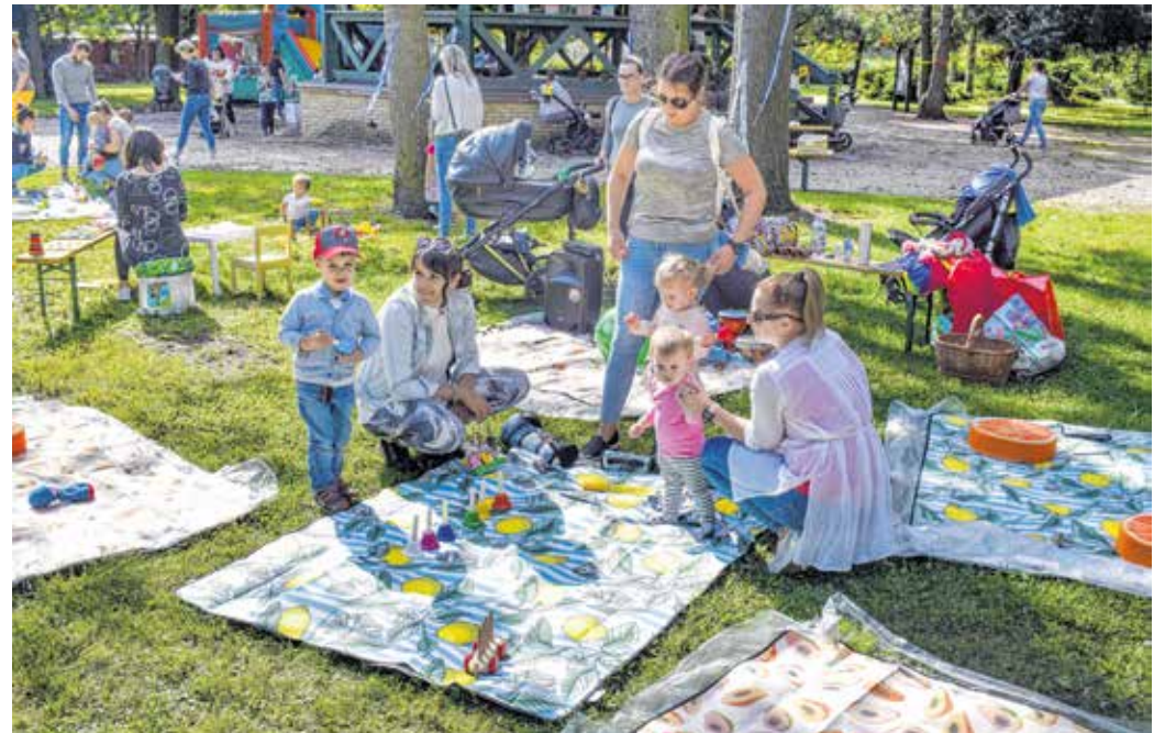
Egészségpikniket tartottak az anyatejes táplálás világnapja alkalmából Sopronban.