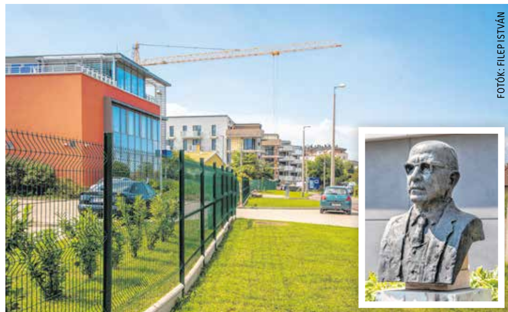
A Tárczy-Hornoch Antal utca Sopron északkeleti ipari területén, az Aranyhegyen található.

A város északkeleti peremén 1988–1992 között épült fel az Ív utcai lakótömb. Az Aranyhegyen a következő lakóépületek aztán az 1990-es években jelentek meg, a 2000-es éveket követően pedig, miután az utolsó téglagyár is