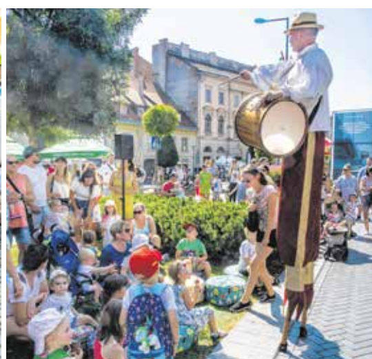
Megtelt emberekkel a bástyagödör, népszerűek voltak a kisgyermekeknek szóló programok is a soproni pikniken.