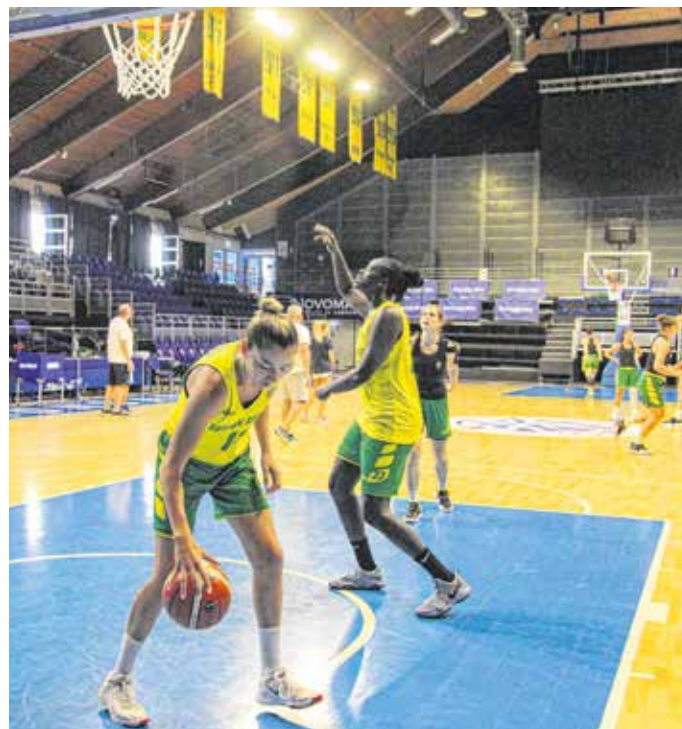
Már készülnek a következő szezonra a Sopron Basket játékosai.