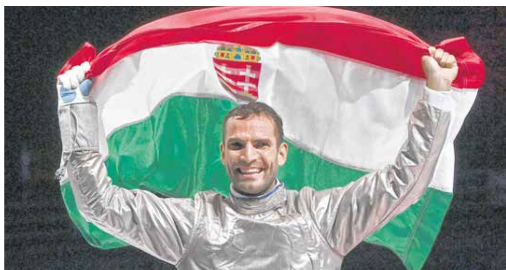
Szilágyi Áron, miután megszerezte sorozatban 3. olimpiai aranyérmét.