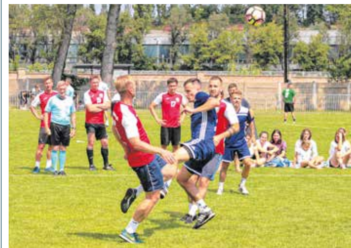
Népszerű volt az idei kispályás torna.