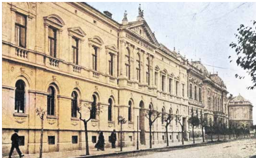
A Soproni Kereskedelmi és Iparkamara Lackner Kristóf utca 5. szám alatti székháza – 1904-től az 1948-as államosításig működött itt a testület, jelenleg a rendőrkapitányságnak ad helyet.

A soproni kamara alkalmazottjai, tisztségviselői