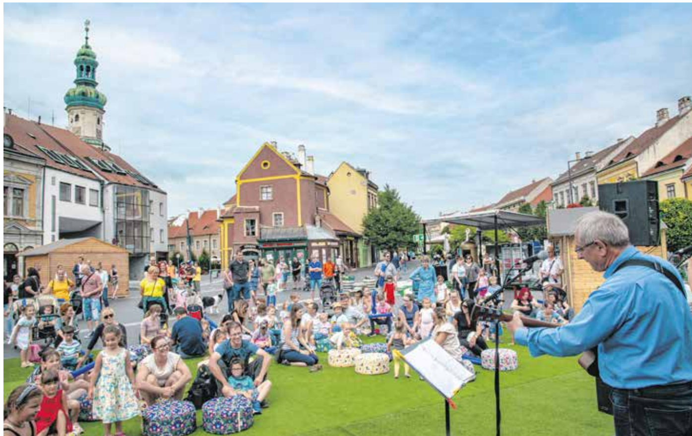
A koncertek mellett gyermekprogramokat is tartottak a Várkerületen, népszerű volt T. Horváth József előadása.