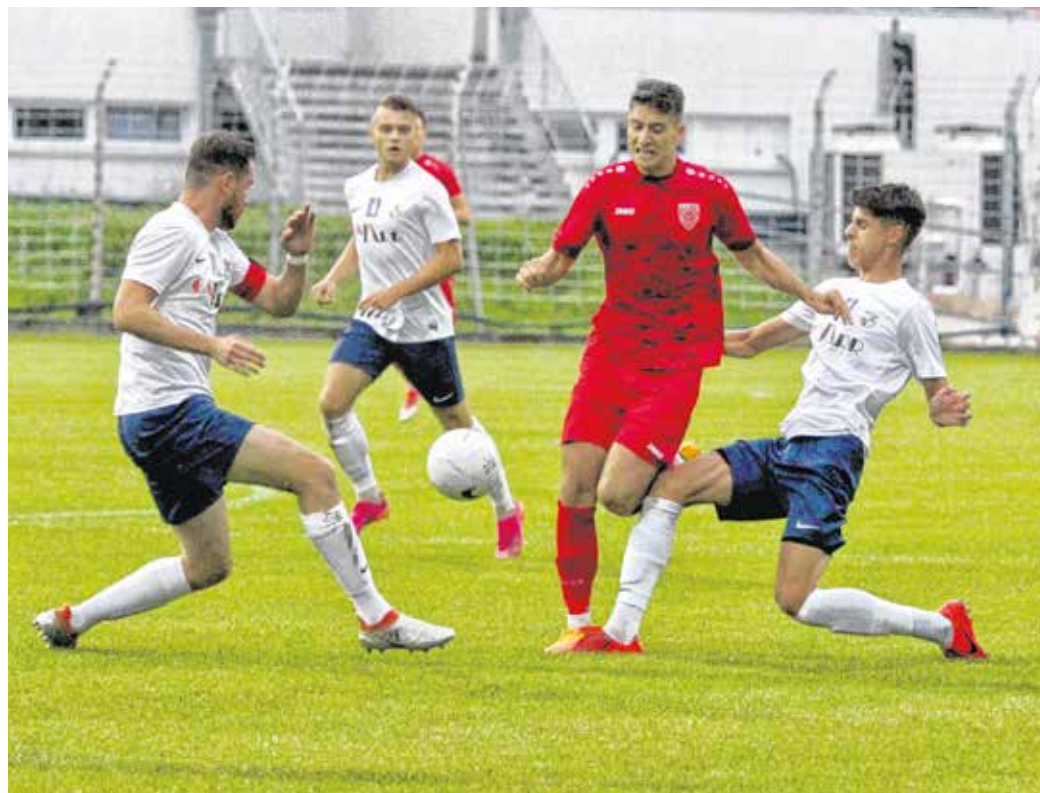
Több helyzetet is kialakított az András hida ellen a Sopron, végül 1-0-ra nyert.

A mai célunk a 3 pont megszerzése volt, amit vérejtékes győzelemmel sikerült elérnünk