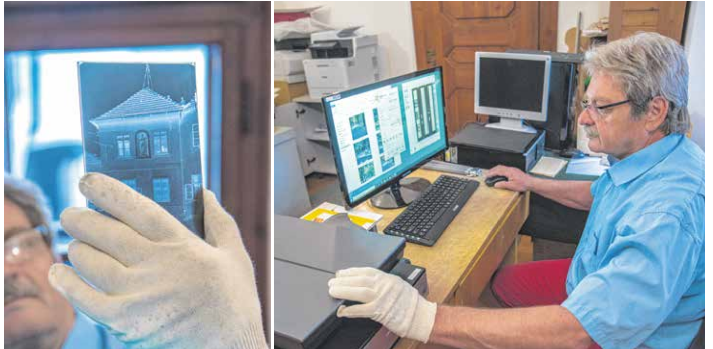
Horváth Péter Pál még azokról a felvételekről is kideríti, hol készültek, amelyeket addig senki sem tudott megfejteni.